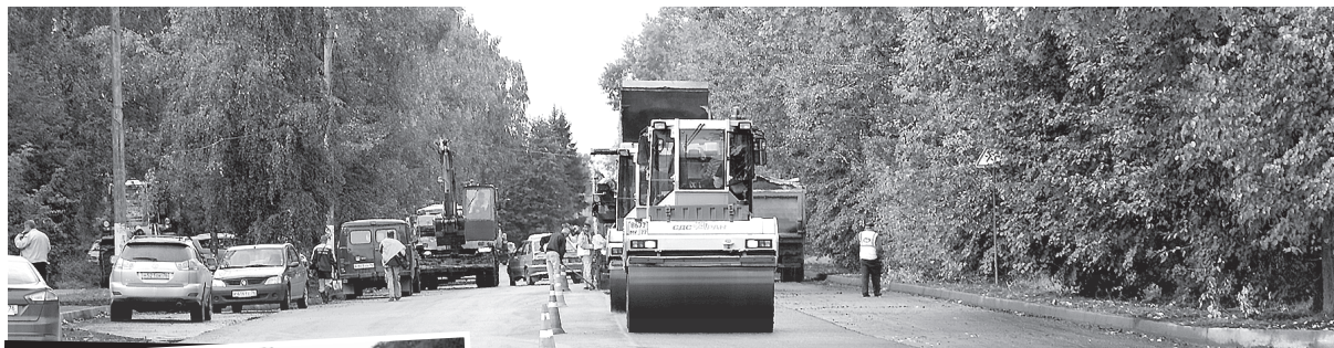
Сегодня на улице Менделеева полным ходом идет капитальный ремонт

Печатная площадь предоставлена кандидатам в депутаты Переславль-Залесской городской Думы шестого созыва по многомандатным избирательным округам на основании пп. 1 п. 67 закона Ярославской области «О выборах в органы государственной власти Ярославской области и органы местного самоуправления муниципальных образований Ярославской области».