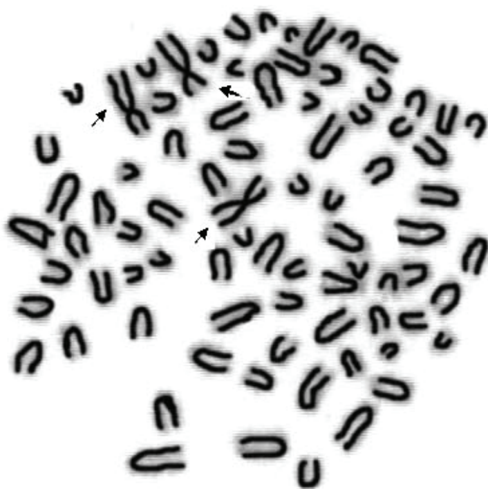
Рис. 4. Метафазная клетка из культуры лимфоцитов суки породы шелти с дополнительной женской половой хромосомой На рисунке X-хромосомы показаны стрелками