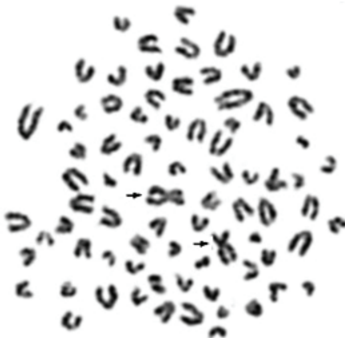
Рис. 2. Метафазная клетка из культуры лимфоцитов кобеля породы малый пудель с женским набором половых хромосом На рисунке X-хромосомы показаны стрелками

У этого же кобеля отмечен повышенный уровень полиплоидии — около 4%. Но мы не склонны рассматривать этот фактор как показатель, характеризующий нежелательную нестабильность кариотипа, хотя такие предположения существуют [8]. Этот показатель [4], скорее всего, в большей мере связан с энергией роста животных, чем с уровнем нарушений в хромосомном наборе при созревании их гамет.