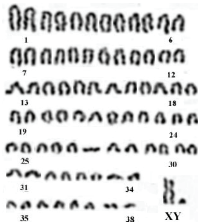
Рис. 1. Кариотип домашней собаки. Кобель породы малый пудель

У второго кобеля был обнаружен химеризм по половым хромосомам (XX/XY). В значительной части исследованных лимфоцитов (36,5%) присутствовали две женские хромосомы (рис. 2). Однако в большинстве клеток (63,5%) у этого животного генетический пол, определяемый по набору половых хромосом, соответствовал фенотипическому.