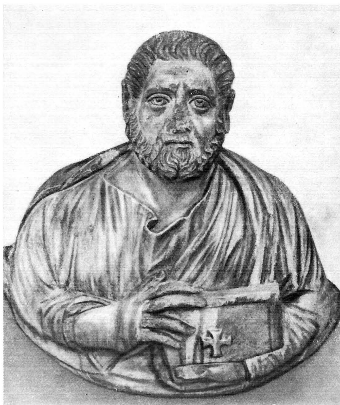
Евангелист. Скульптура VI в.