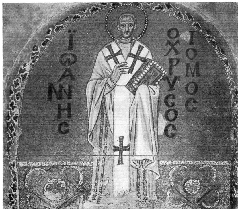
Иоанн Златоуст. Мозаика X в.