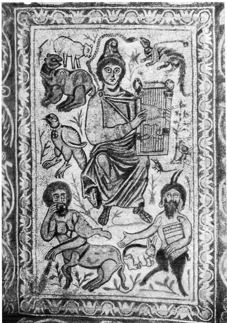
Орфей среди животных. Мозаика VI в.