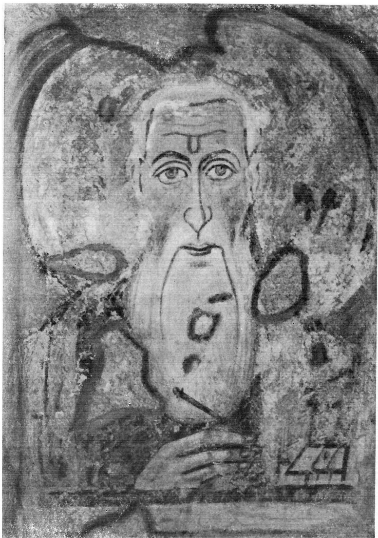
Святой Аввакум. Фреска VI в.