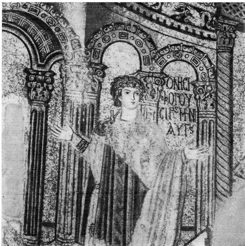
Молящийся мученик. Мозаика VI в.