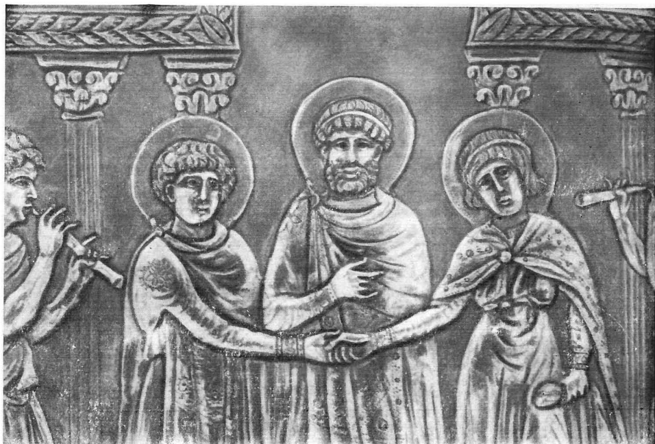
Свадьба Давида. Чекан VI в.