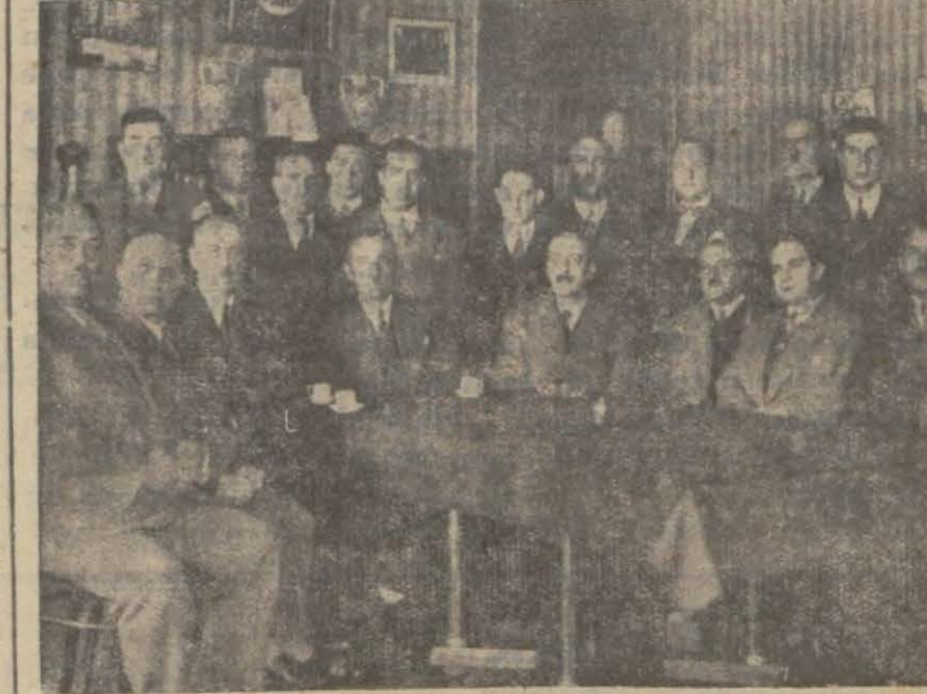
İstanbul fabrikatörlerinin sanayi birliğinde çekilen resimlerinden

Kendilerine lâzım olan iptidai nisaneleri bu kooperatif temin edecek