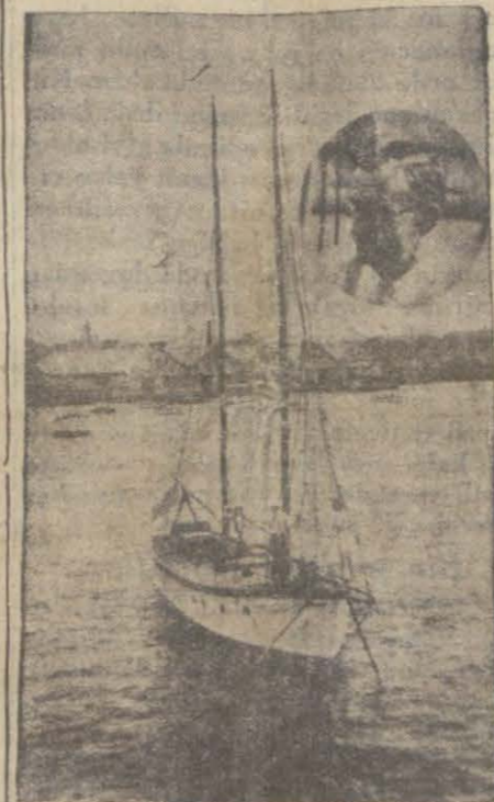
Mr. Miles ve gemisi

Kaçak kâğıtların bütün inhisar idaresine teslimi lâzım geldiğinden, dün bu devir muamelesi yapılmıştır.