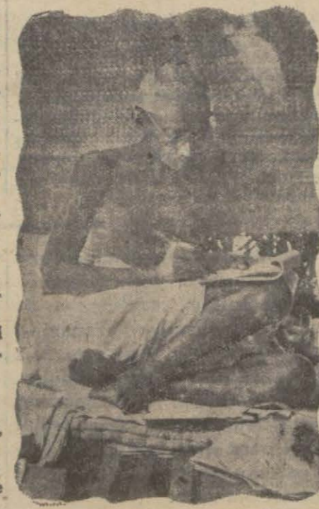
Tevkif edilen Gandhi'nin 110 kilometre şimalinde tevkif etmek tasavvurunda bulunmakta olan ferle seyahat ettiği sırada Bombay'

Şarkta Türk - İran münasebatında yeni bir merhaleye vâsil olmuş bulunuyor. Bundan böyle iki devlet ve komşu memle-