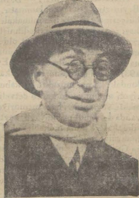
Hariciye Vekili Tefik Rüştü Bey. muhabbetlerinin iblâğım rica etmiş, muhterem vekilimize iyi

Tahran'a gidecek olan Hariciye Vekilimize iyi muhabbetlerinin iblâğım rica etmiş, muhterem vekilimize iyi