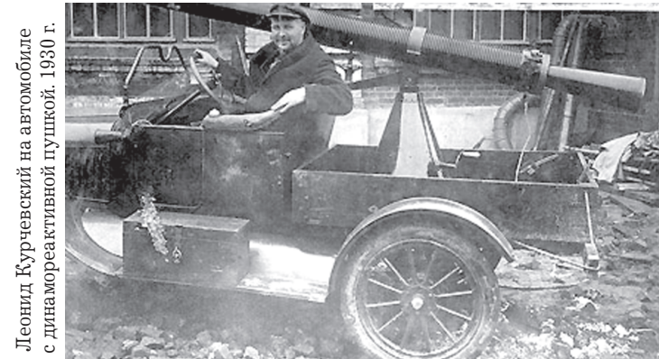
Леонид Курчевский на автомобиле с динамо-реактивной пушкой. 1930 г.