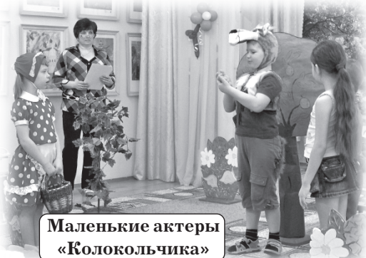
Маленькие актеры «Колокольчик»

Накануне Дня Земли, который во всем мире отмечается 22 апреля, в рамках Международной природоохранной акции «Марш парков-2011» и Всероссийских Дней защиты от экологической опасности в национальном парке начался Фестиваль детских экологических театров «Проталинки». В этом году его открыли коллективы детских садов «Малыш» и «Колокольчик».