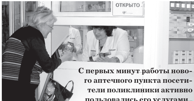
С первых минут работы нового аптечного пункта посетители поликлиники активно пользовались его услугами...

Удивительное совпадение: 7 апреля, оказывается, отмечался Всемирный День здоровья! А, впрочем, что же здесь удивительного - профессионалы своего дела из аптечной сети «Альтаир» давно стоят на страже здоровья переславцев!