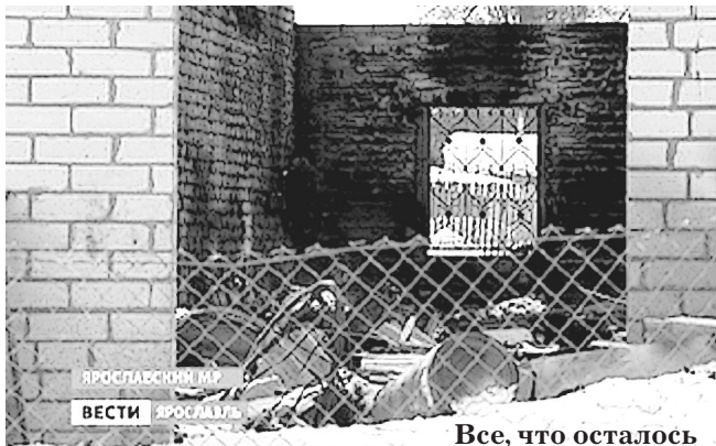
Все, что осталось от собачьего приюта в Меленках