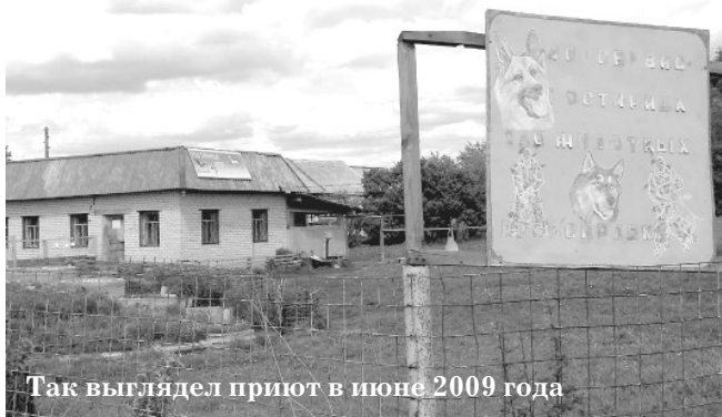
Так выглядел приют в июне 2009 года