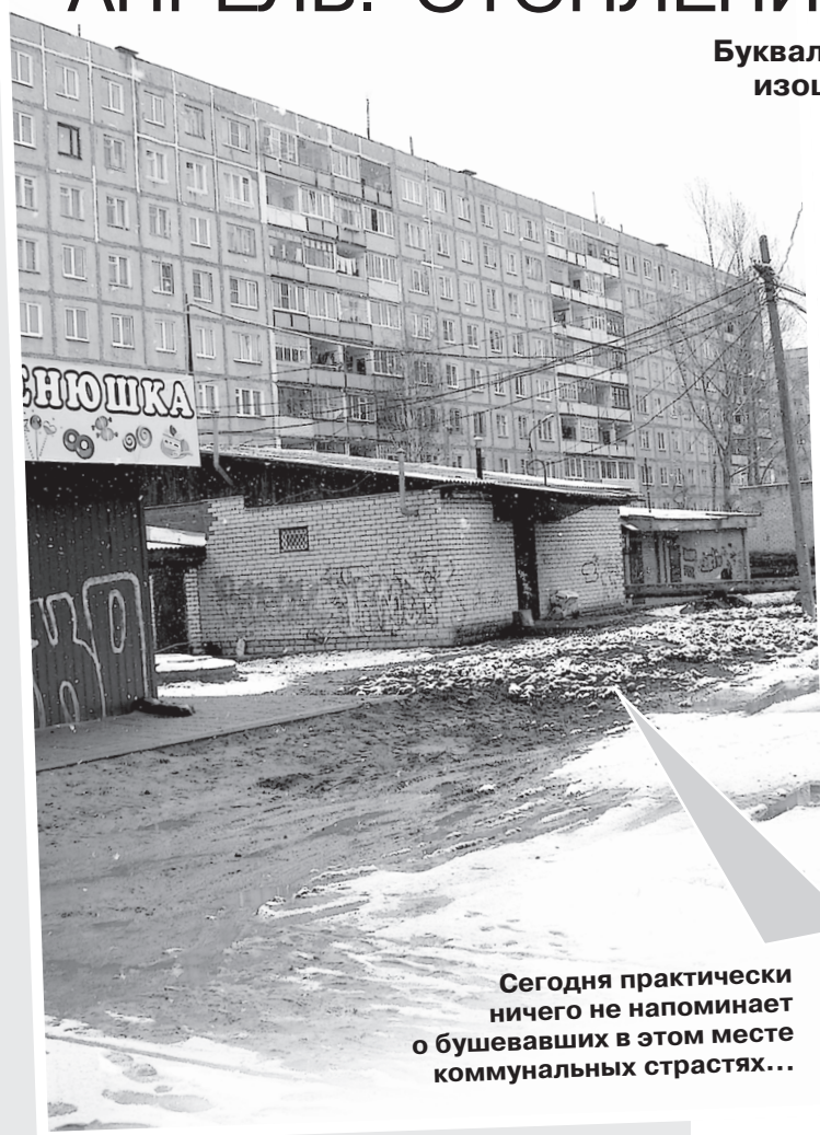
Сегодня практически ничего не напоминает о бушевавших в этом месте коммунальных страстях...