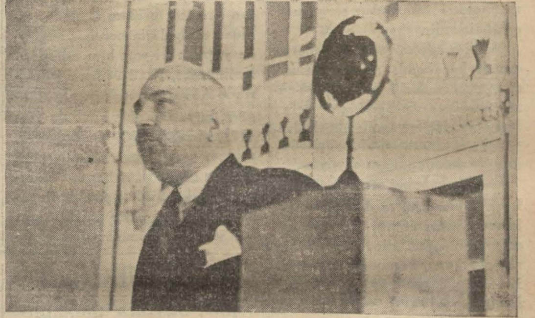
Recep bey ilk dersini verirken

“Türkiye bir inkılâp memleketidir, fakat ne sokaklarda dövüşler oluyor, ne halk kütlelerinin mütemadiyen ayaklanıp bir şeyler istediği görülüyor,”