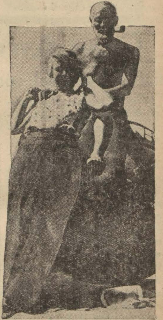
Van Dongen hayranlarından birle birlikte plajda

Van Dongenin salonlarında her memleketten ve her muhitten elli, altmış kadın ve erkek var. Yeni sinema yapmaya başlamış, pek genç ve pek sarı bir Paris kıızı büfenin önünde davetlilere ikram ediyor. Acaba, bu renkli ve reyihalı bahar çiçeği üstadın kıyımı mı şenlendiriyor? Kim bilir; belki tezatların incizabı... Zaten Van Dongen, güzel kadınların ressamı olduğu kadar dostu ve sevdahısı-