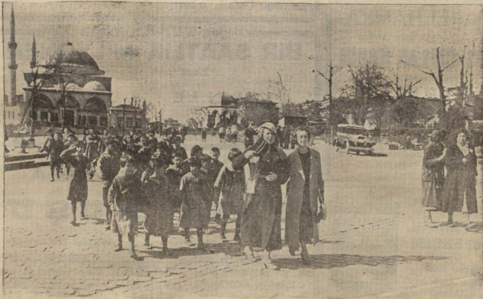
Havaların iyi gitmesi yüzünden mektepler kur gezintileri tertibine başlamışlardır. Resmimizde bir mektep talebesi tenezzühe giderken görünüyor.

Bina vergilerine gelince, sayfiyelerini kiraya vermek üzere istifade eden Adalılar müstesna olarak İstanbulun diğer kazalarında bina vergileri haziran, eylül, kânunuevvel, mart aylarında ve Adalarda temmuz ve teşrinisani aylarında tahsil edilecektir.