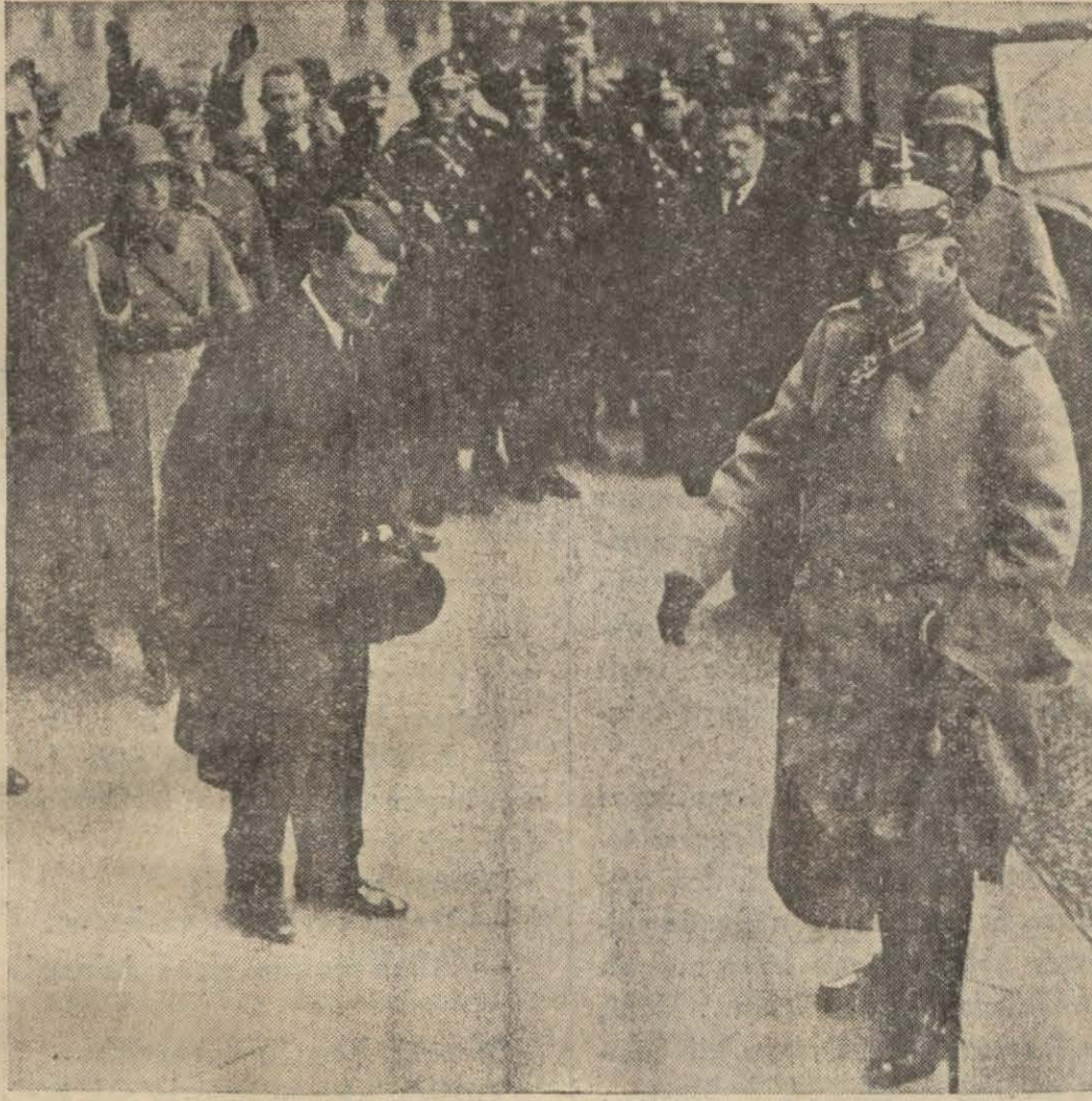
M. Hitler, alman reiscumhuru mareşal Hindenburgun karşısında eğiliyor

Marlenenin yerinde bulunan diğer her hangi bir kadın böyle bir teklifi memnuniyetle kabul eder ve ilk tren binerek Almanya'ya giderdi. Halbuki Marlene teklifi kabul etmemiş, Amerikada artist-