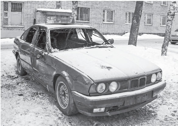
Сгоревший BMW на улице 50 лет комсомола

По данным командования ПСЧ-28 ФГКУ «4 ОПС по Ярославской области».