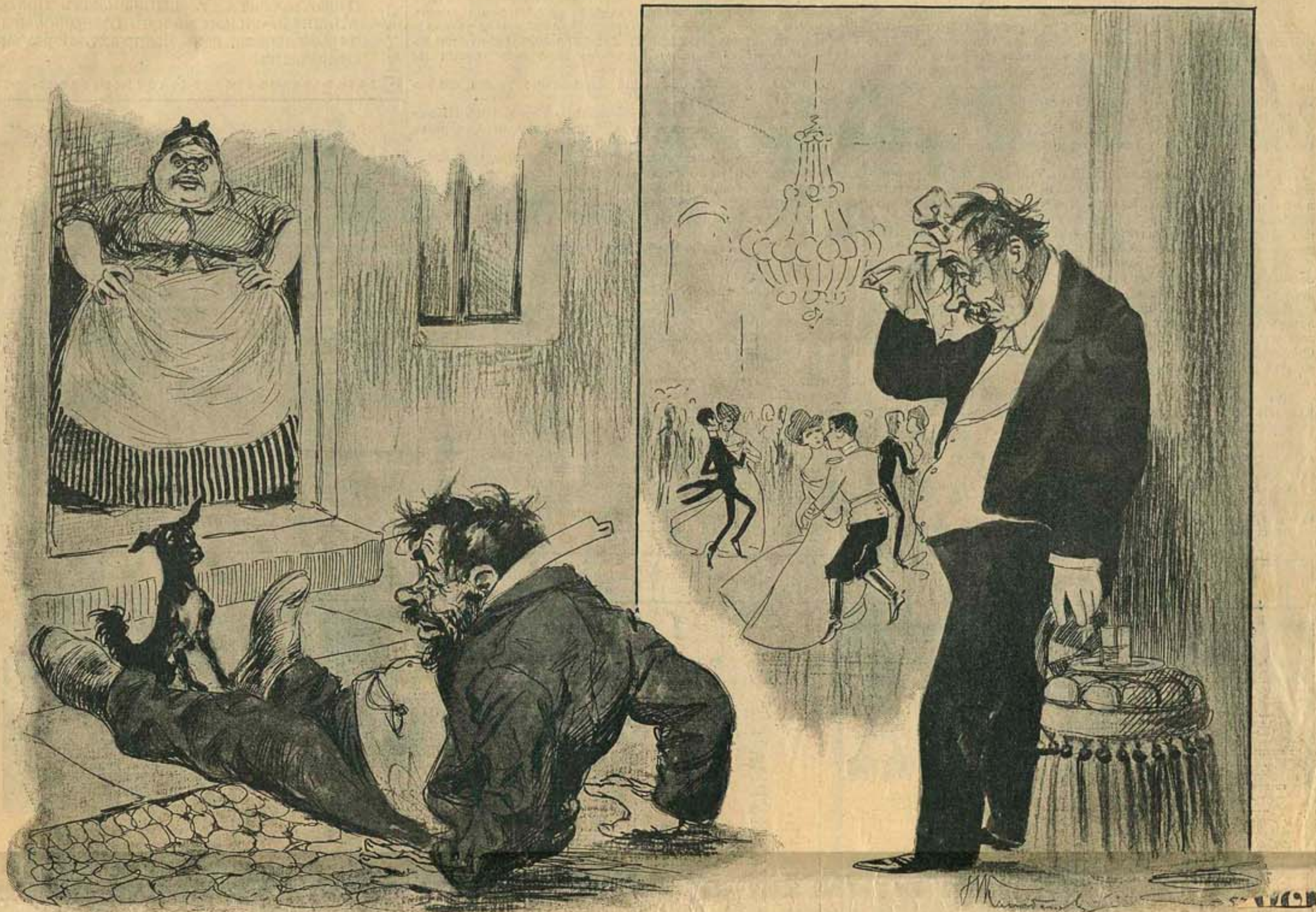
— Однако, ловко дерется моя супружница... Какая она стала крепкая, да здоровая!.. Сам виноват: вачём я так много пил за ея здоровье!..