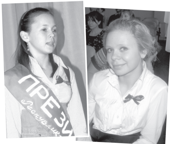
Новый президент республики ШКИД (слева) и ее предшественница

ОБЪЕДИНЕНИЮ УЧЕНИКОВ ПЕРВОЙ ШКОЛЫ ИСПОЛНИЛОСЬ 10 ЛЕТ