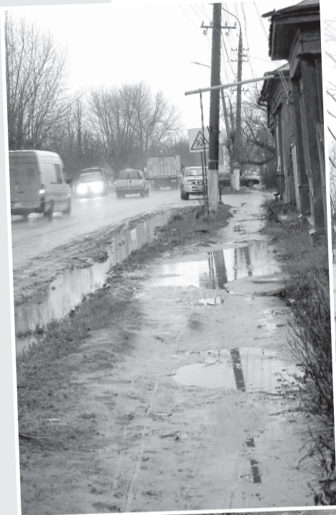
Тротуары на улице Кардовского - центральной улице города. Обратите внимание на лежащее на заборе старое дерево: оно никому не мешает, потому что здесь все равно не пройти...