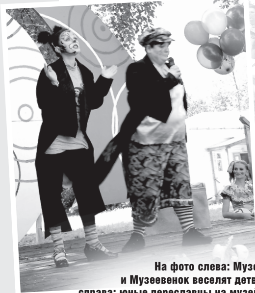
На фото слева: Музея и Музеевенок веселят детвору; справа: юные переславцы на музейной поляне - настоящем «Острове детства»!