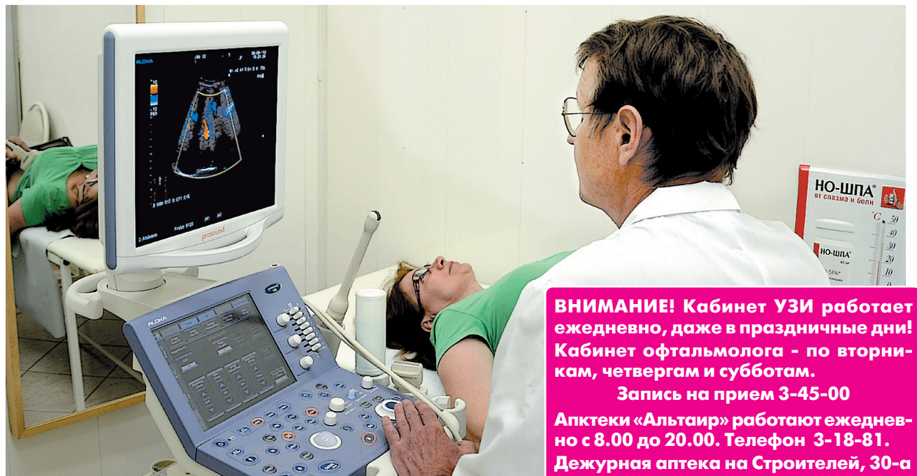
Обследование с помощью аппарата ультразвуковой диагностики

ВНИМАНИЕ! Кабинет УЗИ работает ежедневно, даже в праздничные дни! Кабинет офтальмолога - по вторникам, четвергам и субботам.