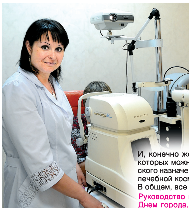
В кабинете офтальмолога

Руководство и персонал «Альтаира» поздравляют переславцев с Днем города, а всех медицинских работников Переславля - с их профессиональным праздником! Желаем всем вам счастья, здоровья и благополучия! А главное пожелание такое - не болеть!