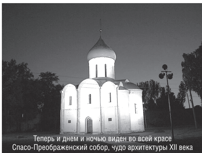
Теперь и днем и ночью виден во всей красе Спасо-Преображенский собор, чудо архитектуры XII века

- Наш День города имеет особое звучание. Помните, всероссийский конкурс, в котором Александр Невский стал Именем России? Так что для города, в котором Александр Невский родился, это особый праздник. В этот день здесь соединяется история страны, история Ярославской области, история Переславля-Залесского. Переславская земля - один из символов и красивейших уголков всей русской земли. Поздравляю всех переславцев! Мы должны гордиться, что живем здесь!