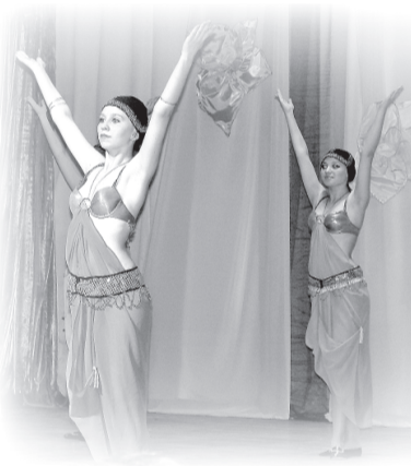
...и ее воспитанники