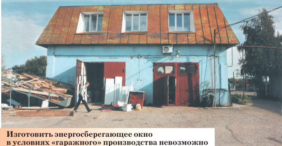
Изготовить энергосберегающее окно в условиях «гаражного» производства невозможно

Покупая пластиковые окна в небольших компаниях, вы рискуете... Чем именно? Многим! В обычное время - качеством окна, монтажа, сервисного обслуживания. Сегодня в условиях кризиса к этим рискам добавляются новые. Клиенты небольших фирм могут вообще остаться без окон или гарантийного ремонта, поскольку подобные компании сворачивают свою деятельность из-за отсутствия заказов. Чтобы в этом убедиться, достаточно посмотреть рекламные странички местной прессы. Если раньше в них пестрели рекламные блоки 20 оконных фирм, то сейчас таковых насчитывается от силы десяток. Что будет с оставшимися компаниями через год-два - одному Богу известно. Куда будут обращаться клиенты разорившихся компаний? Жутковато будет звонить по телефонам офиса и неделями слышать длинные гудки. Но и это еще не все.