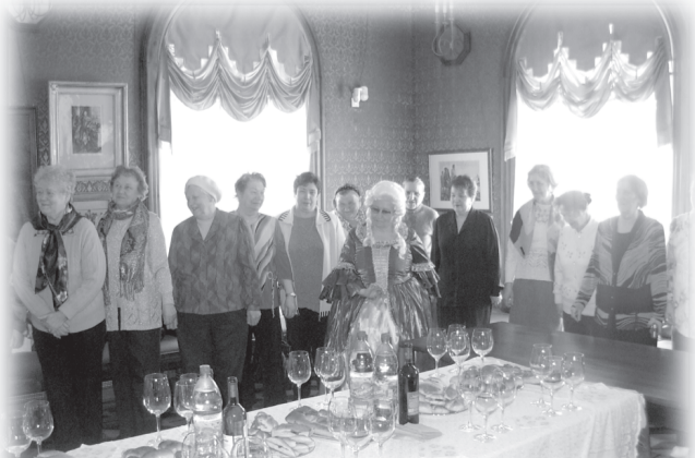
В действе участвовали все с настроением

мат и «Боевое братство», кадеты второй школы, историко-архитектурный и художественный музей, который подарил своим гостям самую лучшую туристическую программу - Петровскую ассамблею. В презентационном зале Ротонды на территории музея-усадьбы бывшие малолетние узники с интересом и восторгом слушали словоохотливых барышень из XVIII столетия, осваивали замысловатые фигуры минуэта, а также язык жестов и мыслей с помощью веера и мушек. По всеобщему мнению, эта встреча получилась необычной, и организаторы есть чем гордиться: они подарили вместо слез, свойственных этому памятного в своей скорби событию, улыбки.