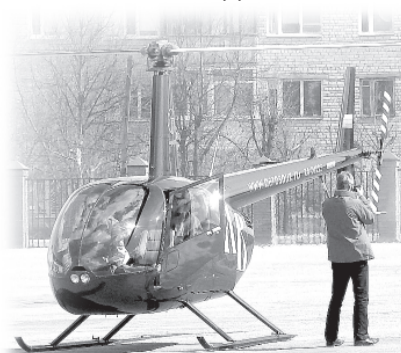
Паломники прилетели на вертолетах Robinson