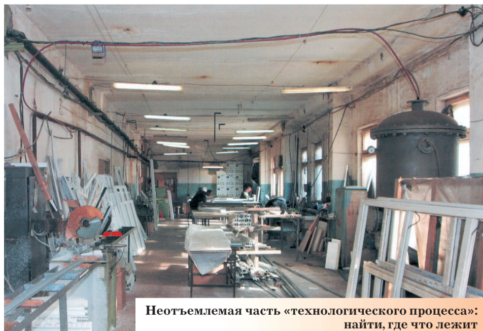
Неотъемлемая часть «технологического процесса»: найти, где что лежит

В отличие от небольших фирм, компании-лидеры и их клиенты чувствуют сейчас себя уверенно. Количество заказов, если и снижается, то незначительно. Помогают нарабатываемая годами репутация и клиентская база. Официальное представительство компании Kaleva работает в Переславле и Переславском районе уже второй год. За это время заключено свыше 800 договоров на установку пластиковых окон. Для небольшого города - цифра очень показательная! Заказывать окна у нас стало престижно. Наши клиенты рекомендуют окна Kaleva своим родным и знакомым. В компании работают собственные бригады монтажников, прошедшие обучение на головном предприятии. Все возникшие вопросы решаются на месте и не откладываются в долгий ящик. Каждое действие монтажников под контролем.