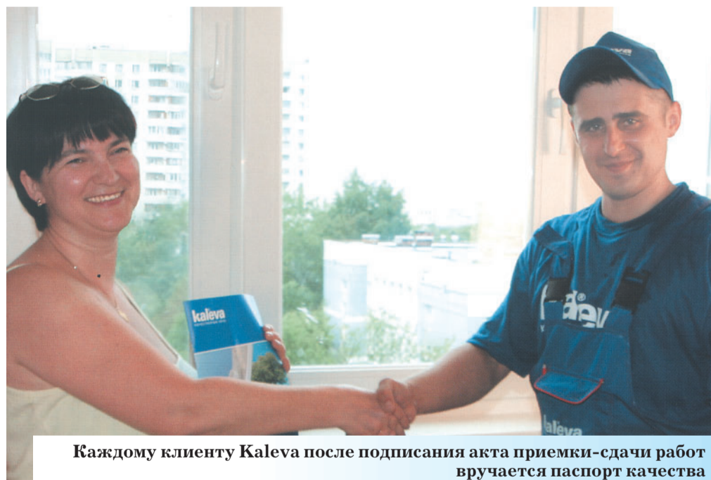
Каждому клиенту Kaleva после подписания акта приемки-сдачи работ вручается паспорт качества

Не экономьте на качестве жизни и своих нервах, заказывайте окна у лидера отрасли - компании Kaleva!