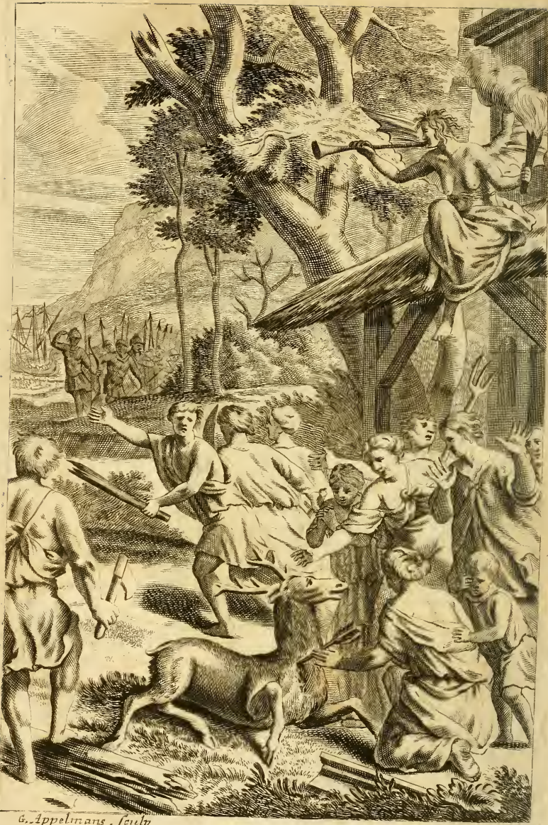
G. Appelmans . sculp