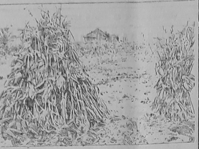
С поля, засеянного отборными семенами.