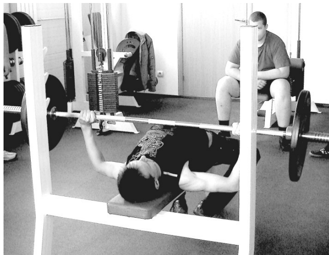
Силачи соревновались в жиме штанги лежа