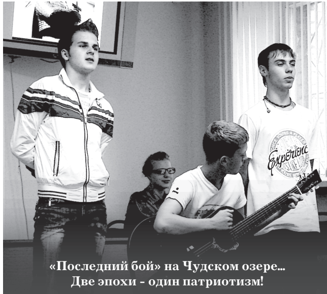
«Последний бой» на Чудском озере... Две эпохи - один патриотизм!