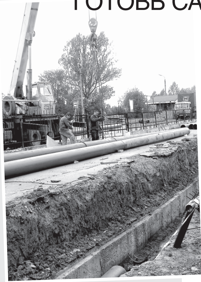
Масштабная работа по ремонту магистрали, проходящей по территории «Славянского базара», проходит с опережением установленных сроков