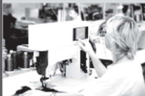
График работы 2/2. Оформление по ТК.