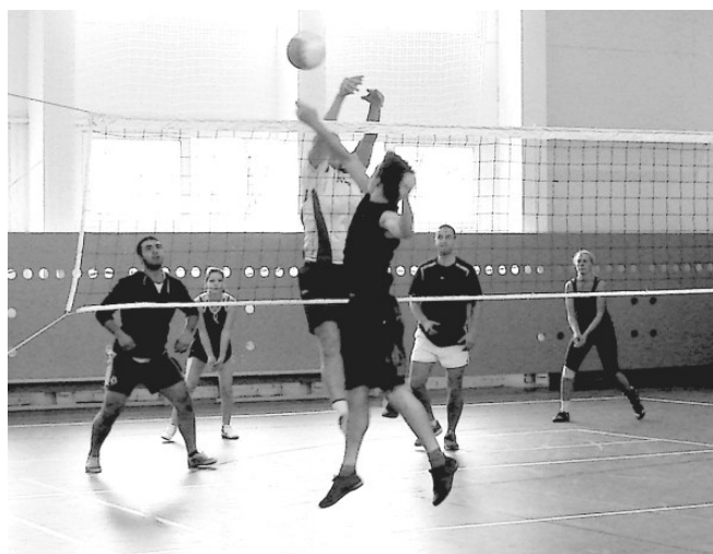
Под сеткой развернулись волейбольные баталии...