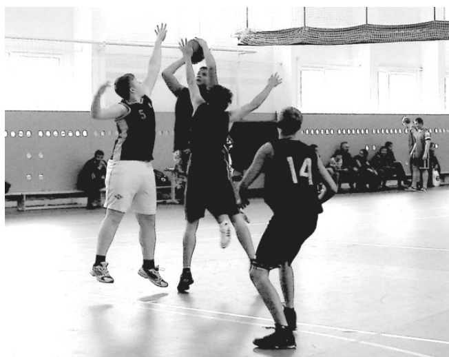
...а под корзиной сражались баскетболисты

Оказалось, что запланированные на свежем воздухе мероприятия отменили из-за дождя. А как же «матч состоится в любую погоду»?