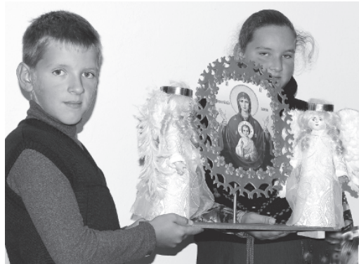
В Дни памяти Александра Невского