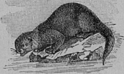
Fig. 53. — La Loutre. Poursuit les poissons. — Long. 0 m , 90.

En revanche, quand on les tue, on utilise leur peau comme fourrures. Mais ces peaux sont beaucoup plus belles dans les pays froids. On vend tous les ans, en Sibérie*, pour des millions de peaux d'hermine, de marte zibeline, etc.