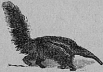
Fig. 54. — Le Grand fourmilier (Amérique du Sud). Se nourrit de fourmis. — Long. 1 m , 50.

16. Édentés. — Les Édentés sont de bizarres mammifères inconnus à l'Europe. Ils ont peu