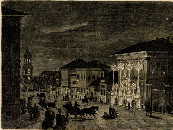
Пшомонна въ Самарѣ.

Министръ внутреннихъ дѣлъ, на основаніи ст. 11 высочайшаго указа 6-го апрѣля 1865 г. и ст. 29-й отдѣла II, высочайше