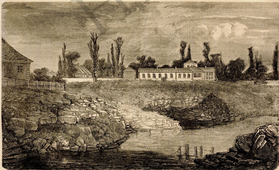
Мѣстечко Горонка съ залезшимъ лаборадора.

Здѣсь провель онъ двадцать лѣтъ уюной жизни. Въ 1596 г., когда на датскій престолъ вступилъ Христианъ IV, судьба его измѣнилась. Дворянство не забыло своихъ обидъ, а врачи того, что онъ лечилъ людей безъ диплома. Король приказалъ составить судѣбную комисію, и она, вовсе не заботясь объ астрономической наукѣ уюнаго, допелса королю, что онъ ничего не сдѣлалъ полезнаго для государства. Презирая всѣкую бесполезную борьбу со своими противниками, Тихо-Браге оставилъ островъ и, продавъ свое