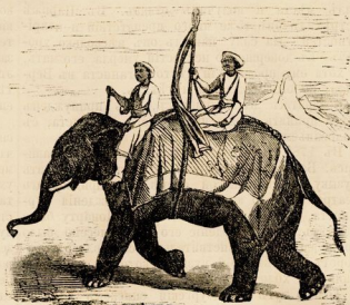
Маратты на слонь.