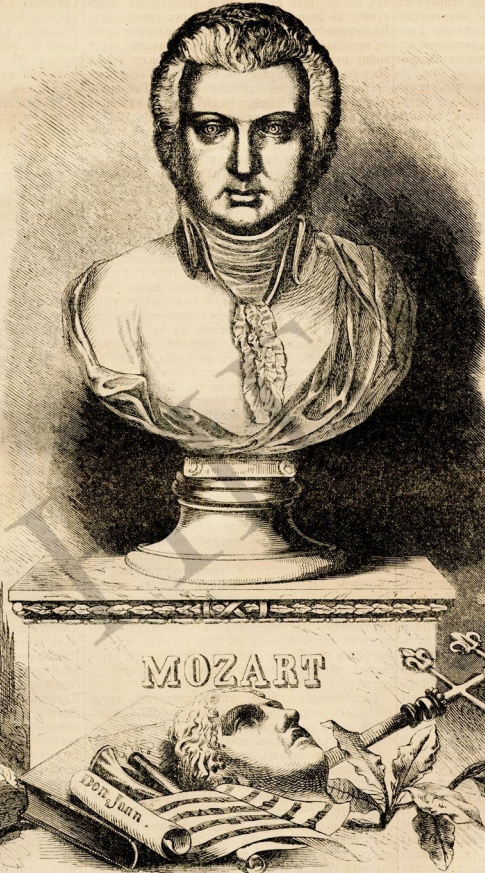
Бюстъ Моцарта, работы Клауера.

Все, что мы сказали вначалѣ о необходимости отдѣлить въ биологическомъ наукѣ задачу естественныхъ наукъ отъ задачи наукъ экспериментальныхъ, относится не только къ чисто-теоретическому различію между физиологіею съ одной стороны и зоологіею и фитологіею, или ботаникою съ другой; дѣло идетъ о практическомъ отдѣленіи этой науки, которая предназначена имѣть наибольшее влияние на всеобщій прогрессъ. Науки, при своемъ развитіи, слѣдуютъ аналитическому системѣ, а потому и прои-