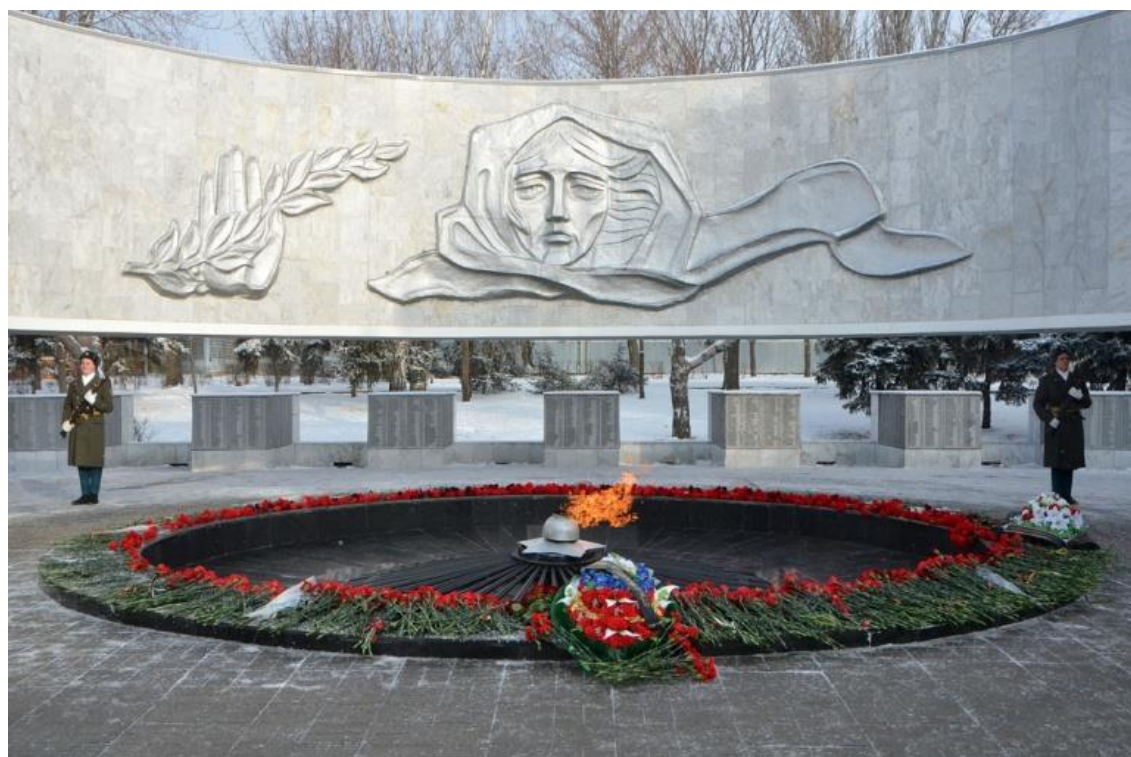
Рис. 1. Мемориальный комплекс «Павшим воинам»

Расправы над советскими гражданами исчислялись сотнями. Информация судебно-медицинских экспертов от 12 июня 1942 года содержит сведения об этой трагической истории города. «Сбор трупов по городу производился с 30 ноября 1941 г. по 06-07 декабря 1941 г. После чего трупы были погребены в братской могиле, в клиническом парке мединститута (между Театральным пр. и Нахимовским пер.), а тела мирных жителей – в парке им. Фрунзе» [2]. Сейчас на этом месте установлен мемориальный комплекс, горит вечный огонь, возле которого учащиеся школ несут вахтупамяти (рис. 1).