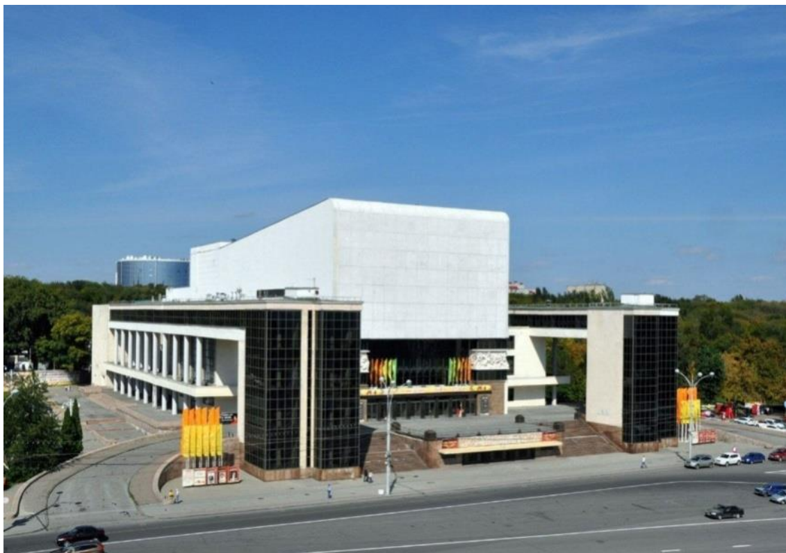
Рис. 2. Ростовский академический театр драмы им. М. Горького после реконструкции

ясли-сад, остался только один сценический круг, исчезла основная часть мраморной облицовки (рис. 2).