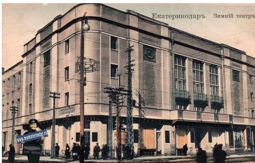
Приложение № 2. Здание Зимнего театра (фото до войны)

Было восстановлено здание Зимнего театра, построенного в 1909 году по проекту «отца русского модерна» Ф. Шехтеля. Строительными работами руководил именитый кубанский архитектор А. Козлов. Фасад, был облицован ровной цементной штукатуркой, придававшей сооружению невесомость, воздушность [8]. Это впечатление еще больше усиливали три вертикальных столбца с перечнем имен великих композиторов и драматургов всех времен и народов, три высоких окна с ажурными балкончиками и венчающий постройку широкий карниз с узорными гирляндами, едва выступающий над фасадом (приложение № 2).