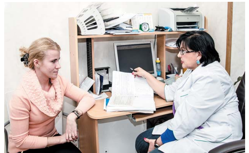
Своевременная врачебная консультация у опытного кардиолога гарантированно снижает риск сердечно-сосудистых заболеваний!

ВНИМАНИЕ! Врачебные кабинеты в «Альтаире» работают ежедневно, включая воскресенье. Подробности, консультации, а также запись на прием - по телефону 3-45-00