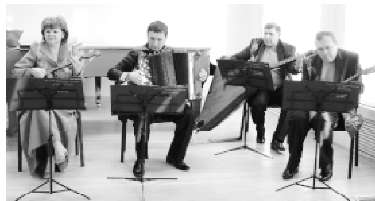
Ярославский ансамбль народных инструментов «Серпантин»...