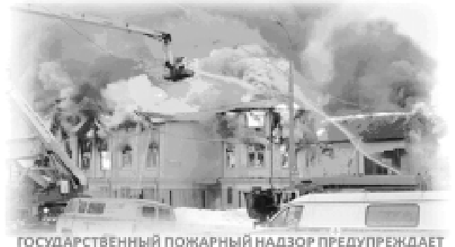
ГОСУДАРСТВЕННЫЙ ПОЖАРНЫЙ НАДЗОР ПРЕДУПРЕЖДАЕТ БЕРЕГИТЕ ЖИЛИЩЕ ОТ ПОЖАРА!

Отдел надзорной деятельности по Переславскому району Главного управления МЧС России по Ярославской области предупреждает: Чтобы избежать пожара, помните и соблюдайте основные правила пожарной безопасности: ПРИ ИСПОЛЬЗОВАНИИ ОТОПИТЕЛЬНЫХ ПРИБОРОВ запрещено пользоваться электропроводкой с поврежденной изоляцией. НЕ УСТАНОВЛИВАЙТЕ электронагревательные приборы вблизи горючих материалов. НЕ ЗАБЫВАЙТЕ , уходя из дома, выключать все электронагревательные приборы. НЕ ПРИМЕНЯЙТЕ для розжига печей бензин, керосин и другие легковоспламеняющиеся жидкости. СЛЕДИТЕ за расстоянием от топочного отверстия печи до мебели и других бытовых предметов. Это расстояние должно быть не менее 125 см. НЕ ЗАБЫВАЙТЕ очищать от сажи дымоходы перед на-