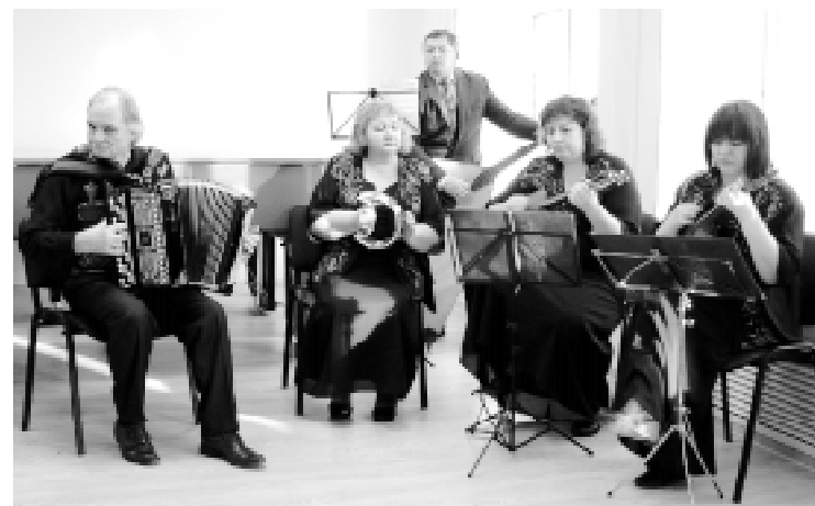
...и переславская «Радея»