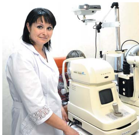
Проверка зрения на новом оборудовании - быстро, качественно и удобно!

В общем, все необходимое для того, чтобы сохранить ваше здоровье на долгие годы!