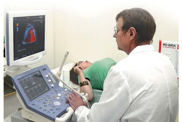
Комплексное обследование организма с помощью аппарата ультразвуковой диагностики