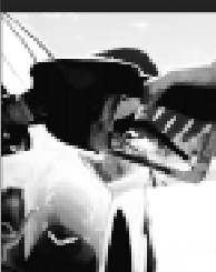
ГРАФИК СУТОЧНЫЙ 1/2