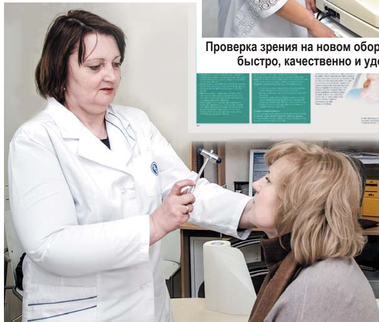
Проверка здоровья у невропатолога служит профилактике целого ряда опасных заболеваний, в том числе инсульта