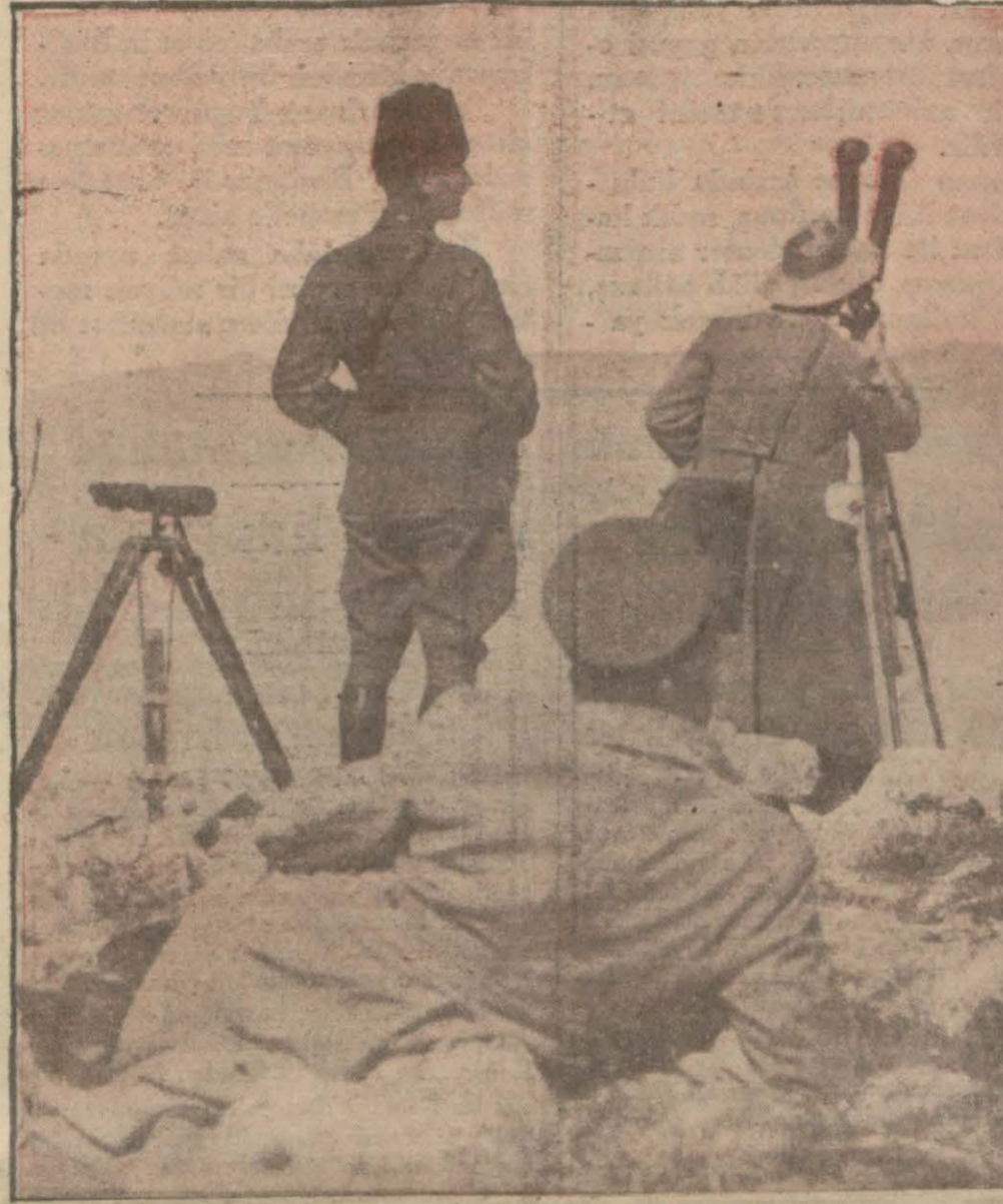
Büyük reisimiz büyük zafer günü Fevzi ve İsmet Paşalarla birlikte Dumlupınarın hâkim bir sırtından düşman ordularının imha ve inhişamını temasa buyuruyorlar..

Türk, her zaman olduğu gibi gene kendi topraklarında kendi kendisini en efendisi olarak yaşayacaktır. (Devamı 5 inci sahifede)