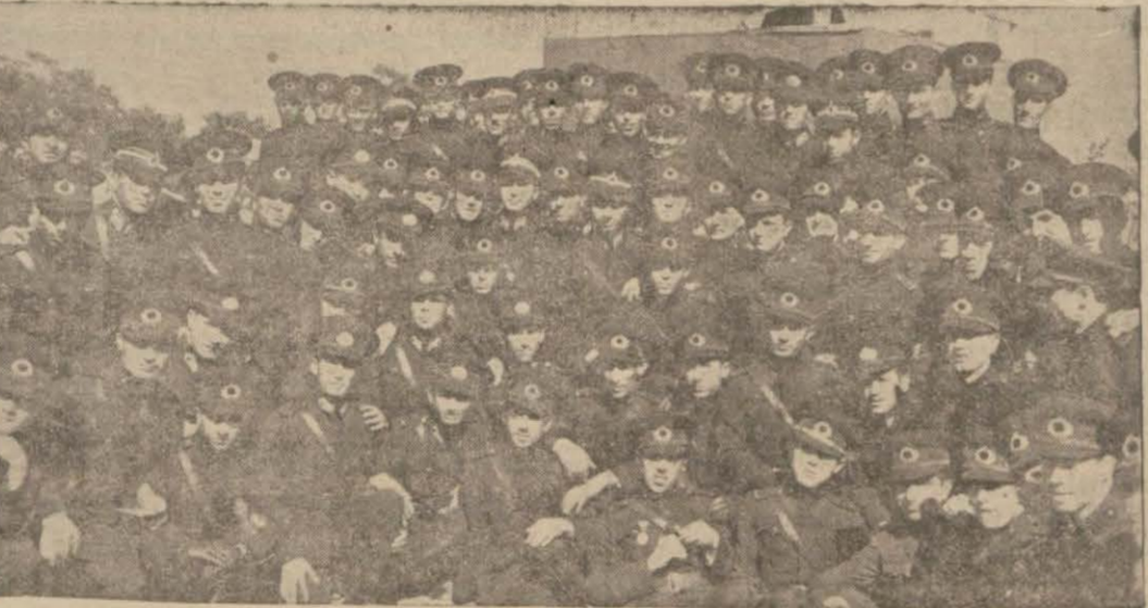
Bu sene cumhuriyet ordularına ilti hak eden genç mülâzımlarımızdan bir grup

Türk, her zaman olduğu gibi gene kendi topraklarında kendi kendisini en efendisi olarak yaşayacaktır. (Devamı 5 inci sahifede)