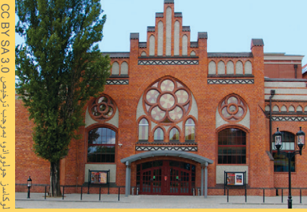
تركيبات جازوار راني، بموجب ترخيص CC BY SA 3.0

وعلى رداء "التي شيرت" الخاص بالمؤتمر العام، كتب الشعار "حرية المعلومات في مدينة الحرية"، محققًا الترابط بين قيم ويكيميديا وتاريخ مدينة غدانسك حيث تحددت حركة التضامن الحكام الشيوعيين في الثمانينيات بقيادة ليتش واليسا، الذي أرسل تحياته لحضور ويكيميديا مع ملاحظة أنه كان مستخدمًا معتادًا لويكيبيديا.