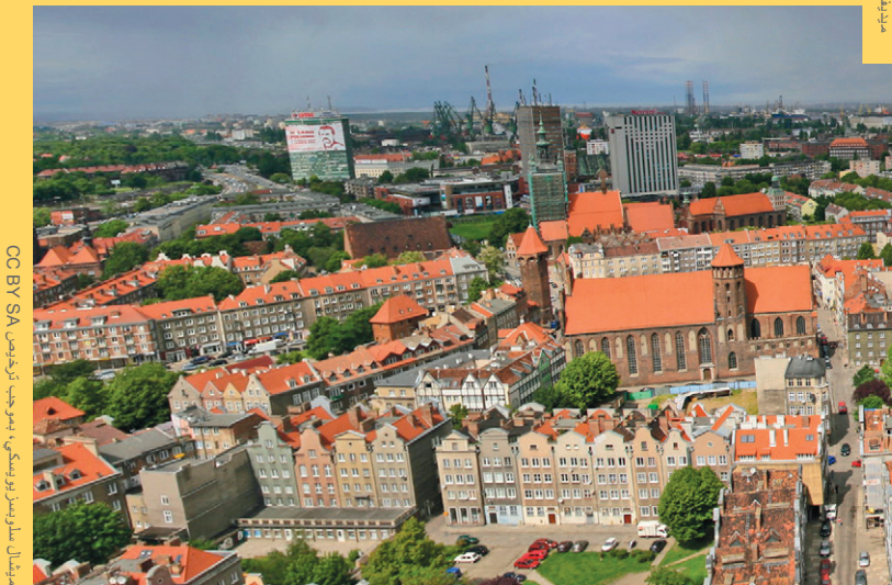
مدينتك، بموجب ترخيص CC BY SA