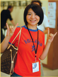
راكف روليشتشيفيك، بموجب ترخيص CC BY SA 3.0