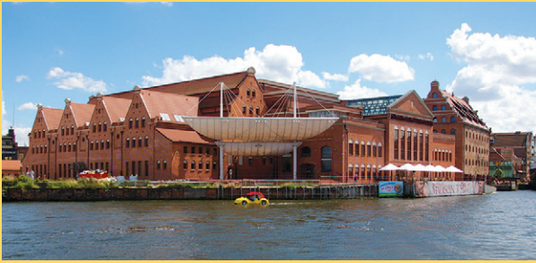
تركيبات جازوار راني، بموجب ترخيص CC BY SA 3.0