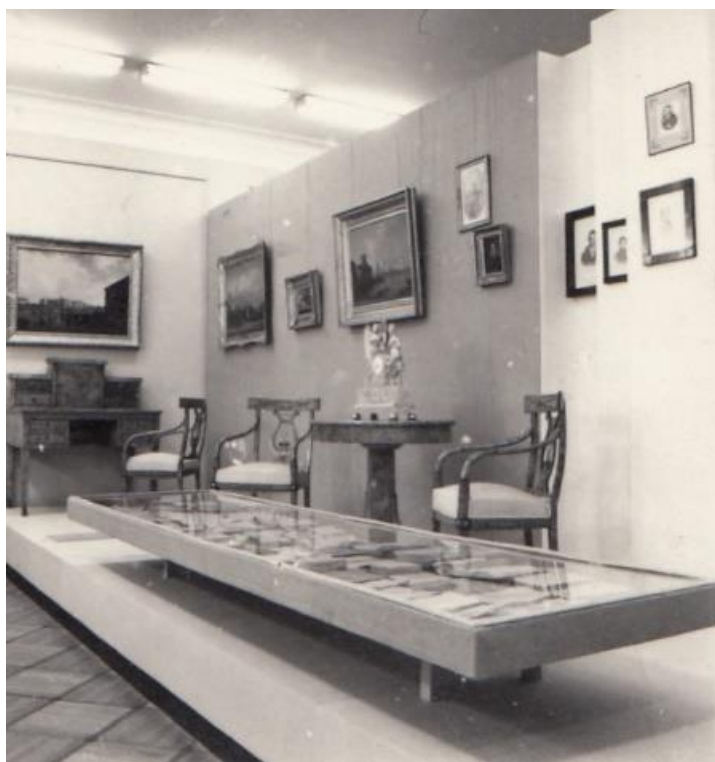
Выставка «Первенцы свободы». Зал 7. Бюро И.И. Пущина. 1975 г.