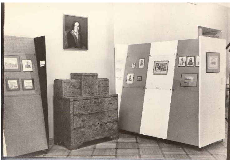
Выставка «Первенцы свободы», 1975 г. Мемориальный Музей-Лицей, г. Пушкин.