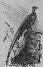
Fig. 114. — Faisan. Long. 0 m ,88.

29. Gallinacés. — Le nom de Gallinacés (du latin gallina , poule), a été donné aux oiseaux de ce groupe à cause de leur ressem-