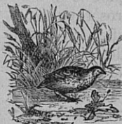
Fig. 118. — Caille. Long. 0 m ,21.