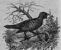
Fig. 119. — Coq de bruyère. Long. 0 m ,80.

blance plus ou moins grande avec la Poule , qui en est le type. Ce sont des oiseaux mangeurs de graines. Nos poules