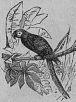
Fig. 112. — Perroquet. (Ara). — L. 0 m ,68.

térise leur gros bec, leur langue charnue*, capable d'articuler des mots, leurs doigts dirigés, deux en avant, deux en arrière, leur remarquable intelligence, ont été nommés avec assez de justesse les singes des oiseaux. Comme les singes, ils n'habitent que les pays chauds, et remplissent de leurs bandes criardes les forêts intertropicales* des deux mondes.