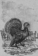
Fig. 117. — Dindon. Long. 1 m .