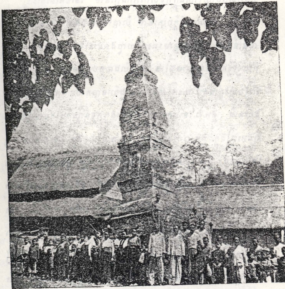
ស្រាវី វើបឺង សាមឡើ (ប្រទេសលាវ) - ភាគចេតិយលាវនៅឡើង ៗ ប្រើប្រាស់ បង្កើតសម្រាប់សេវាព្រះពុទ្ធសាសនា និងប្រើប្រាស់សម្រាប់សេវាព្រះពុទ្ធសាសនា ។ ភាគចេតិយលាវនៅឡើង ៗ ប្រើប្រាស់សម្រាប់សេវាព្រះពុទ្ធសាសនា និងប្រើប្រាស់សម្រាប់សេវាព្រះពុទ្ធសាសនា ។ ១៩៧៧ ព្រះពុទ្ធសាសនា នៅប្រទេសលាវ និងប្រើប្រាស់សម្រាប់សេវាព្រះពុទ្ធសាសនា ។