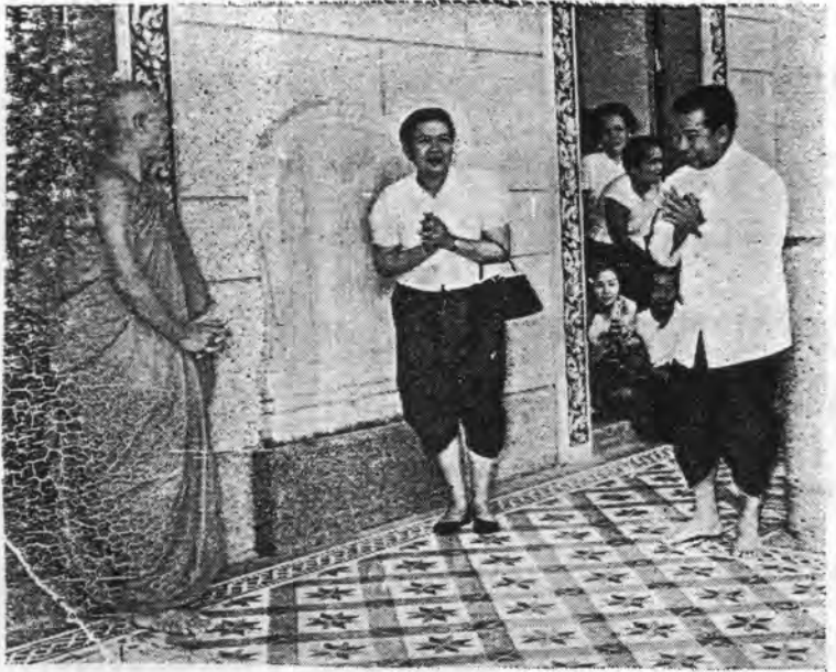
សម្តេចព្រះមហាក្សត្រិយានីព្រះមាតាជាតិ សម្តេចព្រះឧបាយុវិរាជ និងព្រះតេជព្រះ គុណព្រះពោធិវង្ស ហួត - ភាគ អគ្គាធិការពុទ្ធិកសិក្សា ទ្រង់កំពុងសន្ទនានៅយំព្រះ វិហារ ក្នុងឱកាសពិធីសម្តោចឆ្លងព្រះវិហារវត្តប្រាង្គ (ឧត្តុង្គ) នៅថ្ងៃទី ២២-២-៦៤