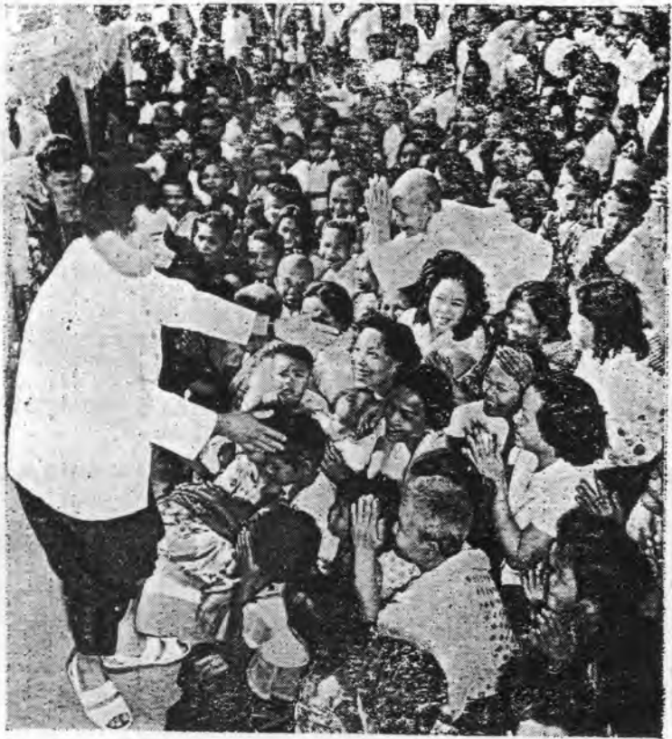
សម្តេចសហជីវិនព្រះប្រមុខរដ្ឋ កំពុងទ្រង់ទទួលអបអរសាទរនឹងកូនចៅប្រុសស្រី ក្មេងចាស់ ដែលបោមរោមថ្វាយបង្គំព្រះអង្គ ក្នុងពិធីសម្ពោធទ្វងព្រះវិហារវត្តប្រាង្គ (ឧត្តុង្គ) នៅថ្ងៃទី ២២-២-៦៤