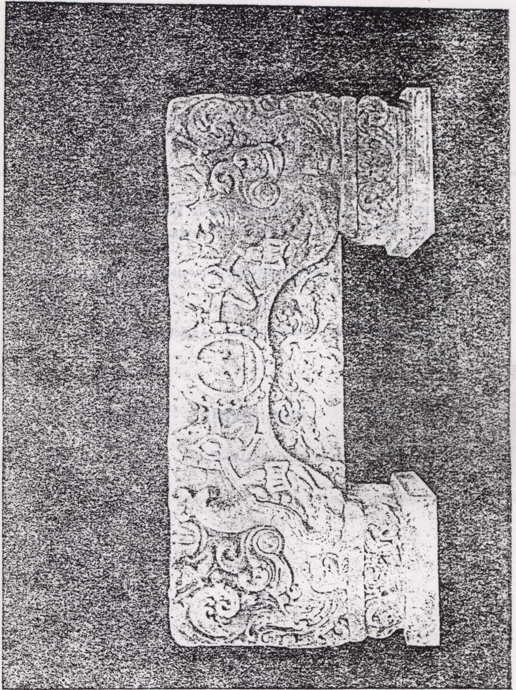
រូបក្បាប់សិលាសៅក្រាមហោរាគារាងខាងលើអាត់ទ្វារប្រាសាទសម្បូរ ( គ. ស. ១១៤៣ )