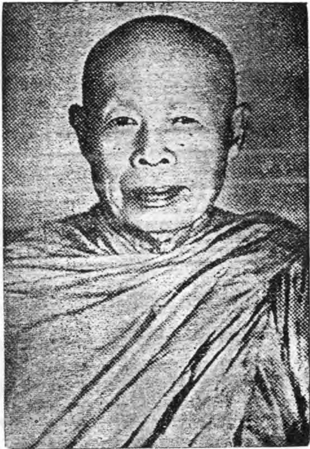
សម្តេចព្រះរោងធីវង្ស ហួត-តាត