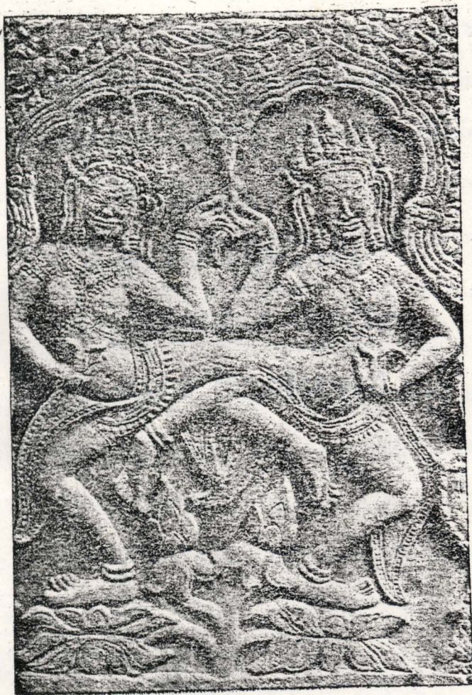
ប្រាសាទបាយ័ន - ទ្វារចូលខាងកើត - រូបនាងអប្សរនៅខឹងសសរមួយ ។