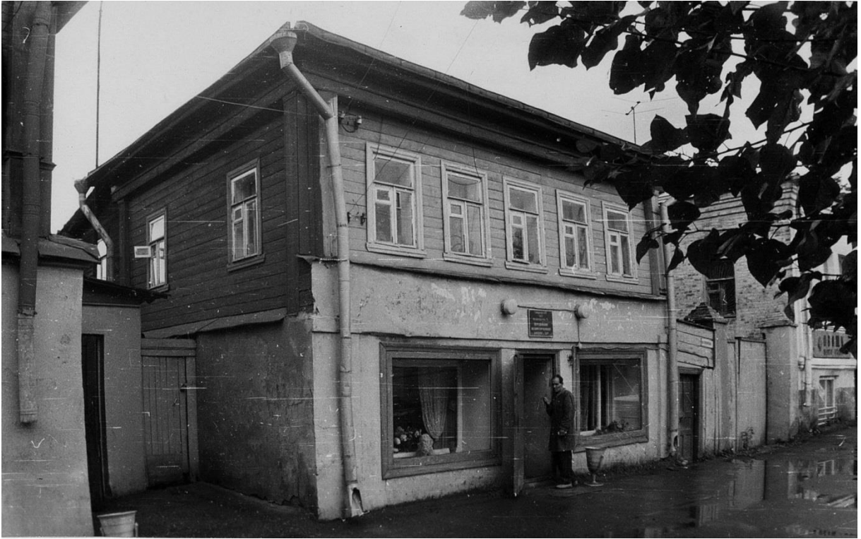
Жилой дом. Украинская ул. 4.

Московская область, г. Звенигород Комплекс застройки Торговой площади, XIX – нач. XX вв. 1988 г.