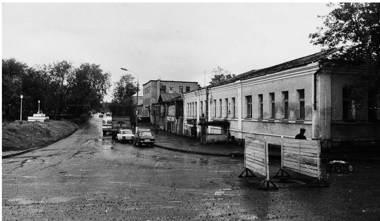
Застройка ул. Украинской. Вид с запада.