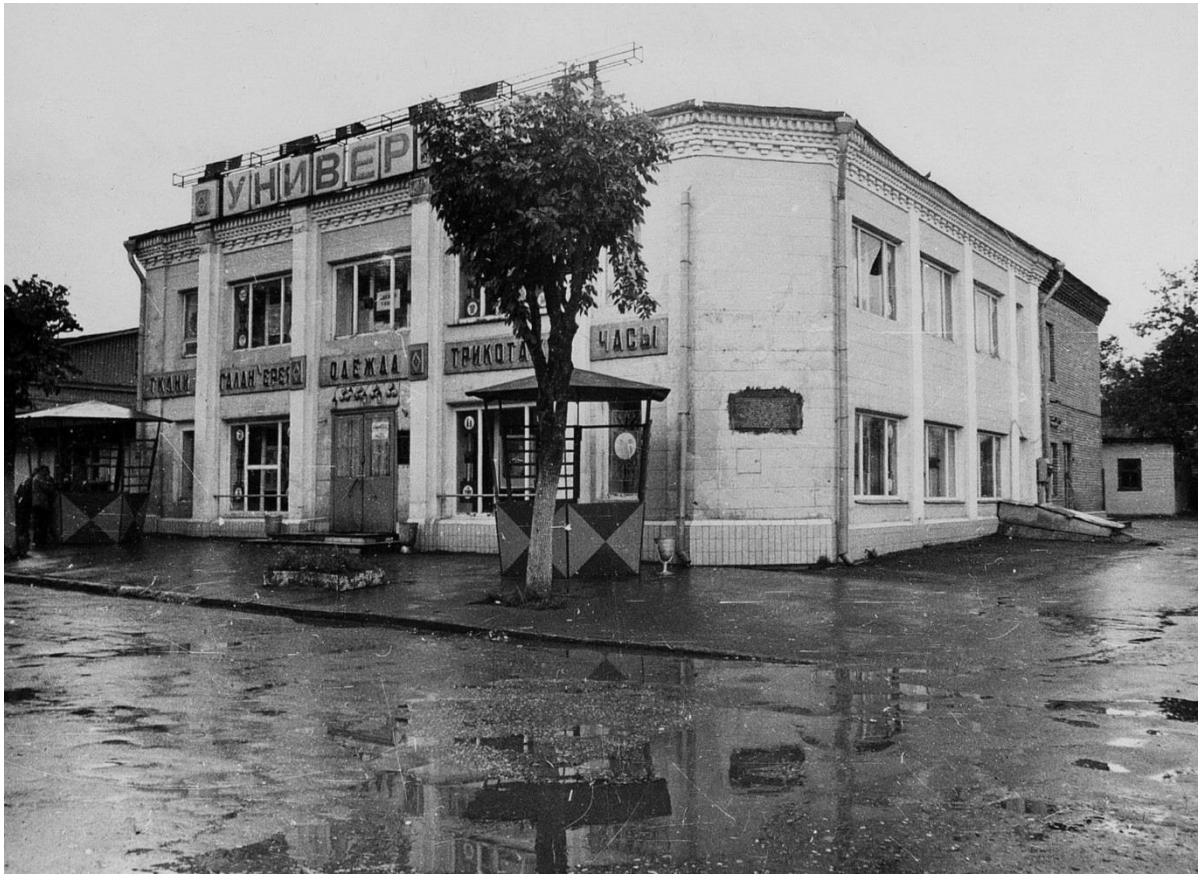
Магазин. Ленина ул. 18/1.