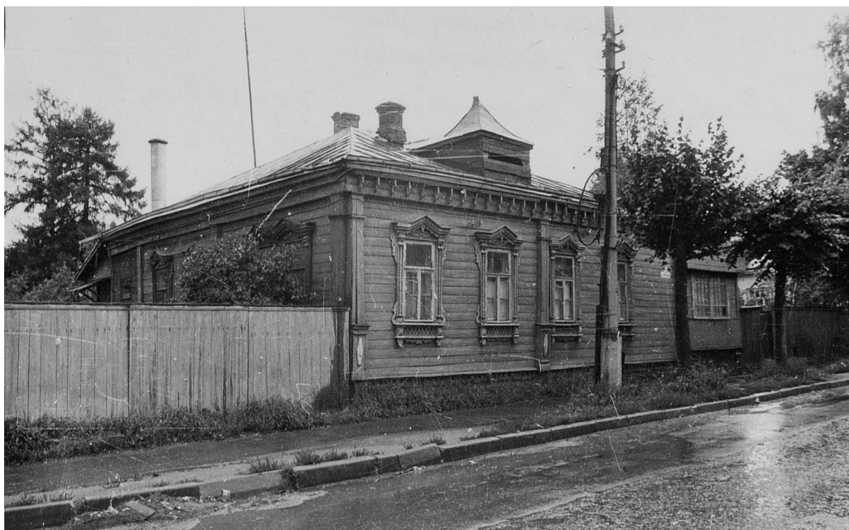
Жилой дом. Пролетарская ул. 13.