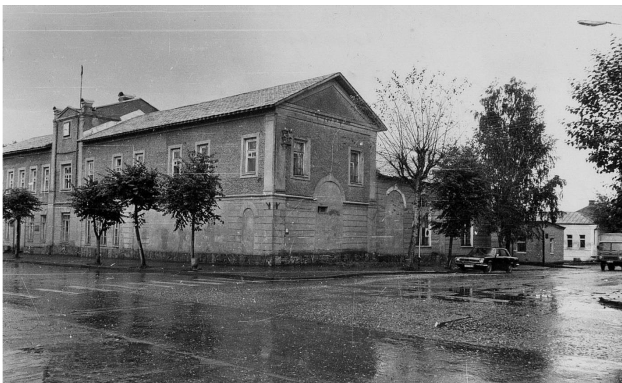
Торговые ряды. Вид с юго-запада (ул. Московская 12/8).