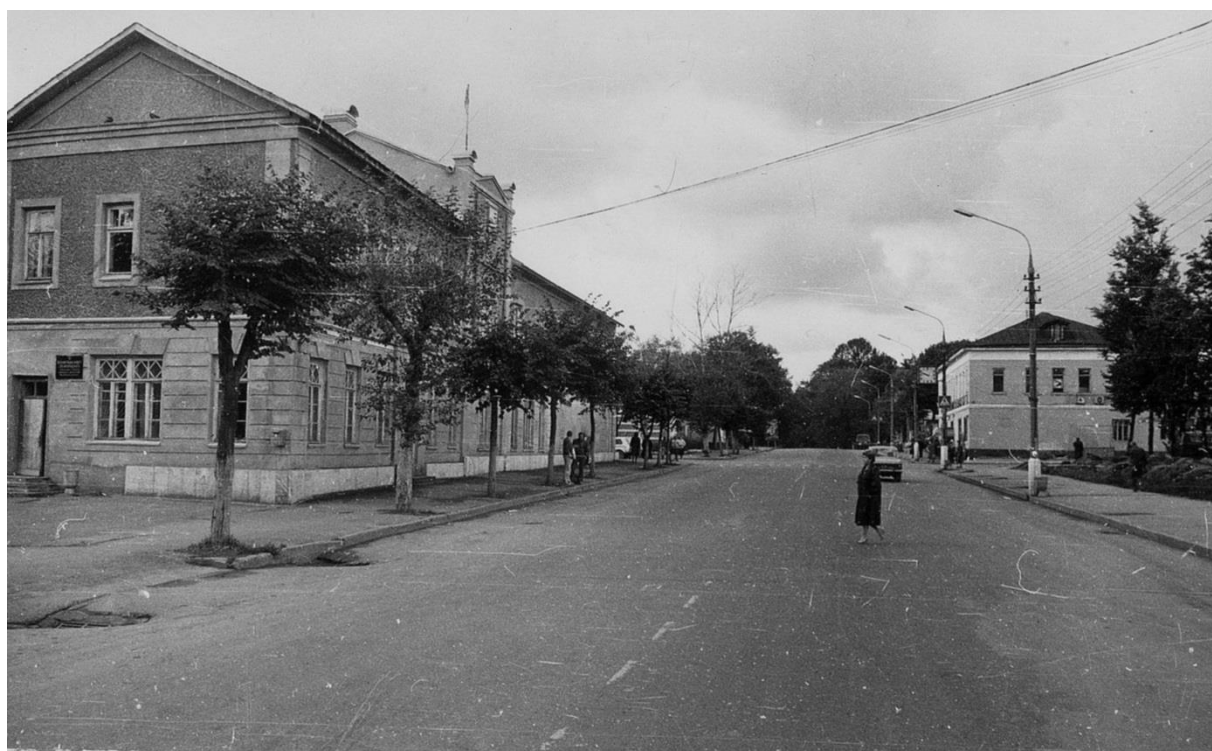
Застройка ул. Московской. Вид с востока.