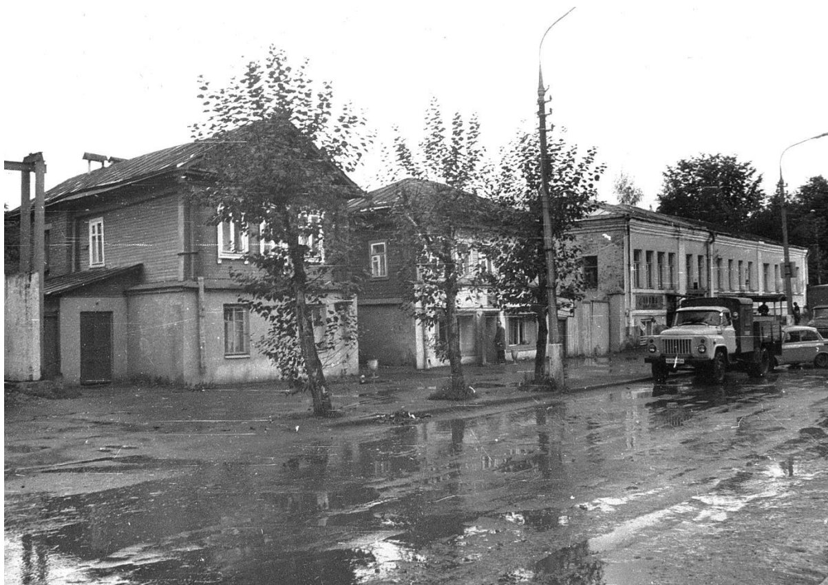
Застройка ул. Украинской (дома 2, 4, 6)