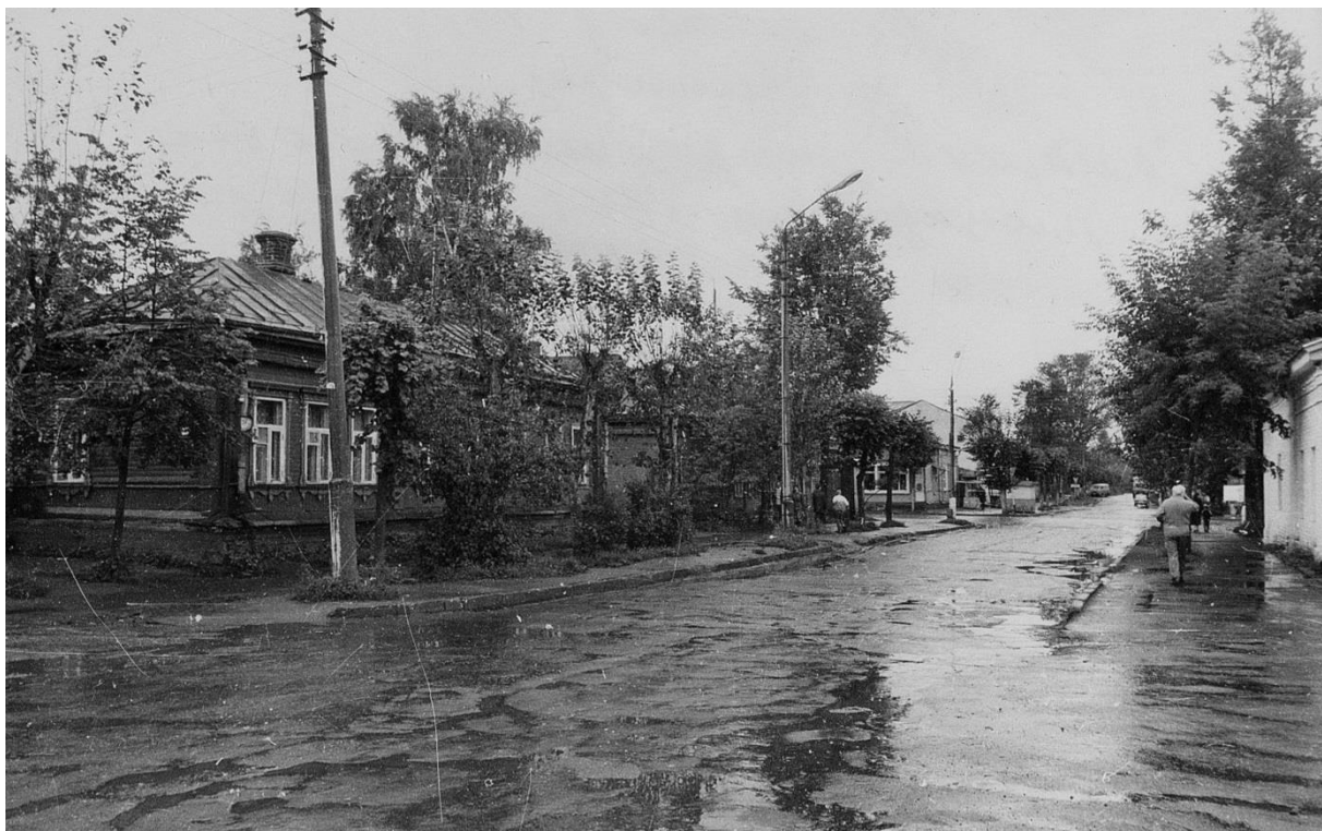
Застройка ул. Московской. Вид с запада.