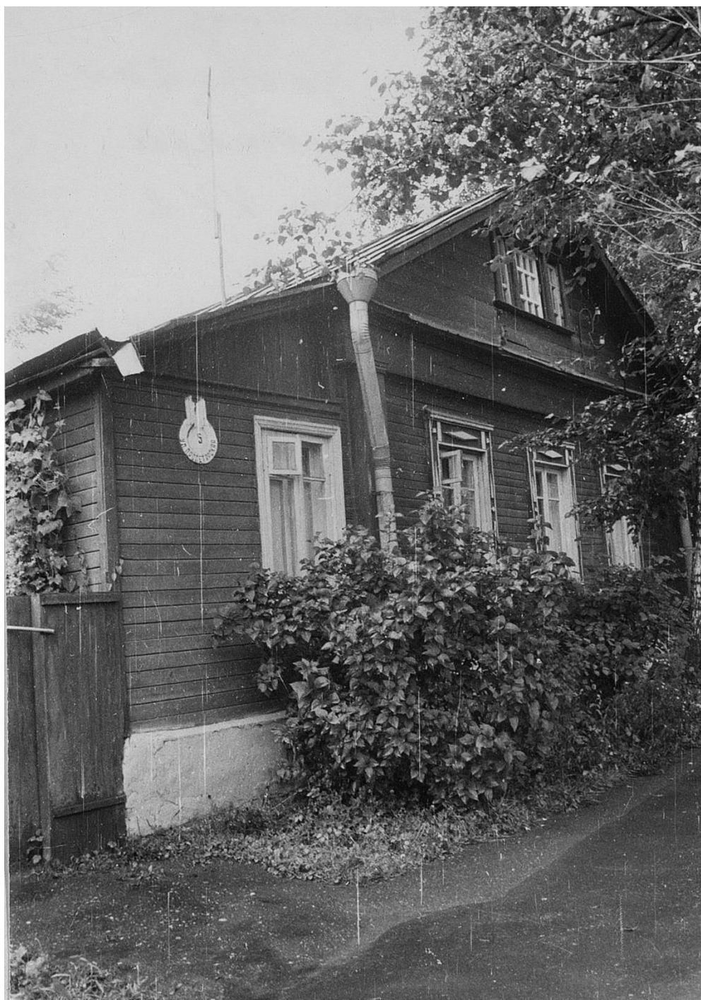
Жилой дом. Пролетарская ул. 5.

Московская область, г. Звенигород Комплекс застройки Торговой площади, XIX – нач. XX вв. 1988 г.