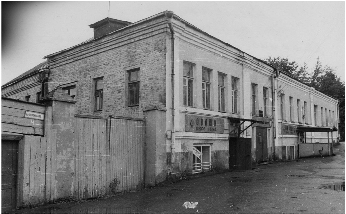
Жилой дом. Украинская ул. 2/6.