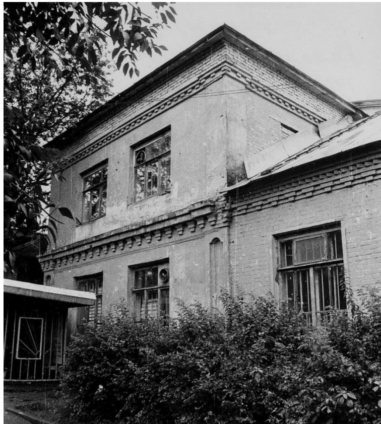
Общественное здание. Украинская ул. 8.