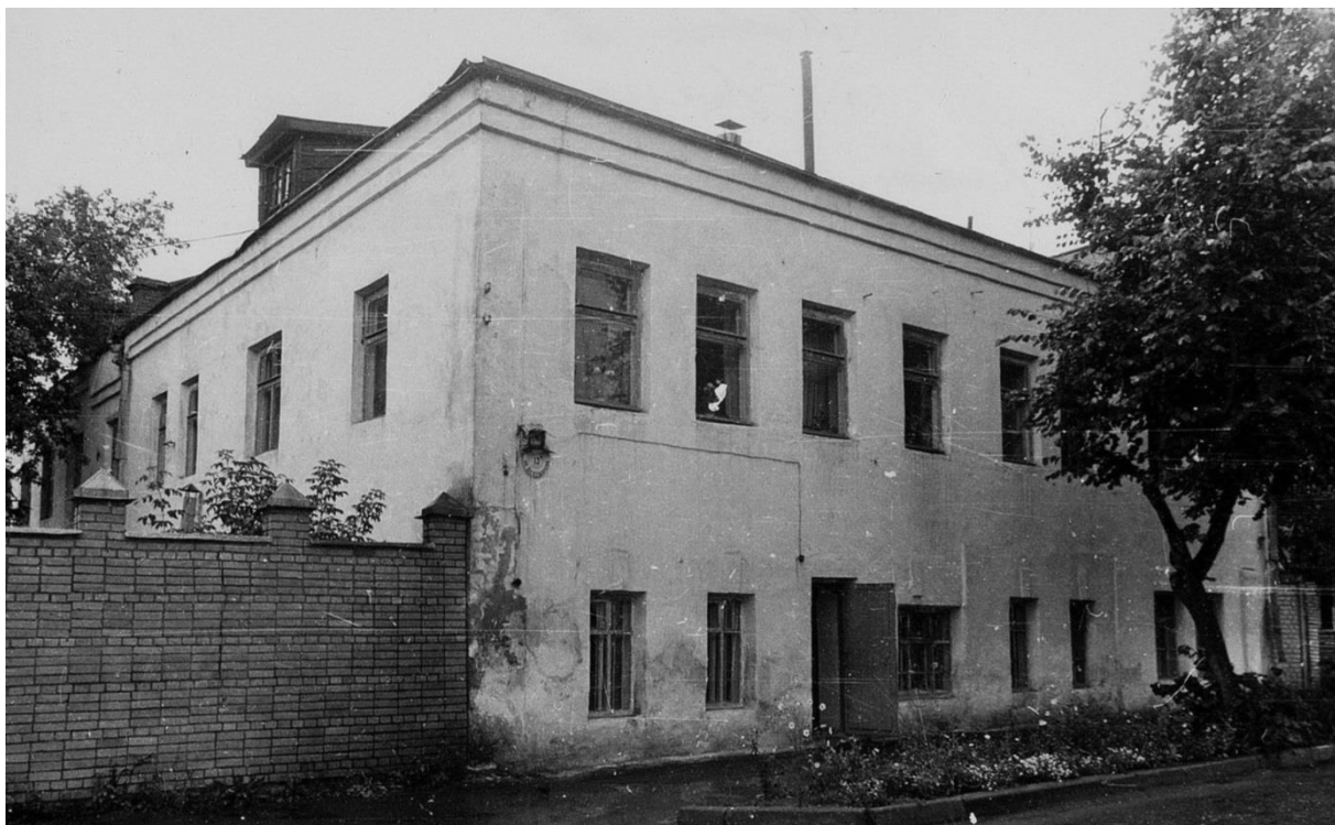
Пожарная часть. Вид с юго-запада. (ул. Ленина, б/н)