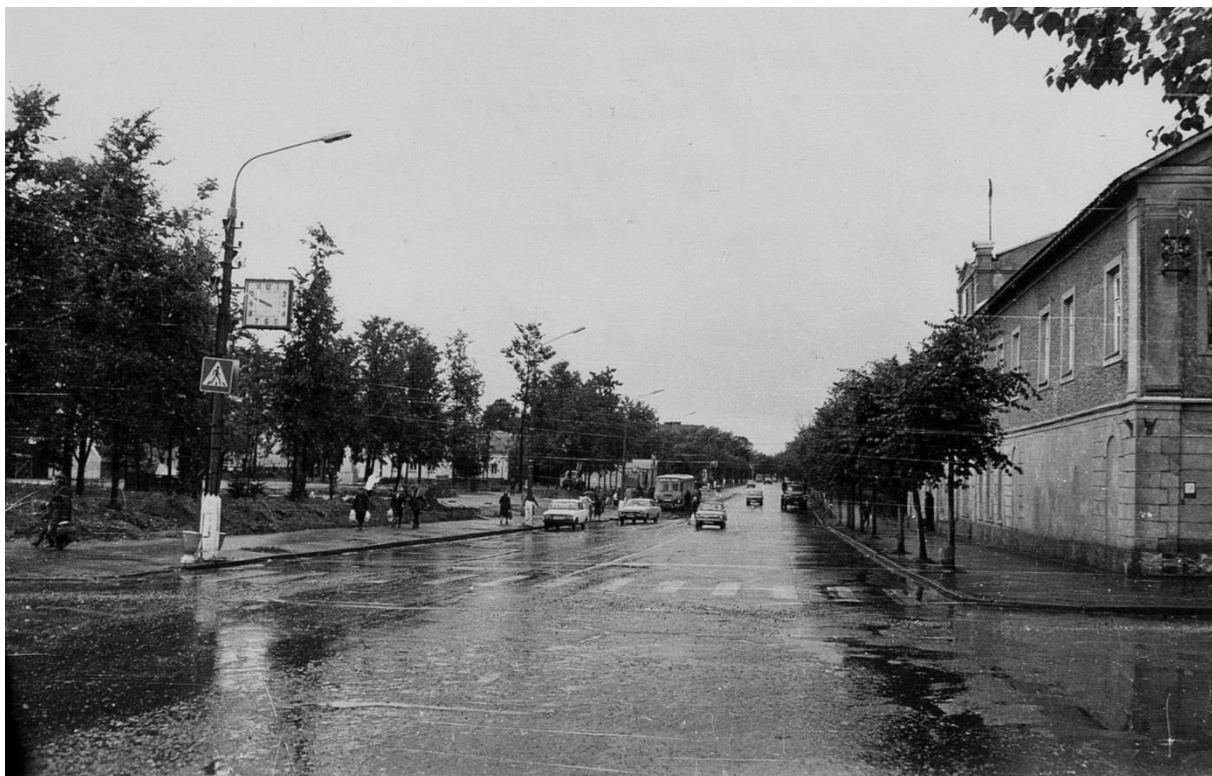
Застройка ул. Московской. Вид с запада.