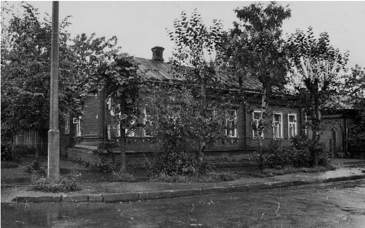
Жилой дом. Ленина ул. 22/13.