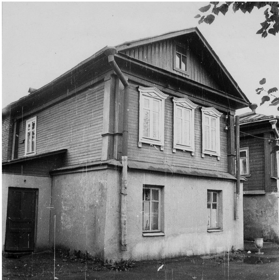
Жилой дом. Украинская ул. 6.