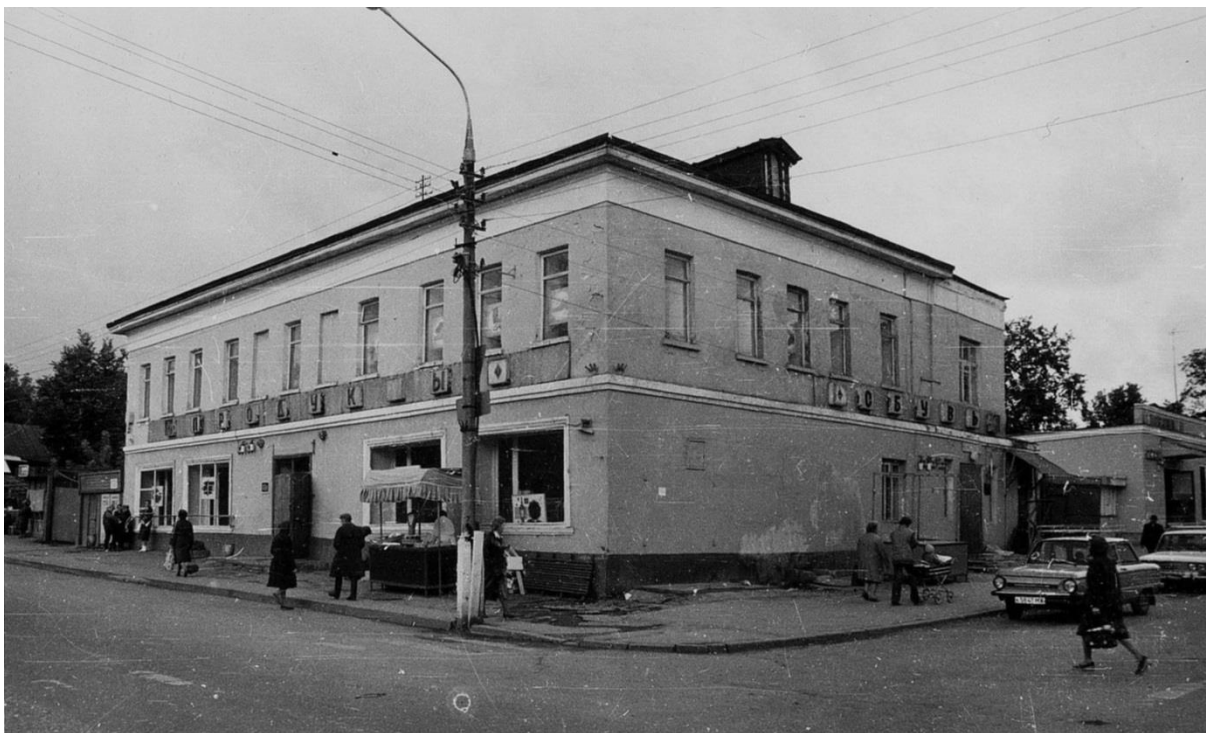
Жилой дом. Московская ул. 7/9.