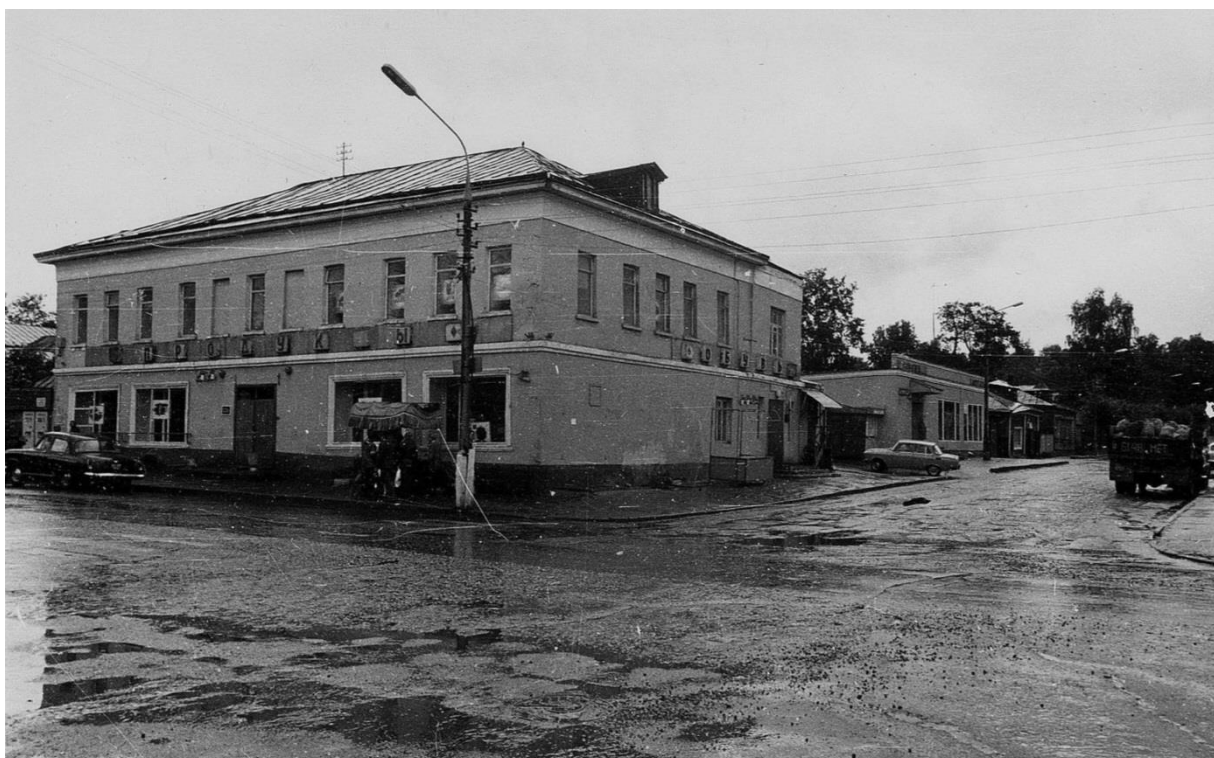
Застройка ул. Пролетарской. Вид с юга.