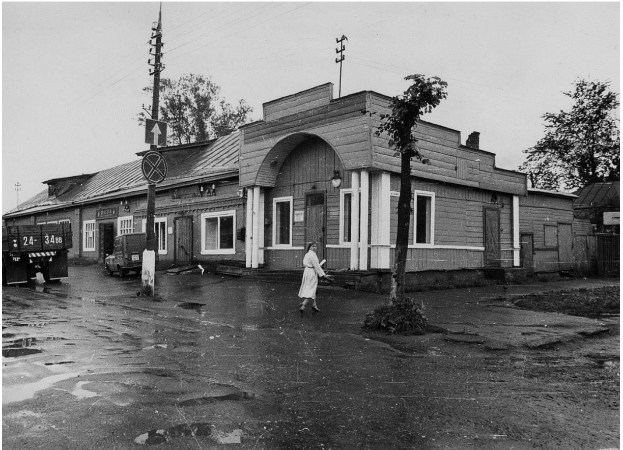
Торговые лавки. Вид с северо-запада. (ул. Ленина 16/2).