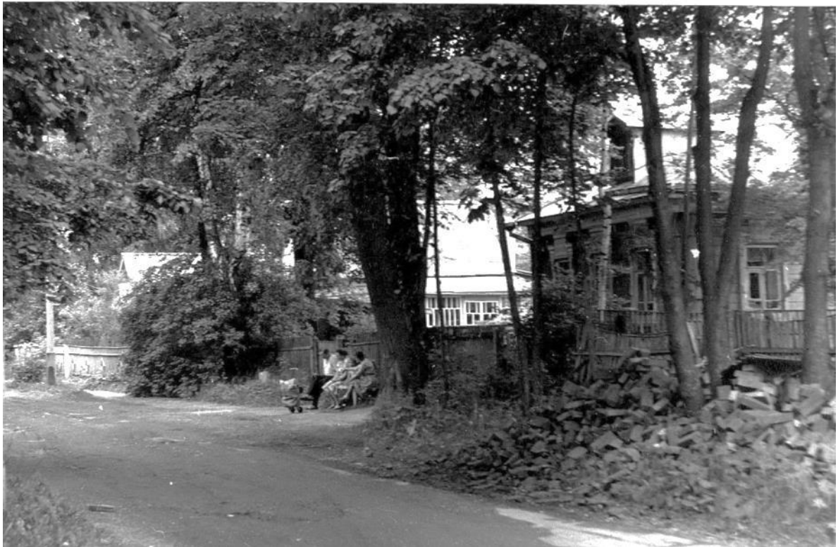
Общий вид с улицы.

Московская область, г. Звенигород, ул. Октябрьская, 6 Дом С.В. Барминцева, 1893 г. Фото А.А. Самохина, 1987 г.