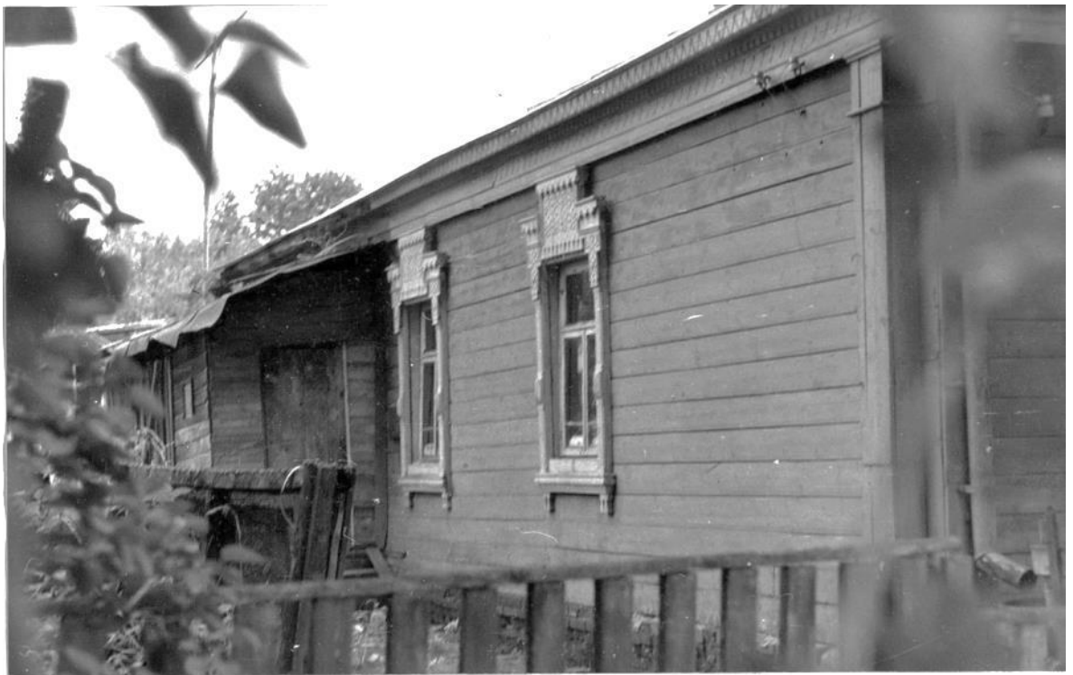
Фрагмент восточного фасада.