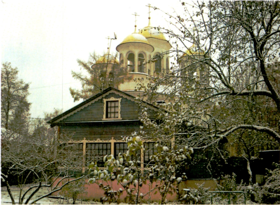
4. Вид с востока.