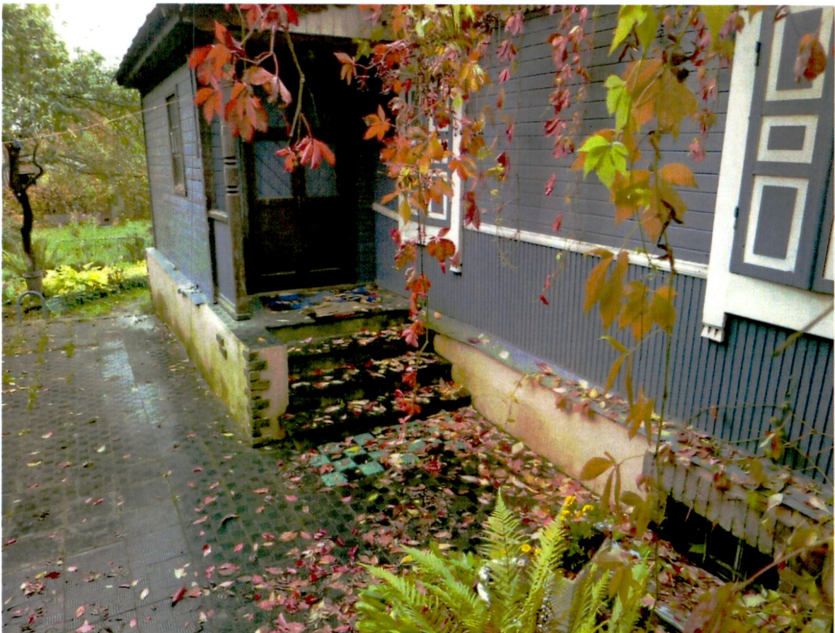
3. Северный фасад.