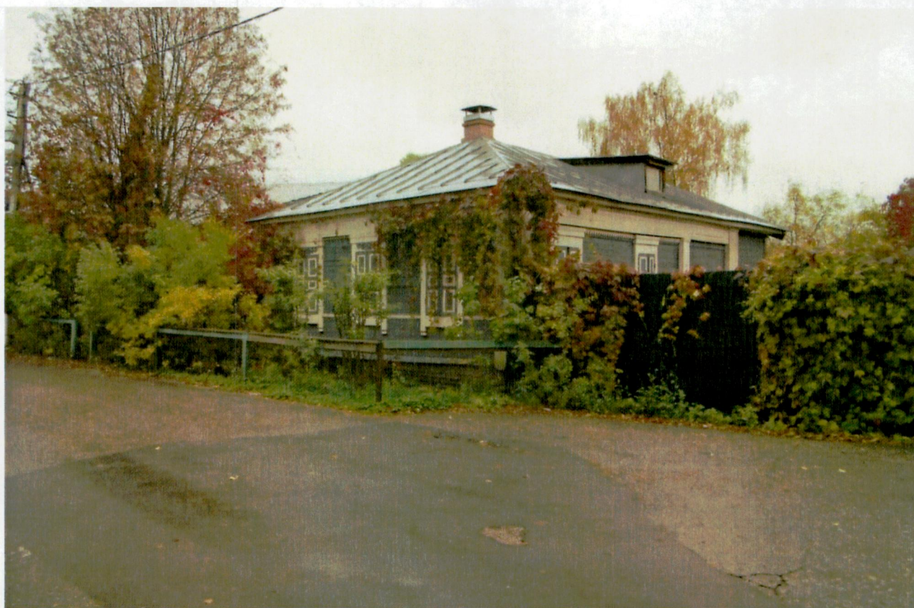
1. Общий вид с юго-запада.

Фотофиксация объекта культурного наследия «Церковно-приходская школа церкви Вознесения Господня, 1913 г.»