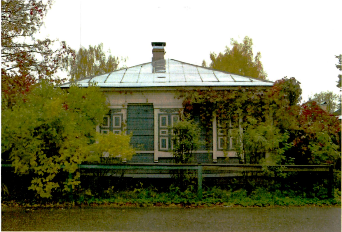
2. Западный фасад.