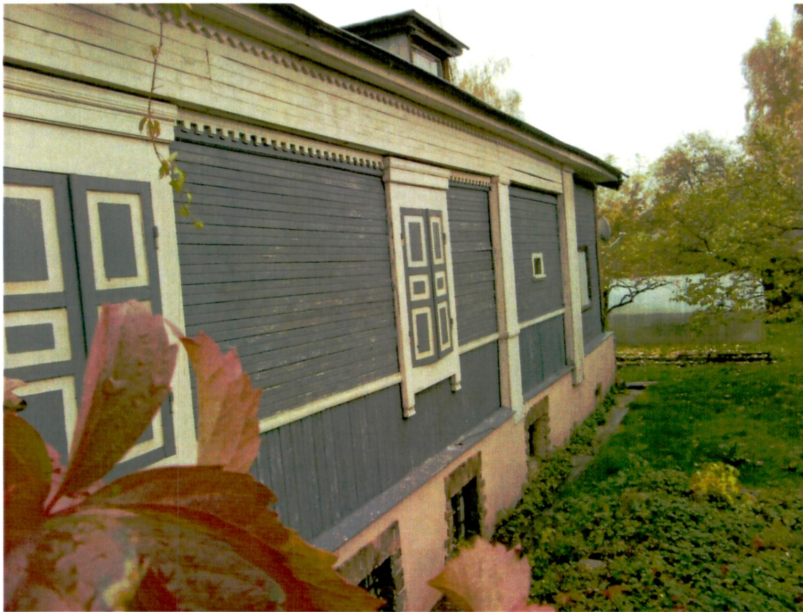
5. Южный фасад