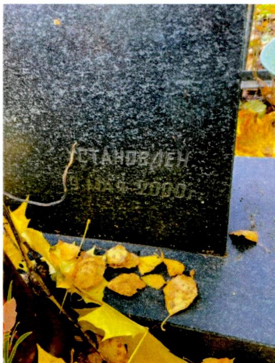
3. Надгробие с текстом «Установлен 9 мая 2000г.».