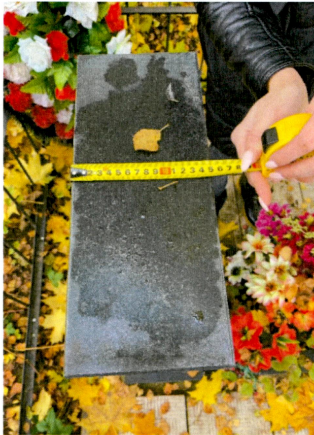
6. Надгробие. Вид сверху.