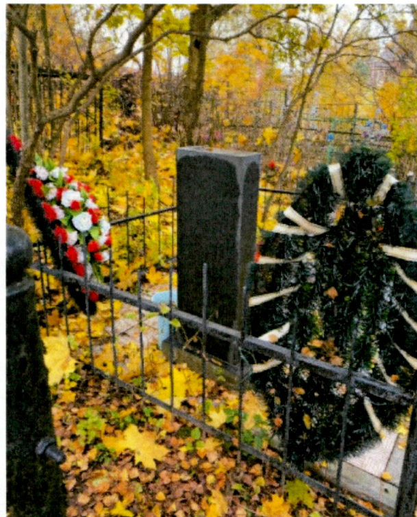
7. Вид на захоронение.