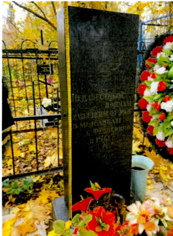
4. Надгробие. Общий вид.