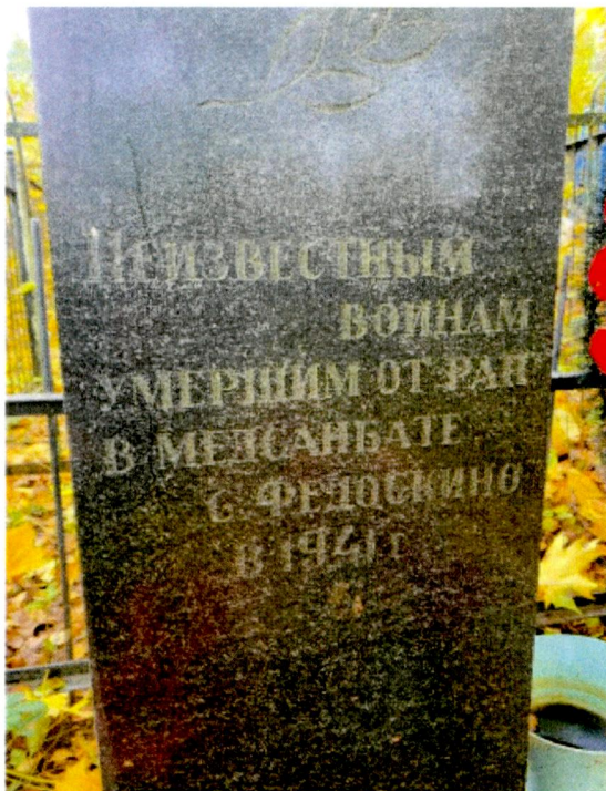
2. Надгробие с текстом «Неизвестным воинам умершим от ран в медсанбате с. Федоскино в 1941».