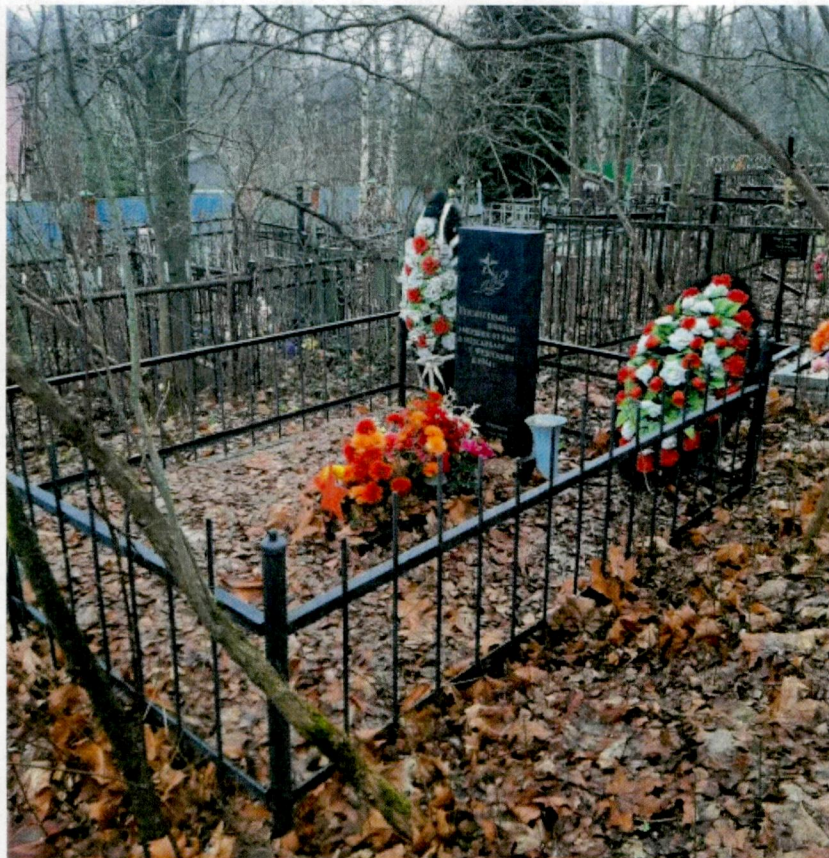
1. Общий вид на захоронение

Фотофиксация объекта культурного наследия регионального значения – «Могила неизвестных воинов Красной Армии, умерших от ран в медсанбате с. Федоскино в 1941 г.»