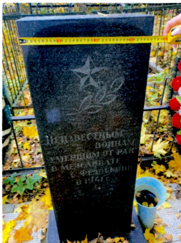
5. Надгробие. Мемориальная надпись.