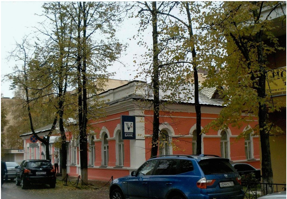
Общий вид с северо-запада.