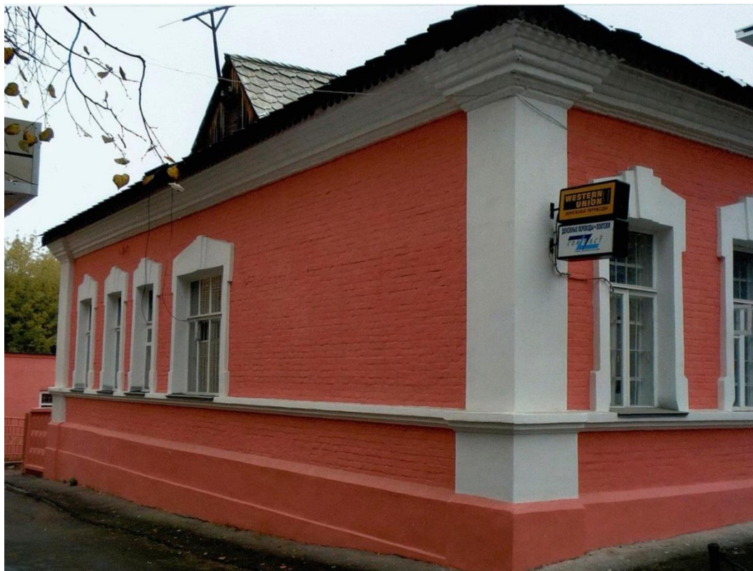
Вид с северо-востока. Фрагмент.