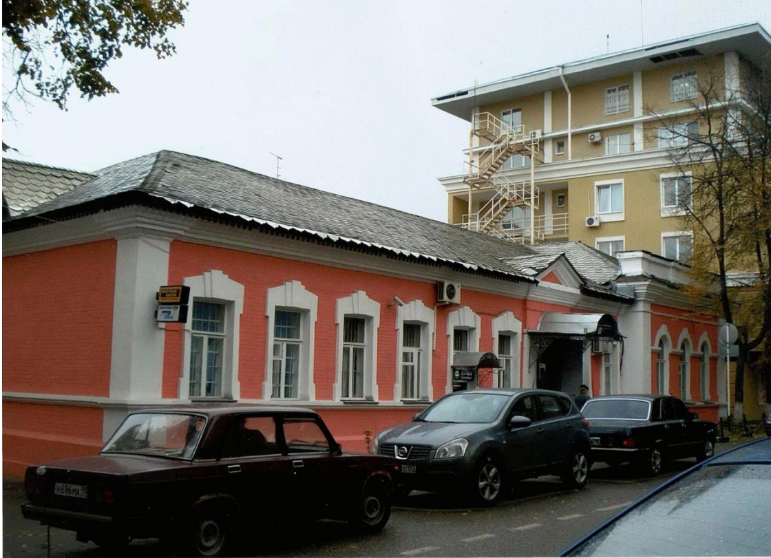
Вид с северо-востока.

Московская область, г. Звенигород, ул. Почтовая, 10. Дом жилой, середина XIX в. Фото А.М. Иванниковой, 2007 г.