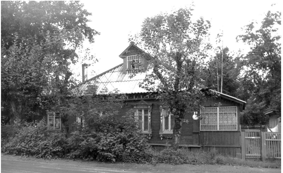
Ул. Фабричнова, 5. Дом жилой, 1920 – 1930-е гг.