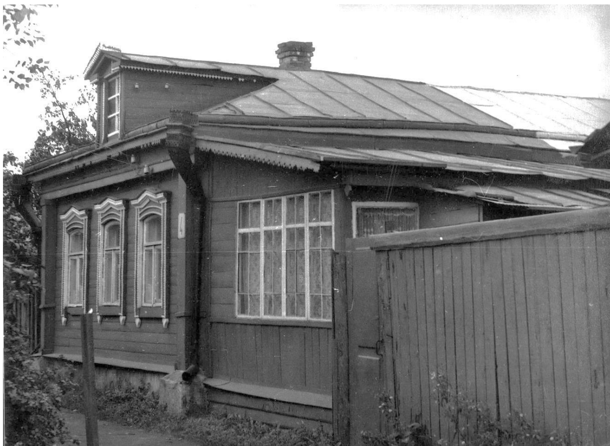
Ул. Фабричнова, 4. Дом жилой, вторая половина XIX в.