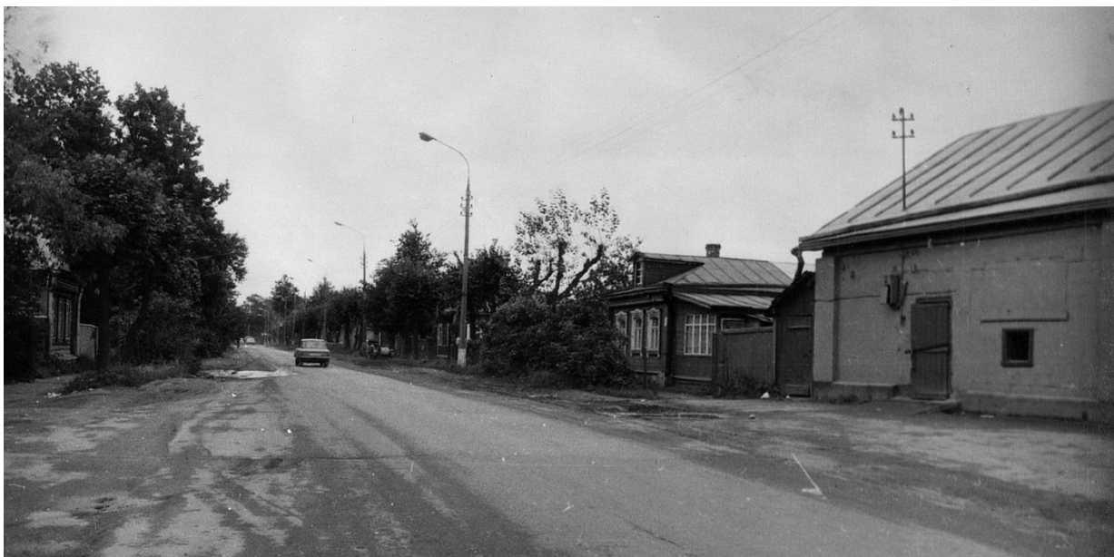
Фрагмент застройки ул. Фабричнова. Вид на восток.

Московская область, г. Звенигород Комплекс застройки ул. Кузнечной, вторая половина XIX в. – 1920-е – 1930-е гг. Фото Г.К. Смирнова, 1987 г.