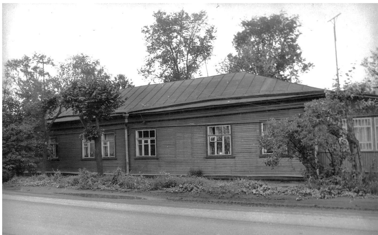
Ул. Фабричнова, 7. Дом жилой, конец XIX в.