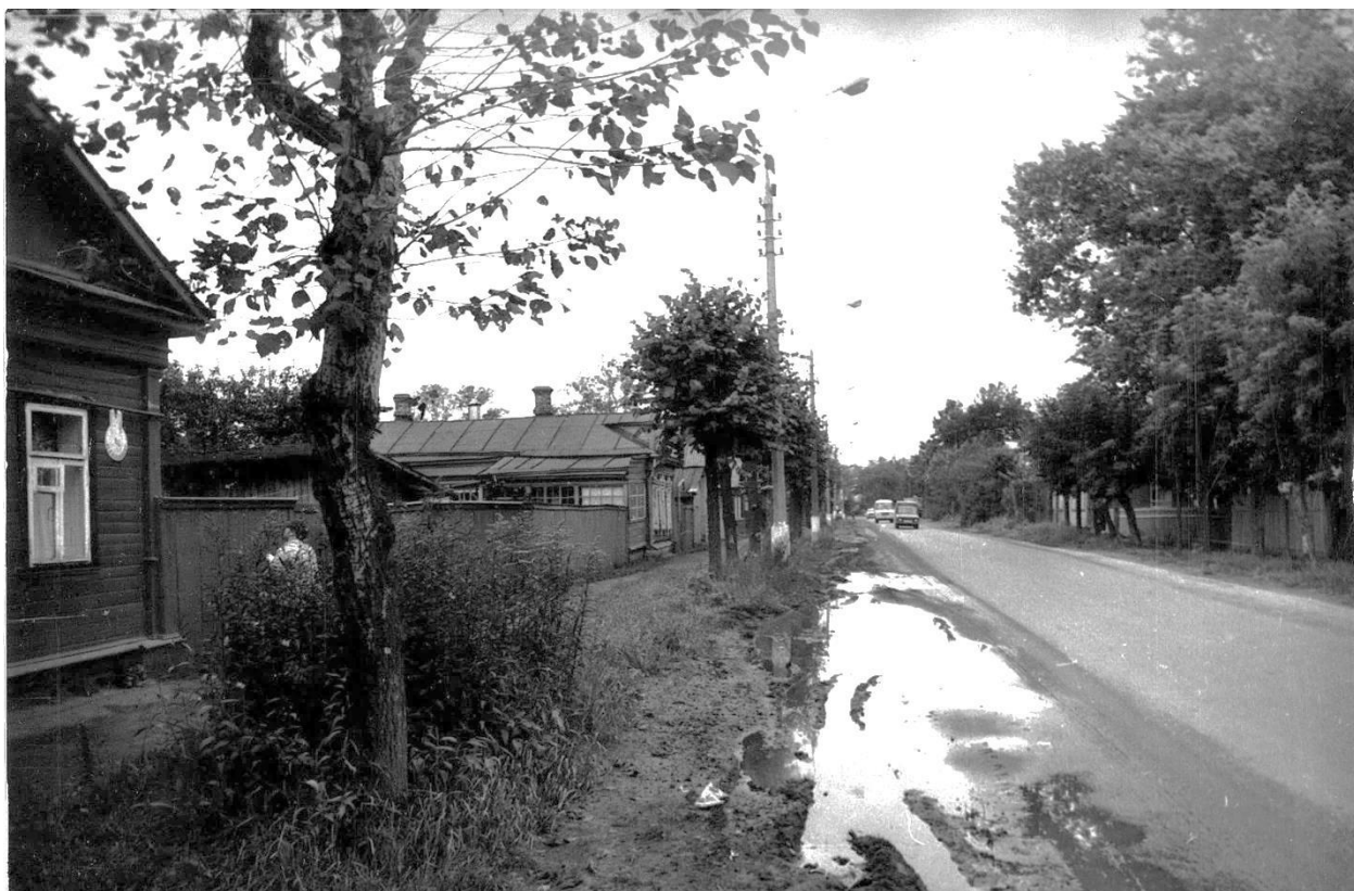
Фрагмент застройки ул. Фабричнова. Вид на запад.