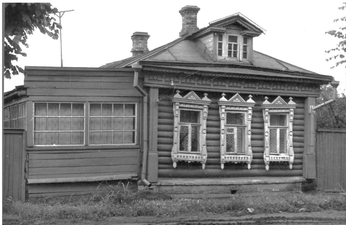
Ул. Фабричнова, 14. Дом жилой, конец XIX – начало XX вв.