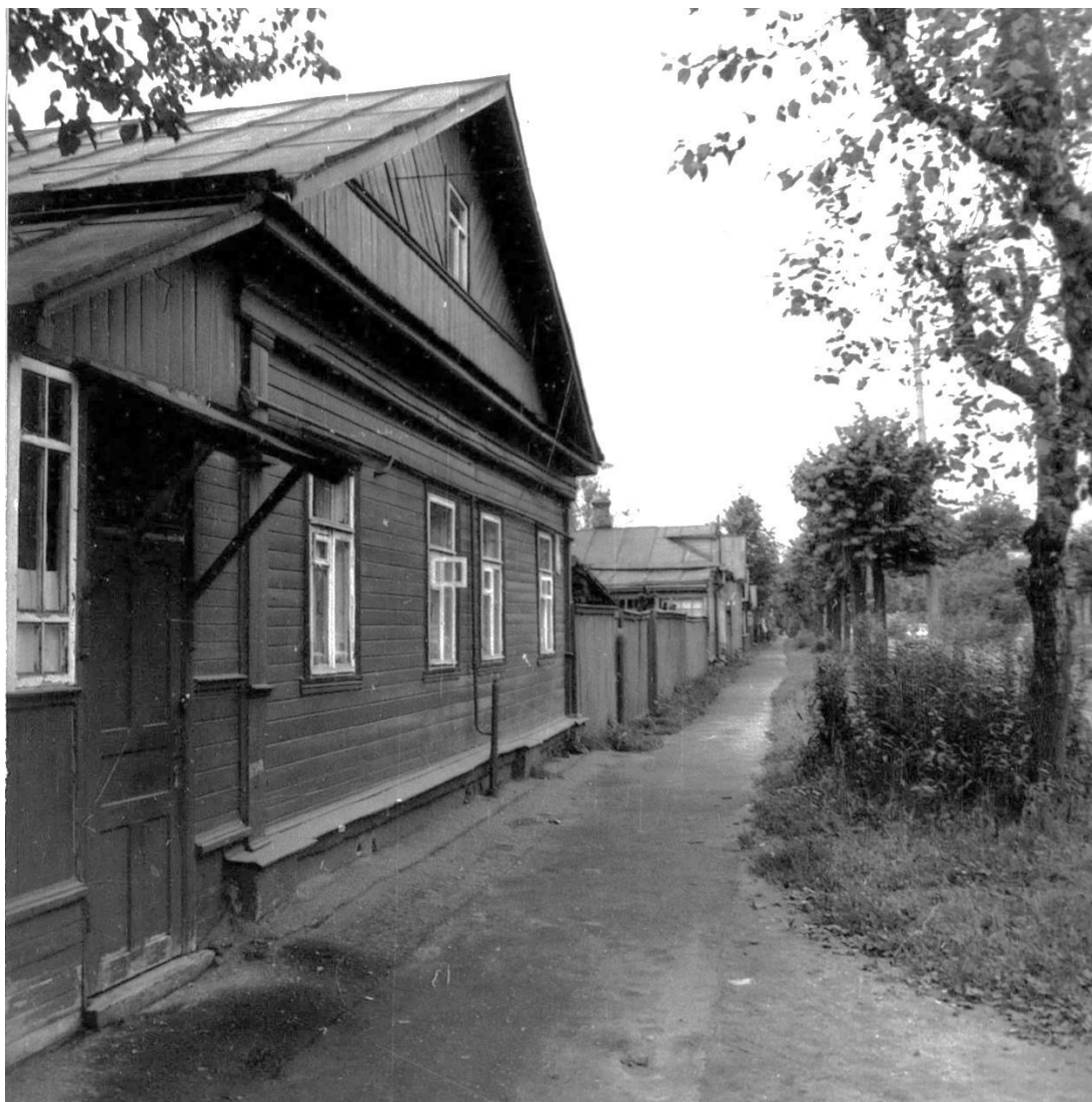
ул. Фабричнова 16/13. Дом жилой, конец XIX в.

Московская область, г. Звенигород Комплекс застройки ул. Кузнечной, вторая половина XIX в. – 1920-е – 1930-е гг. Фото Г.К. Смирнова, 1987 г.