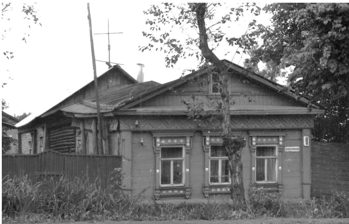
Ул. Фабричнова, 8. Дом жилой, конец XIX – начало XX вв.

Московская область, г. Звенигород Комплекс застройки ул. Кузнечной, вторая половина XIX в. – 1920-е – 1930-е гг. Фото Г.К. Смирнова, 1987 г.