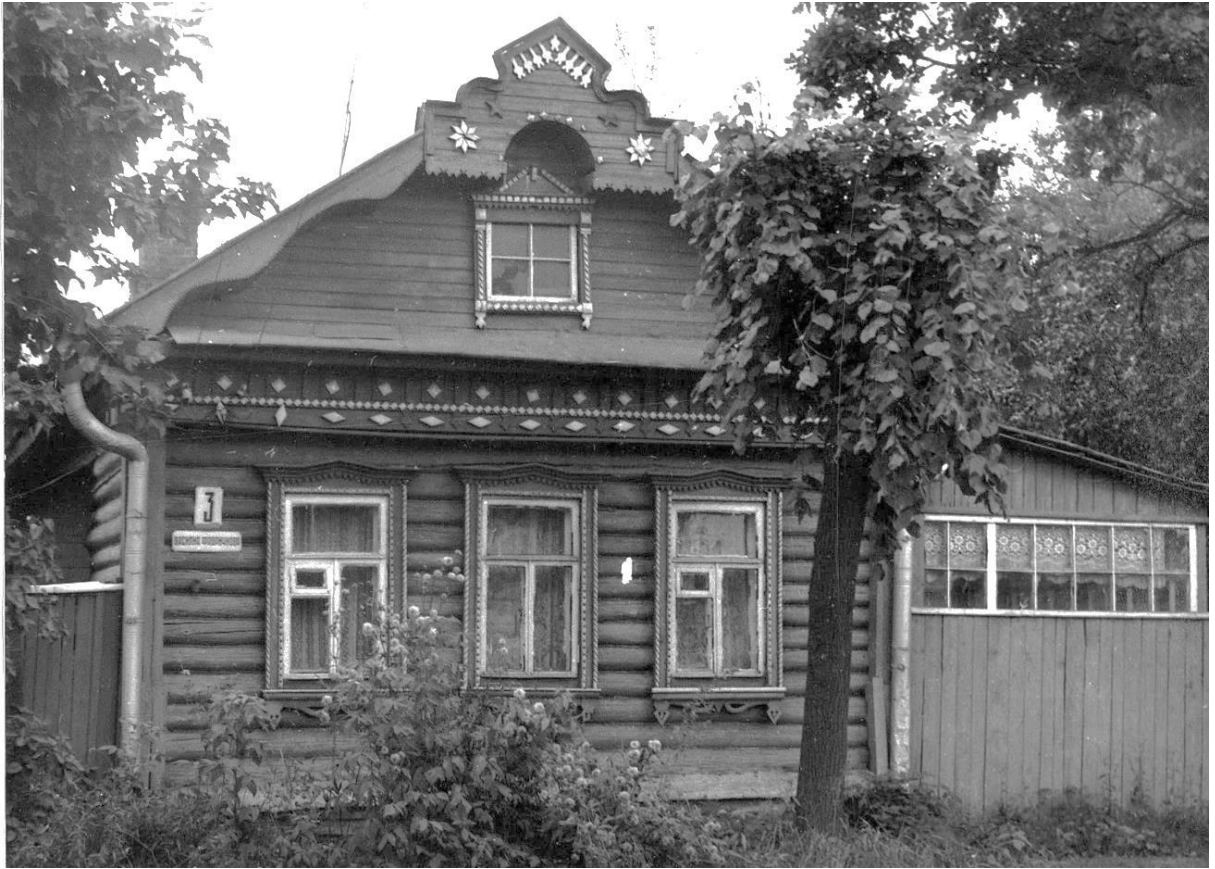
Ул. Фабричнова, 3. Дом жилой, 1920-е гг.

Московская область, г. Звенигород Комплекс застройки ул. Кузнечной, вторая половина XIX в. – 1920-е – 1930-е гг. Фото Г.К. Смирнова, 1987 г.