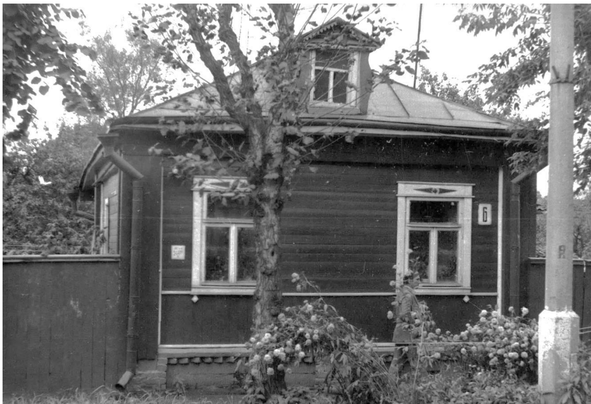
Ул. Фабричнова, 6. Дом жилой, XX в.

Московская область, г. Звенигород Комплекс застройки ул. Кузнечной, вторая половина XIX в. – 1920-е – 1930-е гг. Фото Г.К. Смирнова, 1987 г.