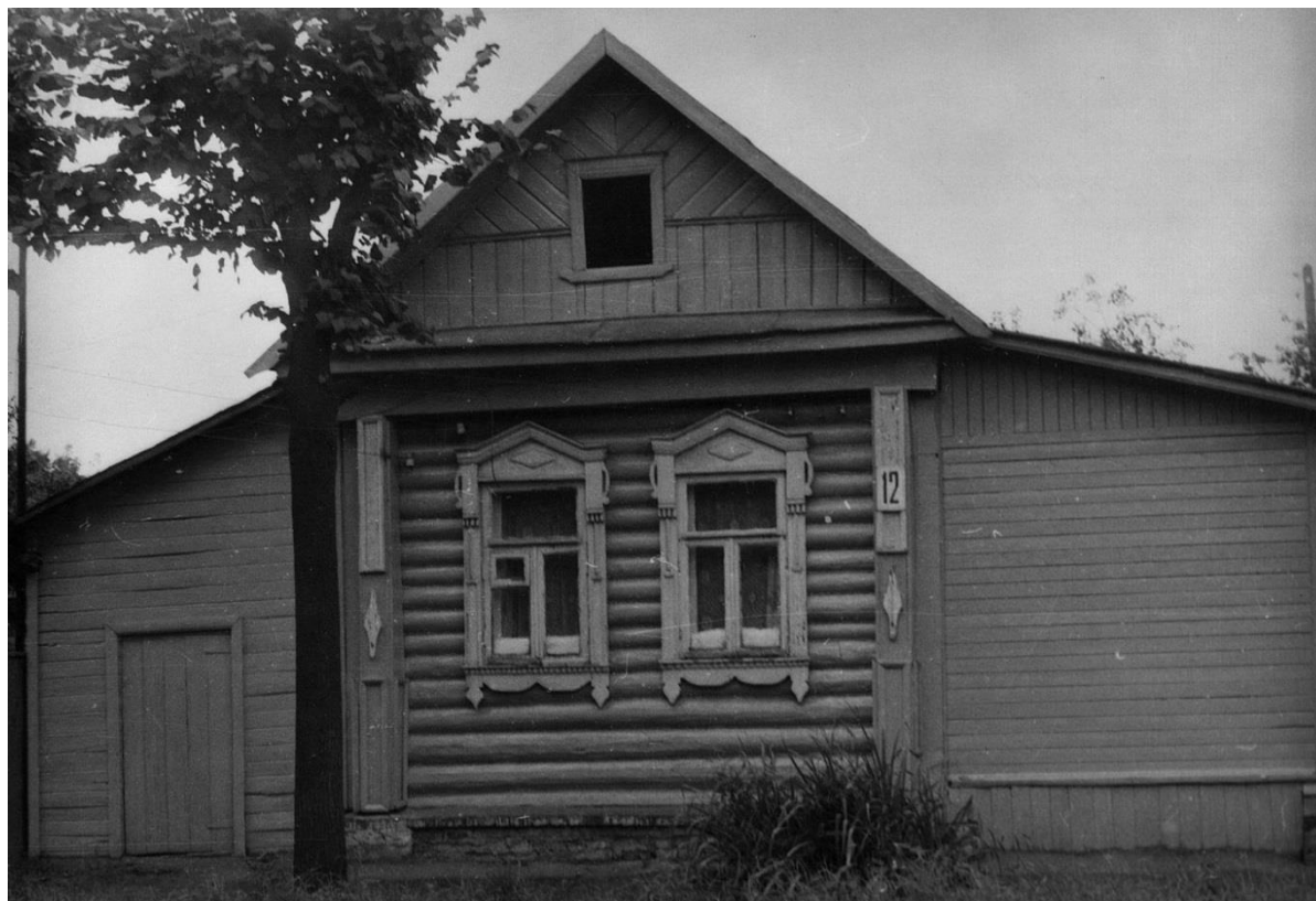
Ул. Фабричнова, 12. Дом жилой, 1890-е гг.

Московская область, г. Звенигород Комплекс застройки ул. Кузнечной, вторая половина XIX в. – 1920-е – 1930-е гг. Фото Г.К. Смирнова, 1987 г.