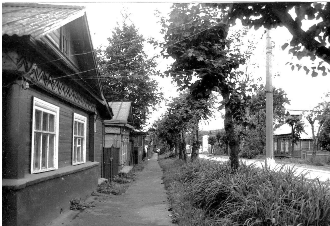
Фрагмент застройки. Вид на запад.

Московская область, г. Звенигород Комплекс застройки ул. Кузнечной, вторая половина XIX в. – 1920-е – 1930-е гг. Фото Г.К. Смирнова, 1987 г.