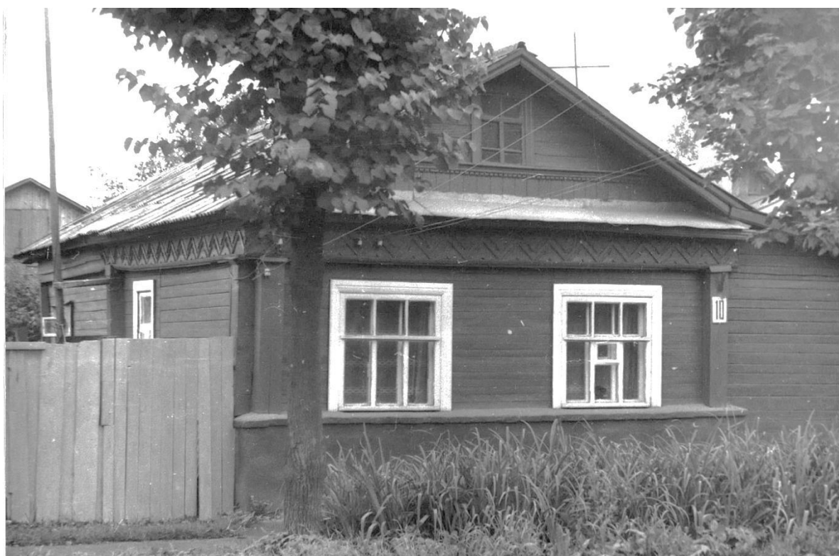
Ул. Фабричнова, 10. Дом жилой, конец XIX – начало XX вв.