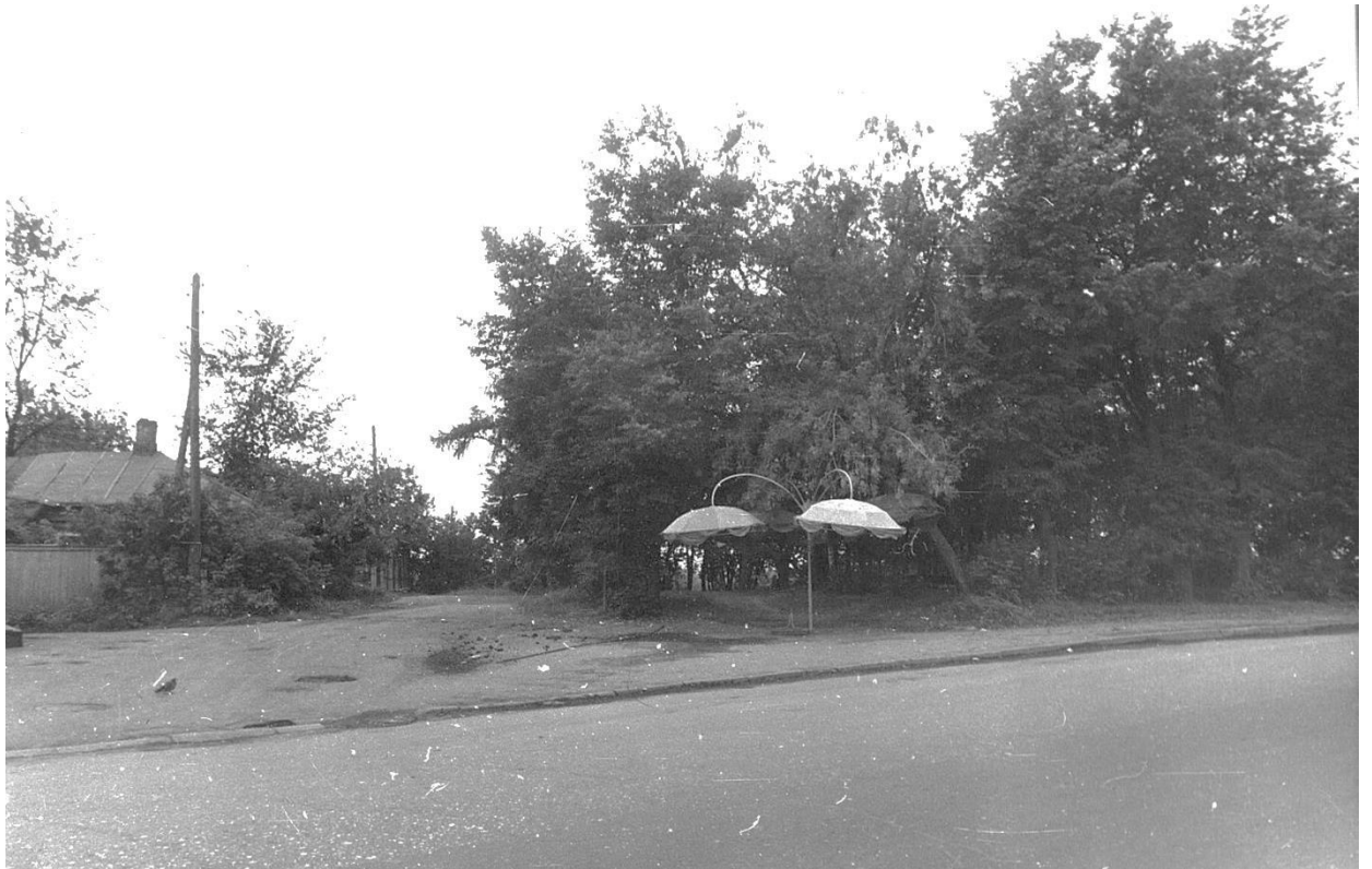
Вид площади с севера.