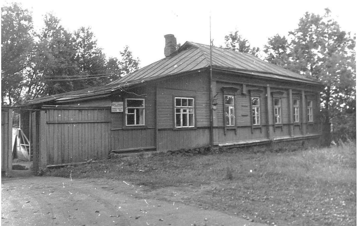
ул. Московская, 2.