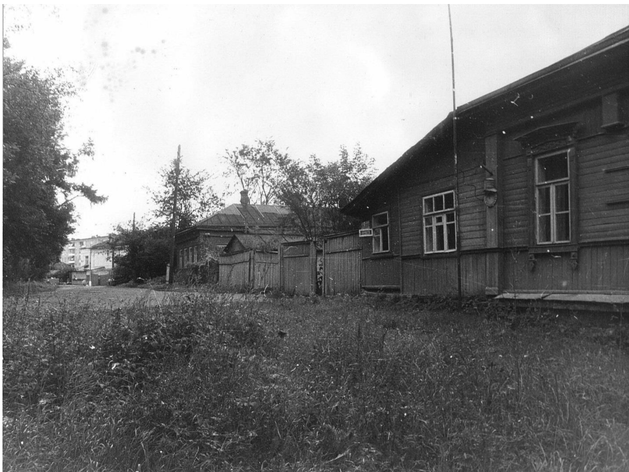
Московская область, г. Звенигород. Комплекс застройки Вознесенской площади, XIX в. ул. Московская, 2 – 6. Общий вид (с юга). Фото С.А. Никольского, 1987 г.

Генплан, фотографии, кроки обмеров и негативы хранятся в Московском областном Управлении культуры.