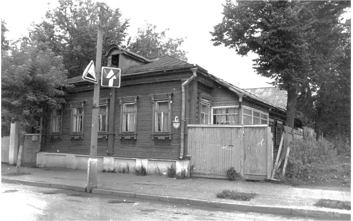
ул. Московская, 3.

Московская область, г. Звенигород. Комплекс застройки Вознесенской площади, XIX в. Фото С.А. Никольского, 1987 г.