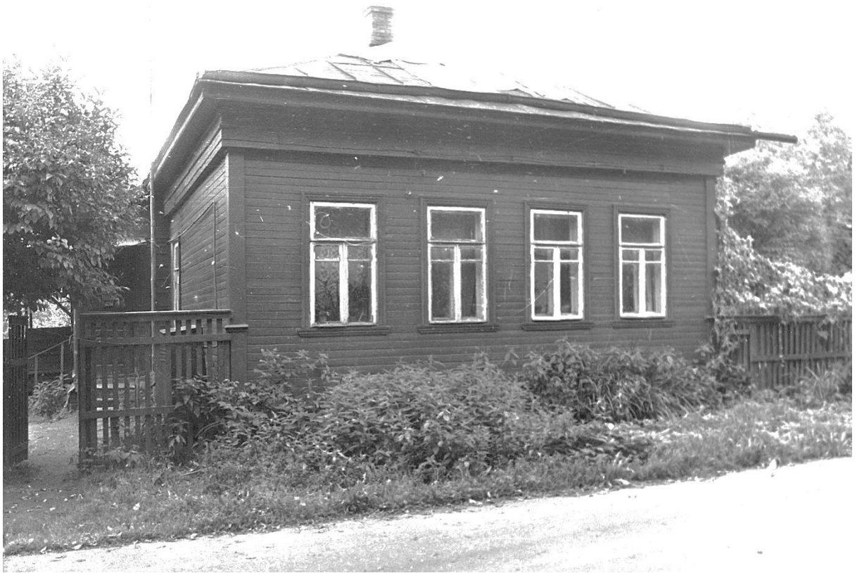
ул. Московская, 4.