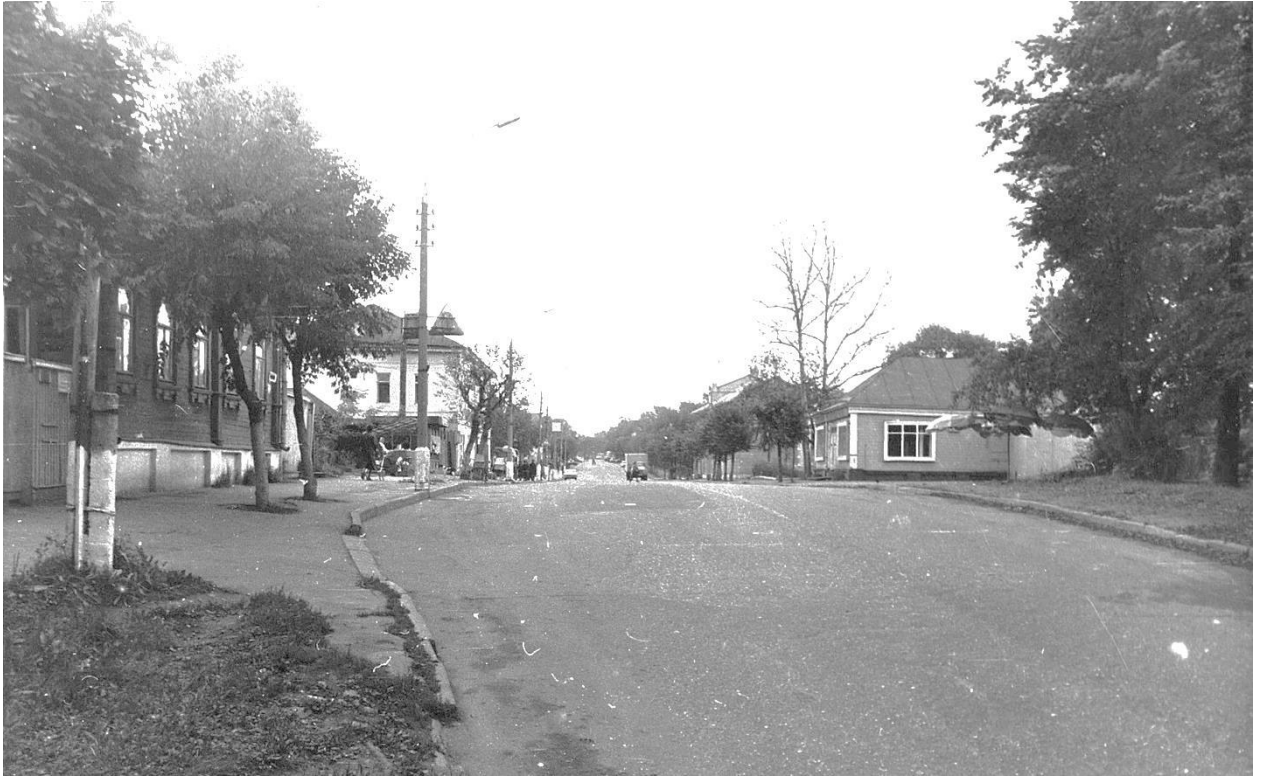
ул. Московская. Вид с запада.

Московская область, г. Звенигород. Комплекс застройки Вознесенской площади, XIX в. Фото С.А. Никольского, 1987 г.