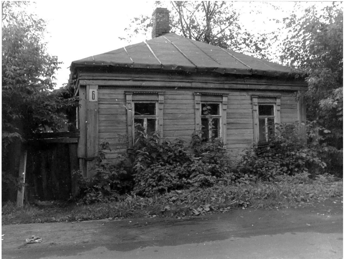
ул. Московская, 6. Московская область, г. Звенигород.