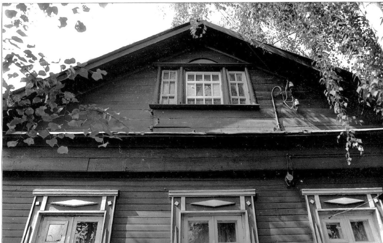
Фрагмент восточного фасада.