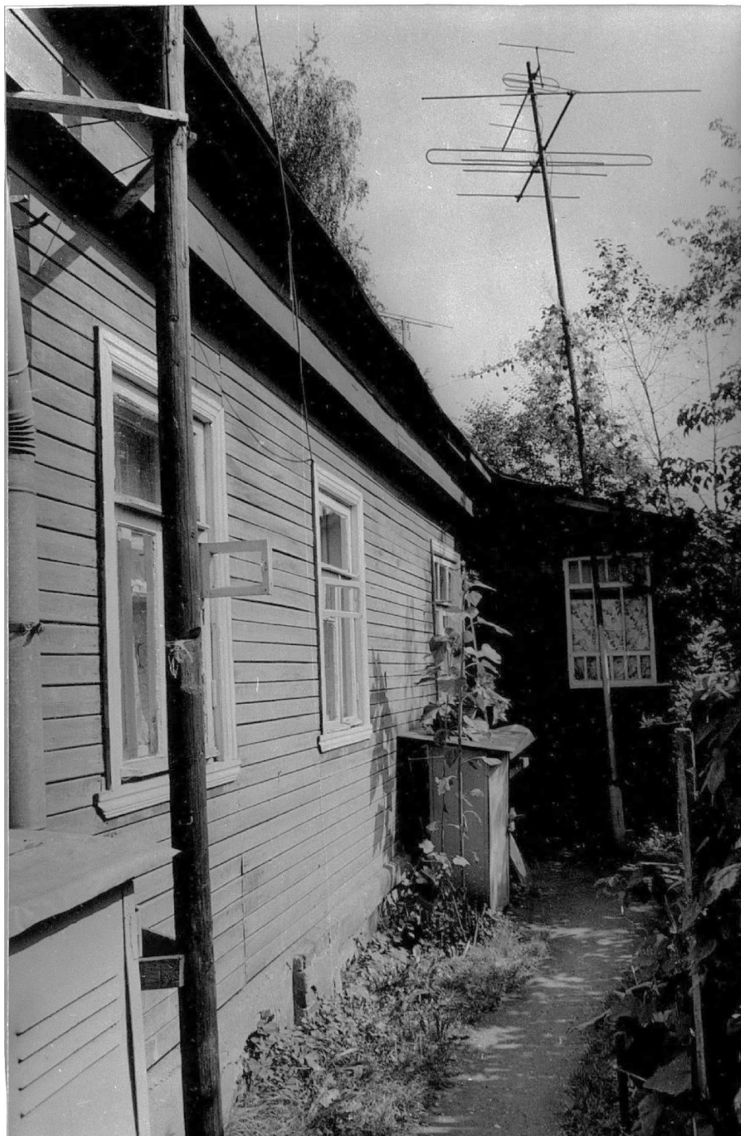
Фрагмент южного фасада.

Московская область, г. Звенигород, Пролетарская ул., 5. Жилой дом, вторая половина XIX в. 1987 г.