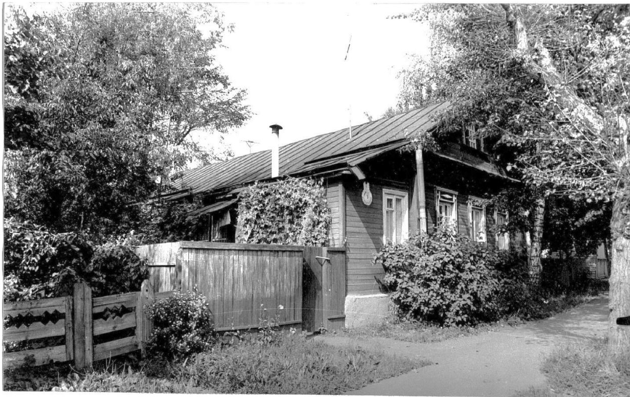
Общий вид с юго-востока.