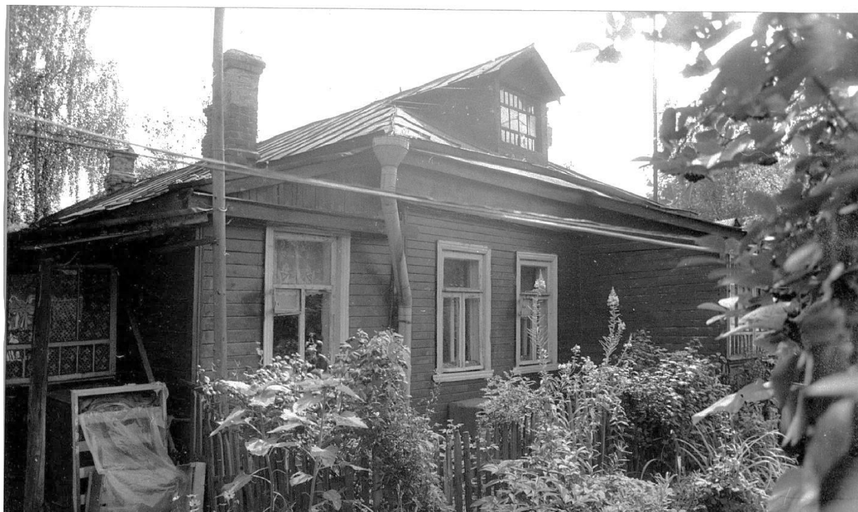
Вид с северо-запада.