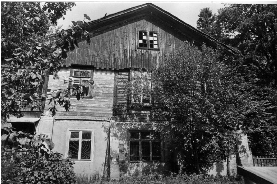
Общий вид с юга.