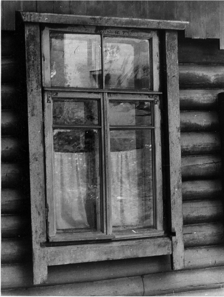
Окно второго этажа.

Московская область, г. Звенигород, ул. Октябрьская, 11 Дом Шаниных 1911 г. Фото С.А. Никольского, 1987 г.