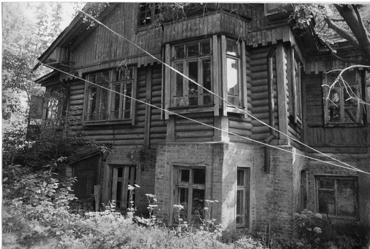
Фрагмент западного фасада.

Московская область, г. Звенигород, ул. Октябрьская, 11 Дом Шаниных 1911 г. Фото С.А. Никольского, 1987 г.