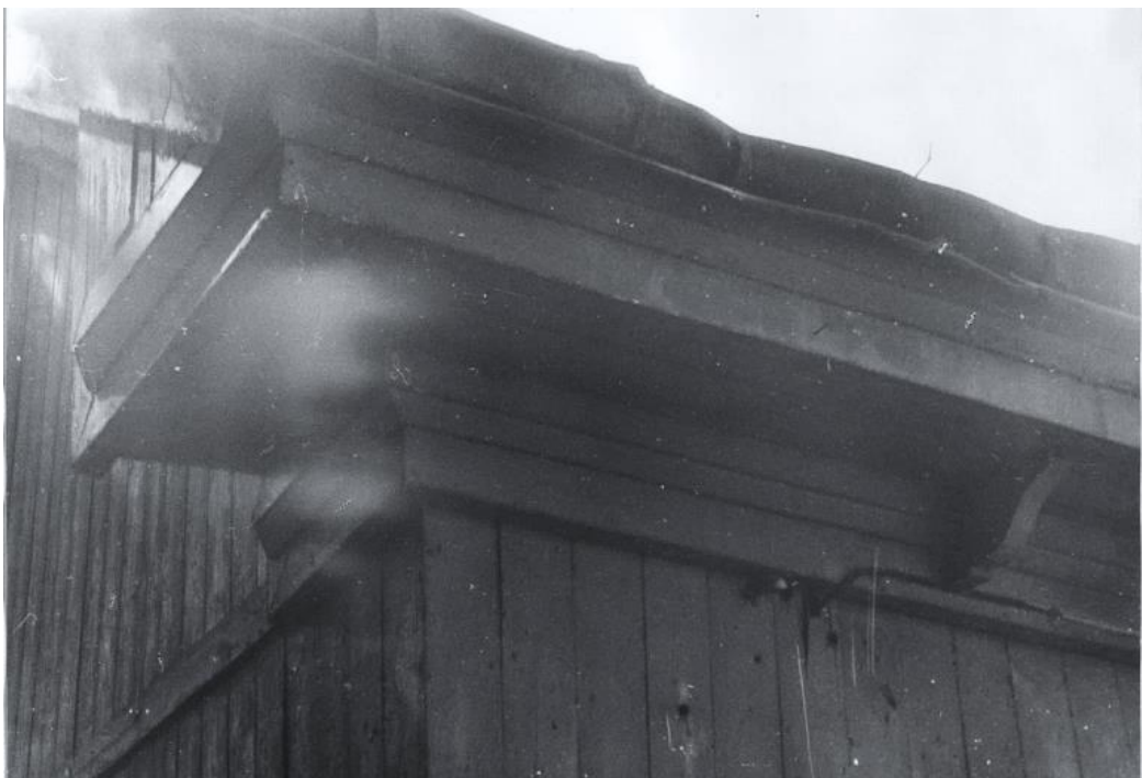
Венчающий карниз. Фото С.А. Никольского, 1987 г.