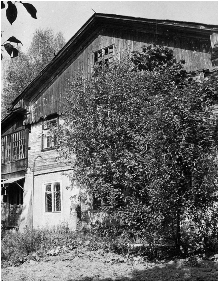
Общий вид с юго-востока.

Московская область, г. Звенигород, ул. Октябрьская, 11 Дом Шаниных 1911 г. 1987 г.