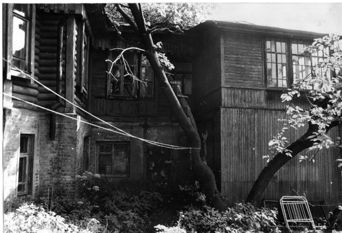
Фрагмент западного фасада.