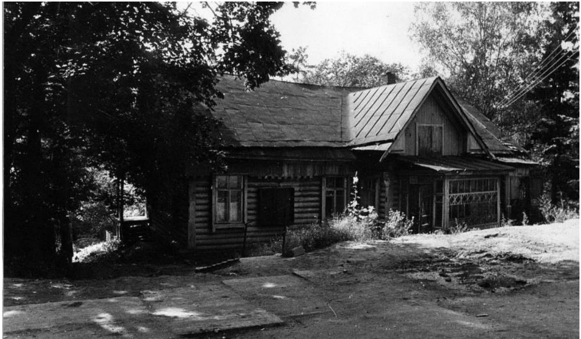
Общий вид с северо-востока.

Московская область, г. Звенигород, ул. Октябрьская, 11 Дом Шаниных 1911 г. Фото С.А. Никольского, 1987 г.