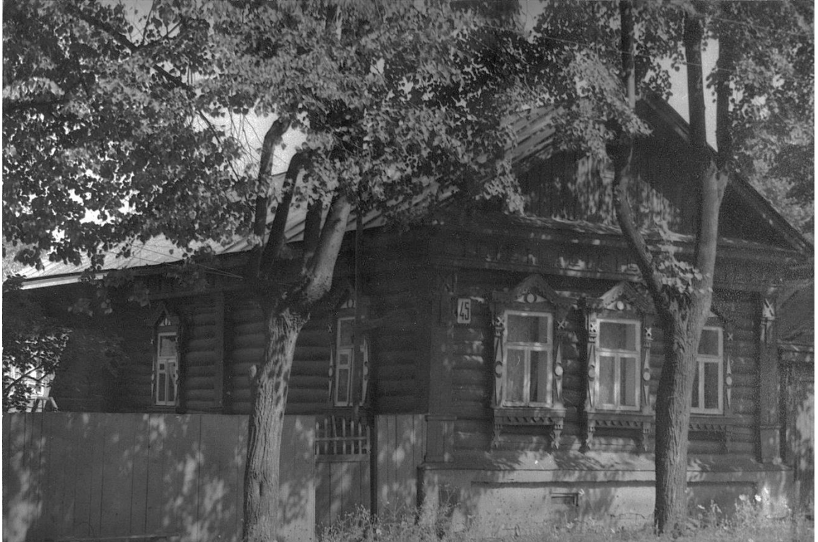
Вид с юго-запада.

Московская область, г. Звенигород, ул. Почтовая, 45. Дом Гавриловой, 1886 г. Фото Г.К. Смирнова, 1987 г.