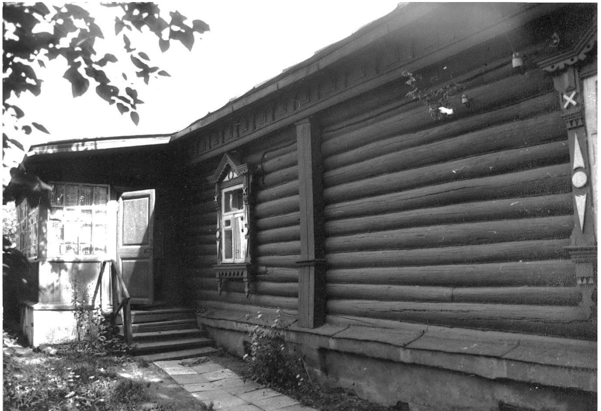
Фрагменты западного фасада.