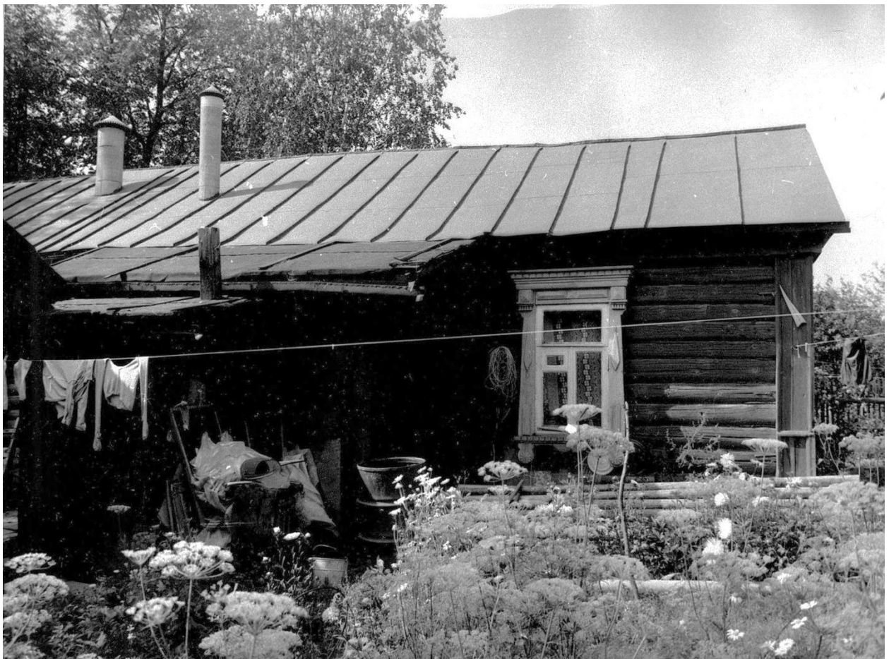
Фрагмент восточного фасада.