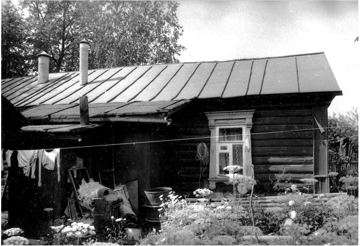
Фрагмент восточного фасада.

Дом Гавриловой, 1886 г. Фото Г.К. Смирнова, 1987 г.