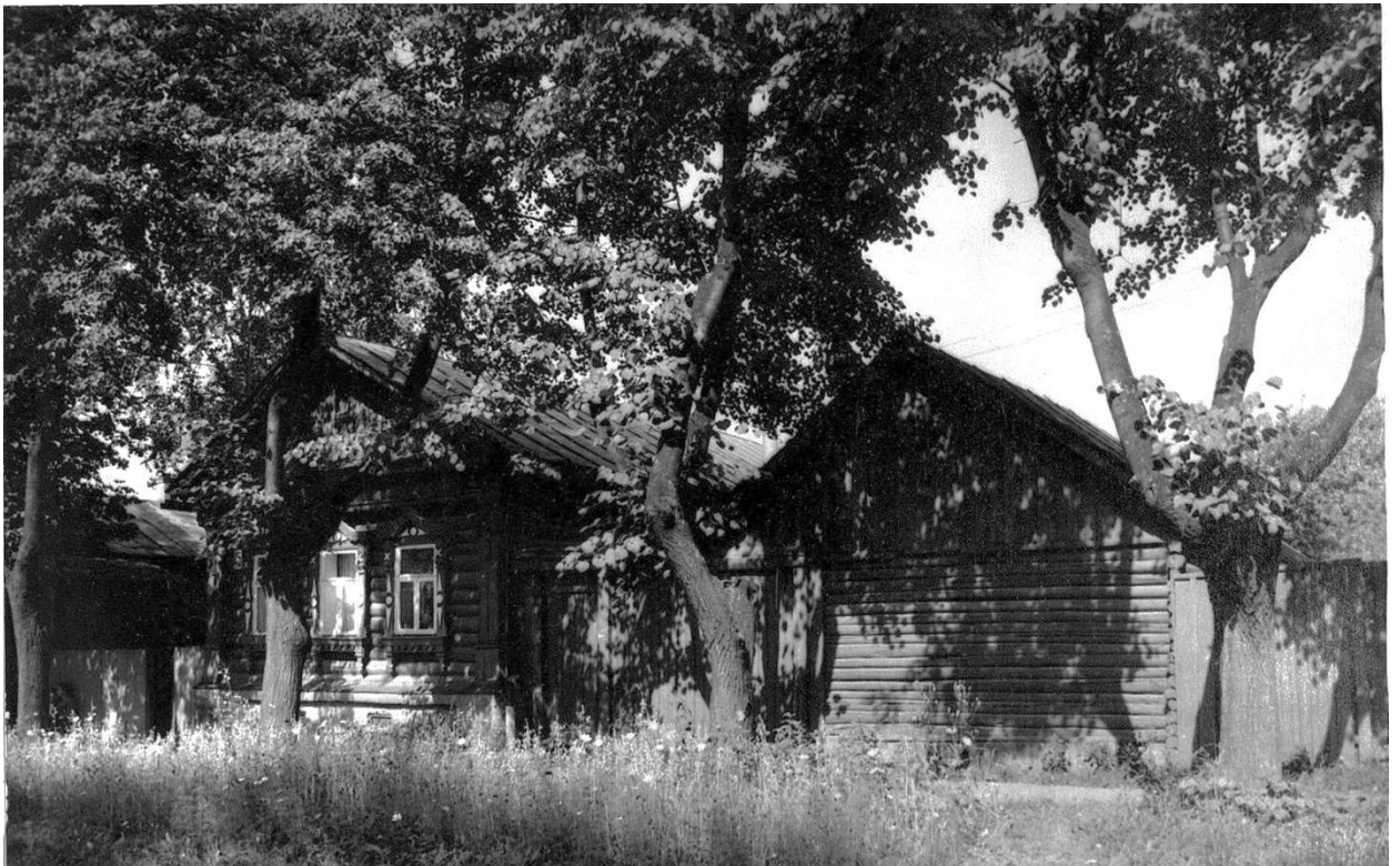
Вид усадьбы с юго-востока.