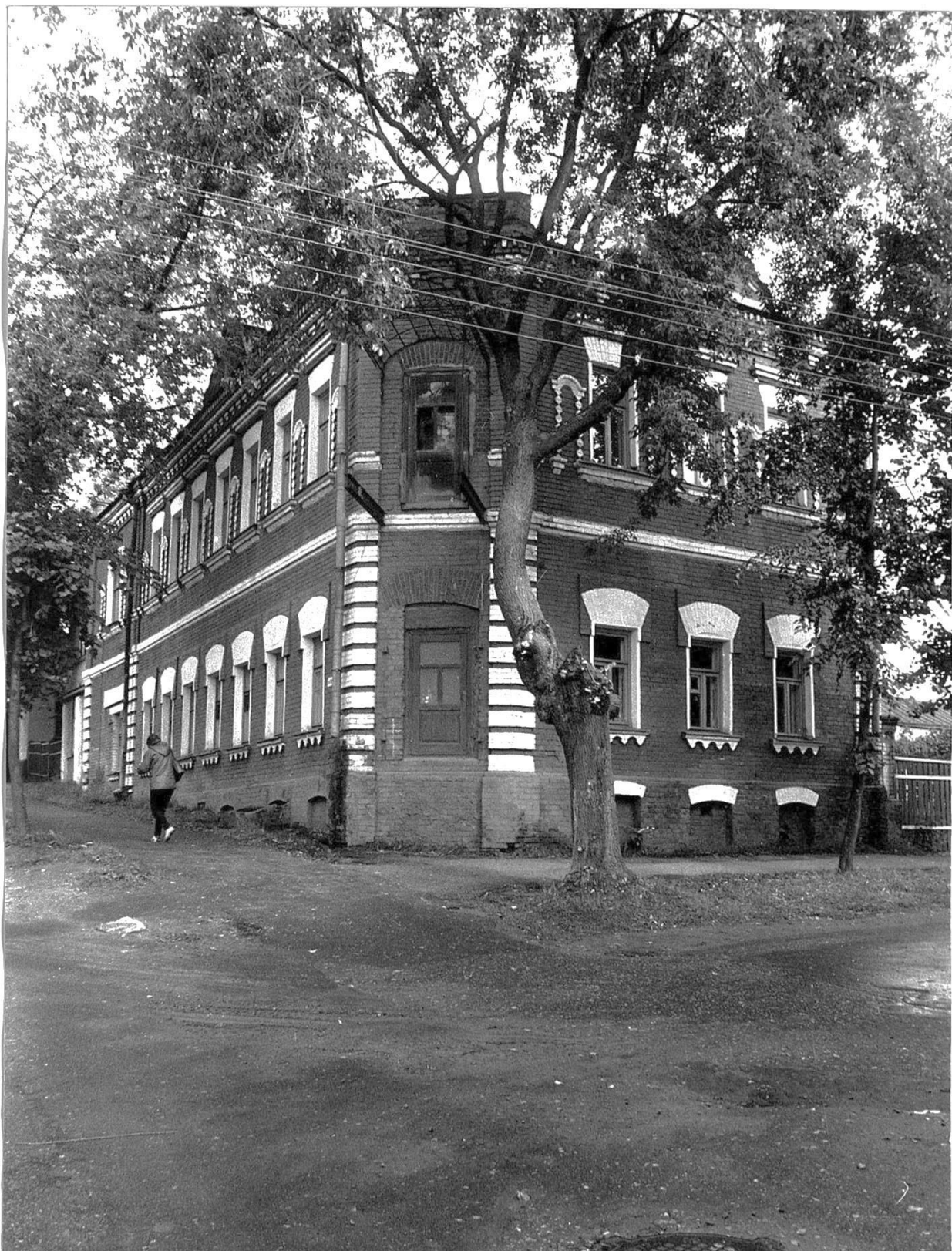
Общий вид с юга.

Московская область, г. Звенигород, ул. Почтовая, 19/16. Дом Соколовых с магазином, конец XIX в. Фото С.А. Никольского, 1987 г..