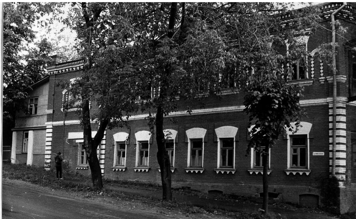
Общий вид с юго-запада.