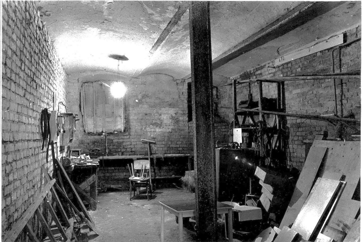
Интерьер полуподвала. Вид на запад.