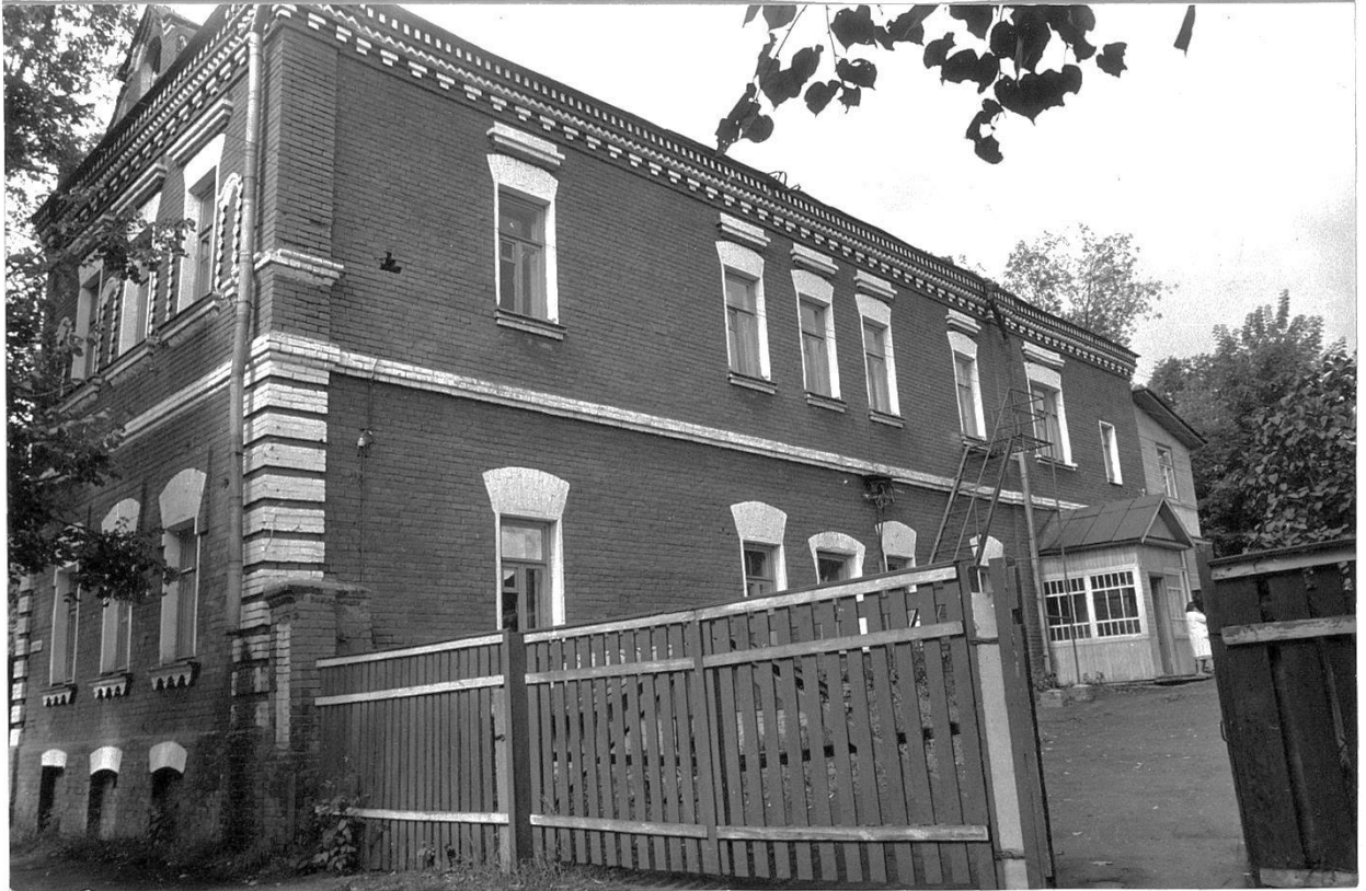
Общий вид с юго-востока.

Московская область, г. Звенигород, ул. Почтовая, 19/16. Дом Соколовых с магазином, конец XIX в. Фото С.А. Никольского, 1987 г..