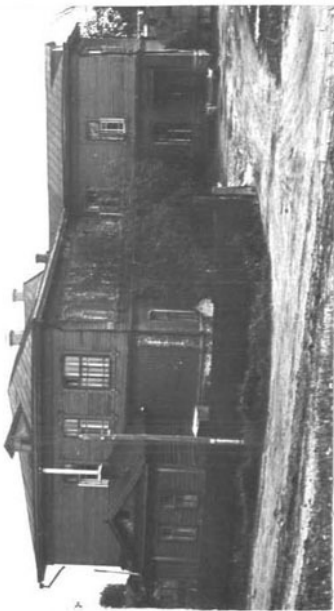
ЧКА (обратная сторона)