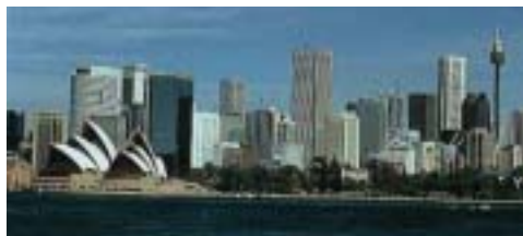
Sydney hiriko argazkia (Australia)