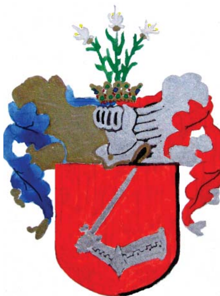
A szerző vízfestménye az oklevélben szereplő leírás alapján

Fontos adat még az oklevél pontos keltezése, valamint az érvényességhez szükséges kihirdetések záradékolása. Az oklevél kelte Gyulafehérvár, 1630. június 20. Az erdélyi országgyűlésen egy évvel később (1631. június 17-én), Zaránd megyei Borosjenőn tartott közgyűlésén pedig 1631. december 4-én hirdették ki, ellentmondás nélkül.