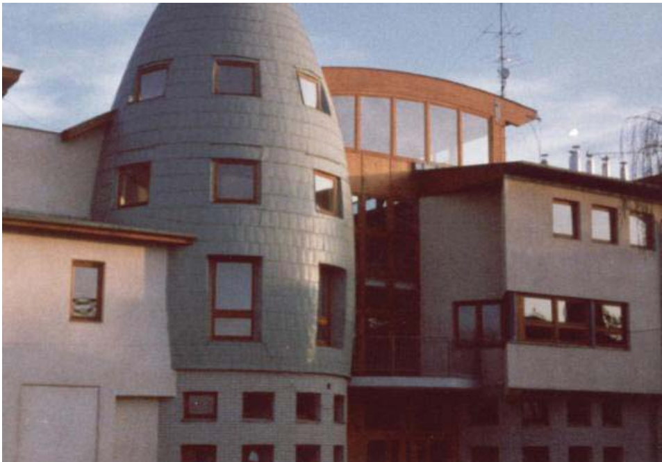
Nyírmeggyes ma: művelődési központ és könyvtár

A nagy lélekszám nyilvánvalóan a csekély vagyon elaprózódásával, illetve családon belüli rétegződéssel is együttjárt. A Szondiak közt voltak jobb módúak és szegények, jó erkölcsűek és kevésbé tisztességesek egyaránt. Kétség kívül kiemelkedtek társaik közül, akik a helyi közösség vezetőivé váltak. Az adott kornak megfelelő poszton, volt köztük városi főbíró és falusi bíró, illetve nemesek hadnagya és egyházgondnok egyaránt (ahogyan később, az általam már nem vizsgált 20. században, bíró és tanácselnök is). Aligha tévedünk, ha a másik oldalra soroljuk azokat a (minden bizonnyal többséget alkotó) családtagokat, akik néhány holdnyi parcellán, gazdálkodásból próbálták megélni, vagy másnak a szolgálatába, illetve napszámossnak szegődtek, s nemességükről is lemondtak. Ily módon a családról alkotott kép egyáltalán nem egységes, viszont az egész község társadalmáról, életéről is árulkodik.