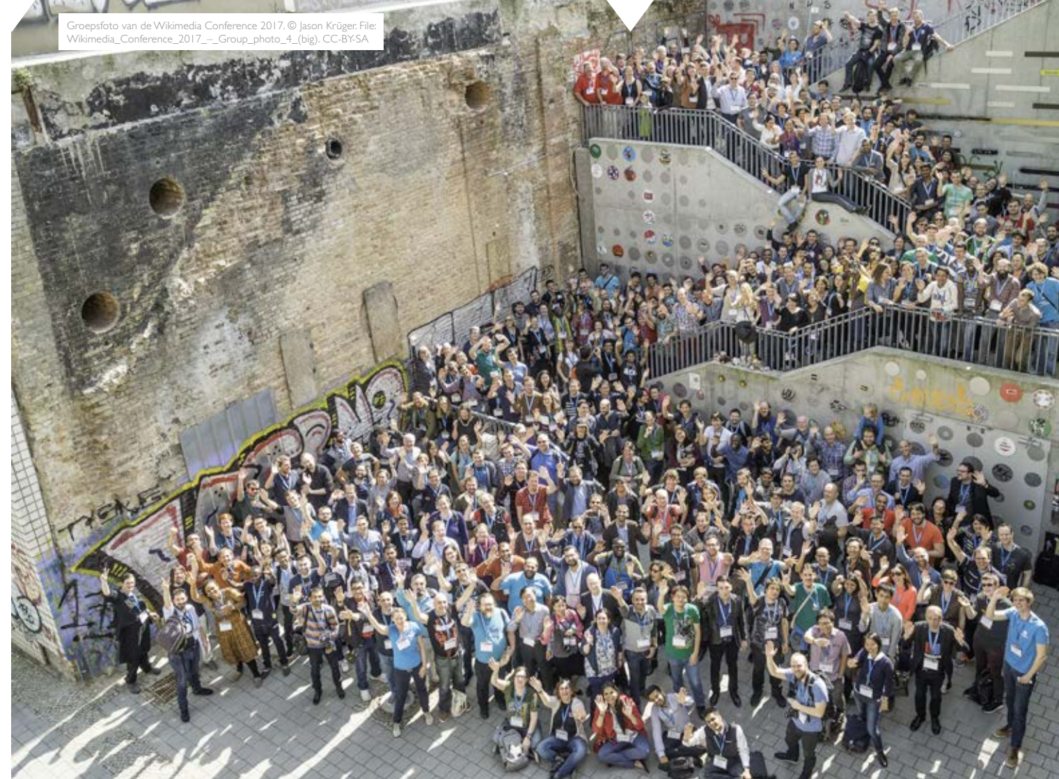
Groepsfoto van de Wikimedia Conference 2017. © Jason Krüger. File: Wikimedia_Conference_2017_-_Group_photo_4_(big). CC-BY-SA