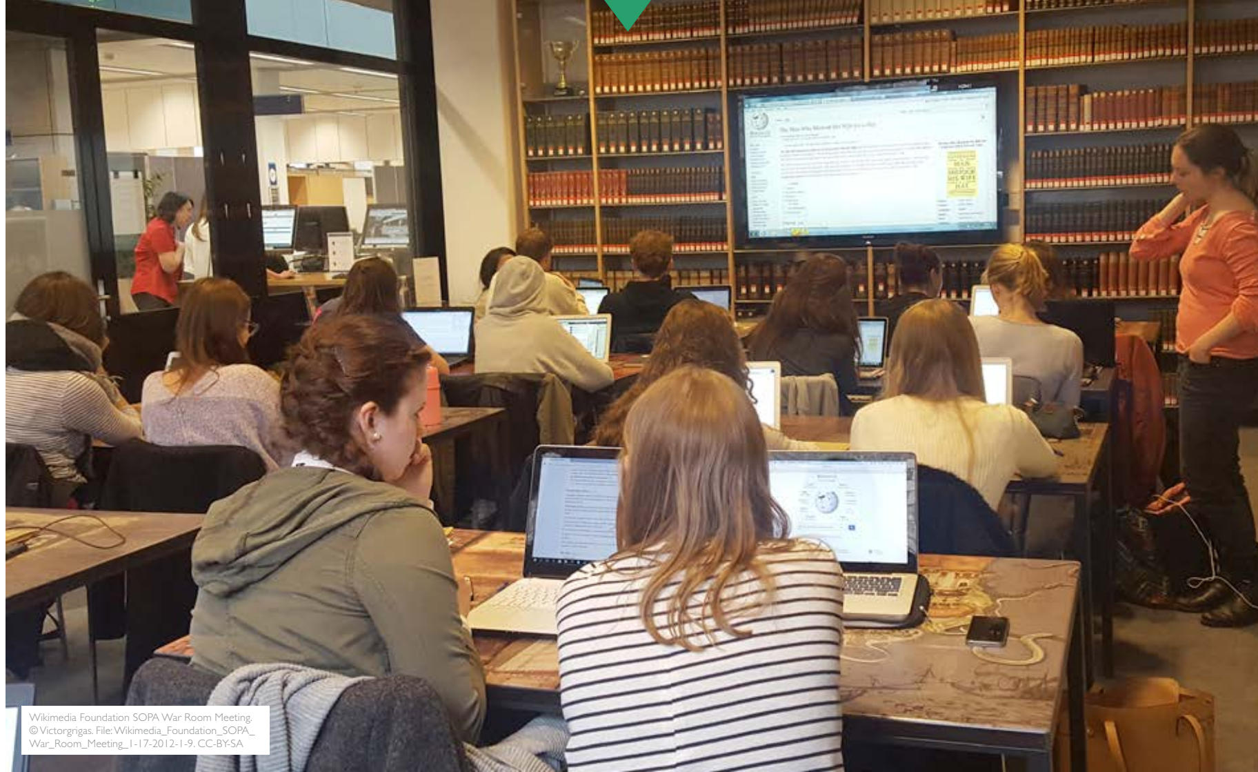
Wikimedia Foundation SOPA War Room Meeting. File:Wikimedia_Foundation_SOPA_War_Room_Meeting_1-17-2012-1-9. CC-BY-SA