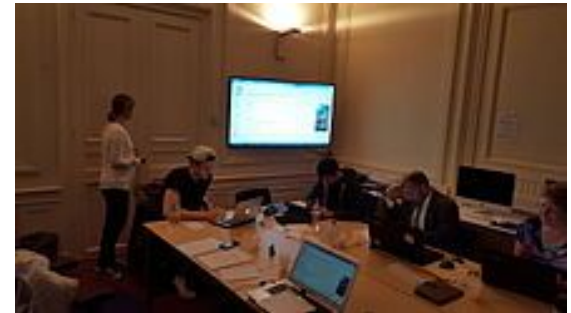
Education programme: editor training at Maastricht University