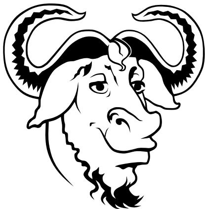
Głowa GNU - symbol Free Software Foundation, autor Aurelio A. Heckert, 12 grudnia 2005, Free Art License 3

Licencja GNU FDL nakłada następujące wymagania (zarówno przy użyciu kopii dosłownych utworów jak i tworzeniu utworów zależnych):