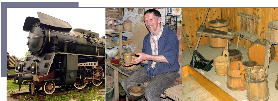
Skansen taboru kolejowego w Chabówce.

W trakcie wycieczek uzyskiwane były zgody na fotografowanie od dyrekcji i właścicieli odwiedzanych miejsc. Dzięki temu uczestnicy mieli możliwość wykonania obszernej dokumentacji fotograficznej a ich zdjęcia wzbogaciły zasoby ilustracyjne projektów Wikimedia.