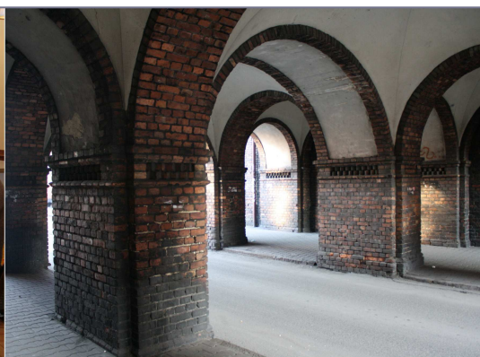
Katowice, Nikiszowiec - podcienia familoków.

Drugiego dnia zorganizowano wycieczki do historycznego osiedla robotniczego Katowice Nikiszowiec, a następnie do najstarszej części dzielnicy Giszowiec. W trakcie zwiedzania uczestnicy wykonali bogatą dokumentację fotograficzną odwiedzanych miejsc, która wzbogaciła zasoby projektów Wikimedia o doskonałej jakości ilustracje.