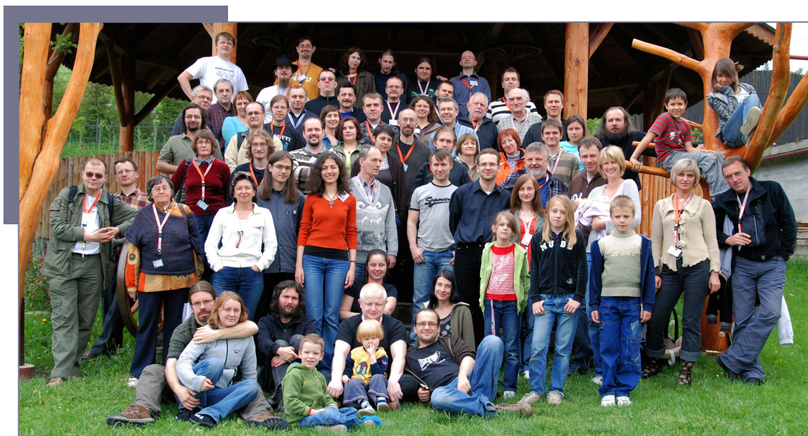
Uczestnicy Konferencji Wikimedia Polska 2008. Zdjęcie: Lilly M, licencja: cc-by-sa

Celem konferencji było stworzenie platformy wymiany doświadczeń i opinii na temat projektów Wikimedia oraz innych inicjatyw tworzenia otwartej wiedzy i wolnej twórczości za pomocą ukierunkowanych na społeczności stron internetowych. Konferencja otwarta była także dla specjalistów z zewnątrz (aspekty społeczne, prawne, techniczne), których analizy, w tym konstruktywna krytyka, mogłyby przyczynić się do rozwoju projektów.