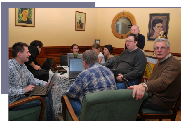
Złot zimowy - dyskusje w grupach.

W czasie pierwszego dnia Złotu przeprowadzone zostały plenarne wykłady i dyskusje dotyczące najnowszych zmian wprowadzonych w projektach Wikimedia. Omówione zostały m.in. propozycje usprawnień dotyczące wersji przejrzanych artykułów w polskiej Wikipedii, wprowadzana reforma procedury zgłaszania stron do usunięcia oraz narzędzia do standaryzacji cytowania źródeł. Następnie w podgrupach dzielono się praktyczną wiedzą korzystania z nowych narzędzi oraz omawiano plany realizacji przedsięwzięć w kolejnym roku, także w ramach działalności Stowarzyszenia.