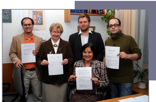
Zawiązanie Koalicji Otwartej Edukacji. Zdjęcie: Paweł Nasiłowski, licencja: cc-by-sa 3.0