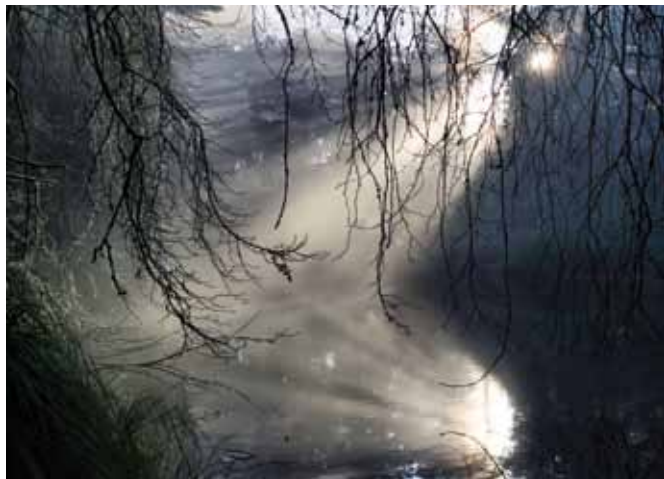
Foto: ovan: Paulrudd, CC-by-sa-3.0; mitten till vänster: Richard Bartz, CC-by-sa-2.5; mitten till höger: Der Sündenbock (William Holman Hunt); nedan till vänster: NASA (fri från upphovsrätt); nedan till höger: Mila Zinkova, CC-by-sa-3.0