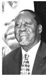
(Foto: Il presidente Kibaki e il capo dell'opposizione Odinga)

evidente e finora si son raggiunti i 350 morti e 100.000 sfollati: per risarcire a questi ultimi lo Stato dovrebbe spendere una somma equivalente a circa 5 milioni di euro.