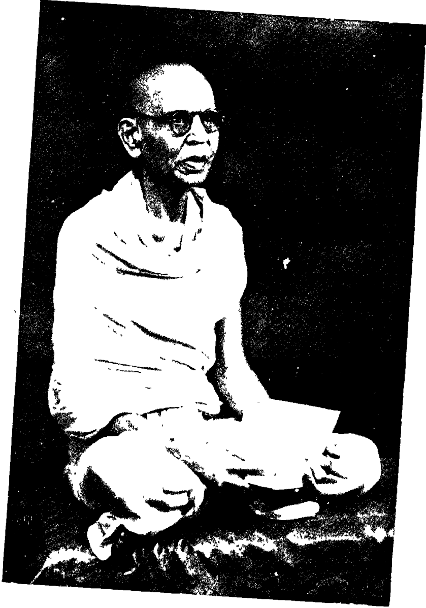
स्व ब्र जीवराज गौतमचंद दोशी म्व रो ता १६-१-५७ (पौष शु १५)