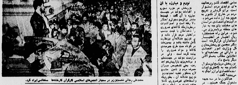
محمد علی رجایی نخستوزیر در سخنان اجلاس هیأت اسامی کارگران کارخانه ساسلی ایلام کرد.

باید میان حق و وظیفه فرق قائل باشیم. این سخن را محمد علی رجایی نخستوزیر در سخنان اجلاس هیأت اسامی کارگران کارخانه ساسلی ایلام کرد. وی در این اجلاس که در محل کارخانه ساسلی ایلام در جریان بود، با جمعی از کارکنان این کارخانه دیدار کرد و با آنها گفتگو نمود. وی در این دیدار، به بیان حقوق کارکنان و وظایف آنها پرداخت و اظهار داشت: «باید بدانیم که کارکنان کارخانه ساسلی ایلام، علاوه بر حقوق خود، وظایف مهمی را نیز بر عهده دارند. این وظایف عبارتند از: تولید محصول، رعایت بهداشت و ایمنی، و همکاری با مدیران کارخانه. اگر کارکنان این وظایف را به درستی انجام دهند، کارخانه ساسلی ایلام قادر خواهد بود که سهم خود را در توسعه اقتصادی کشور ایفا کند.»