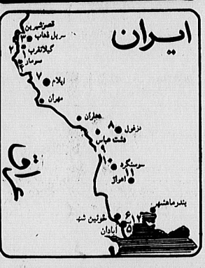
وضع عمومی جبهه ها

اسکناس های هزار تومانی جدید از شبیه به بازار می آید