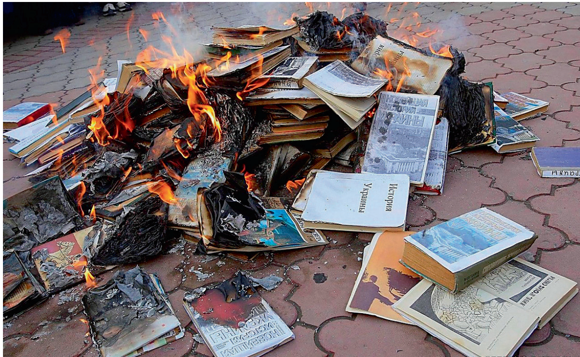
Підручники з історії України, які спалювали у Криму в 2014 році

Законопроект було внесено ще 18 листопада 2020 р.; наприкінці грудня його ухвалили у першому читанні. Текст документа передбачав, що уряд розробить форми контролю діяльності приватних осіб та організацій, що займаються освітою. До слова, прикметно, що після першого читання з числа авторів законопроекту без пояснення причин вийшла скандальна кримська колаборантка Наталя Поклонська. Не менш прикметним є те, що авторами законопроекту стали члени Тимчасової комісії Ради Федерації з