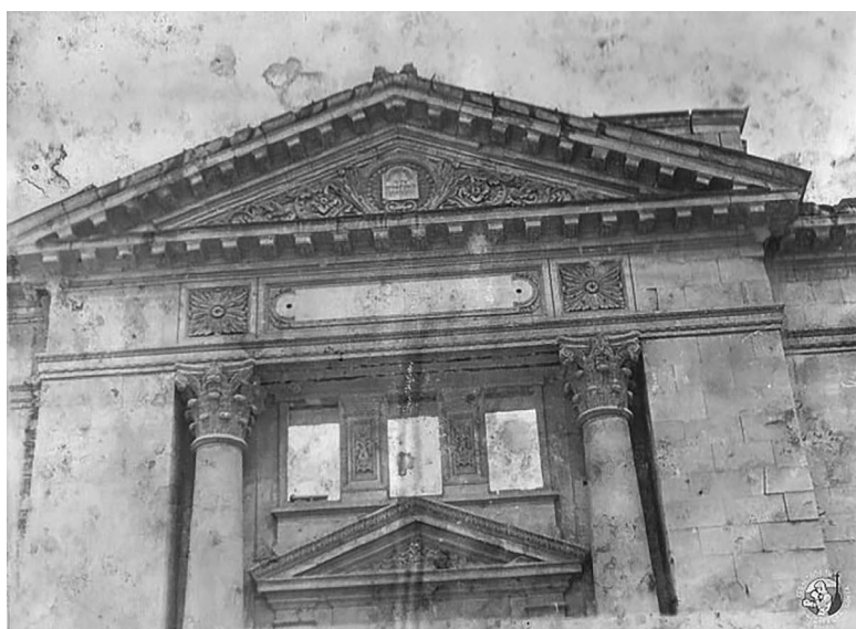
Фасад кенаси в Севастополі

Матеріал вибрали надійний і якісний – кримбальський камінь. Це – вапняк із вкраплен-