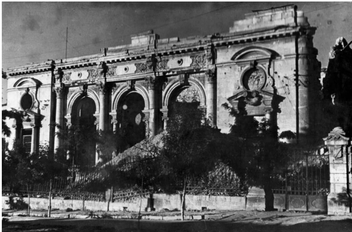
Севастопольська кенаса після війни

середньовічного Херсона чимало цікавого розповідає відомий текст християнської традиції – «Життя святого Костянтина (Кирила) Філософа». У нас святий Костянтин-Кирило найбільше відомий як вчений муж, який разом зі своїм братом Мефодієм створив слов'янську абетку, що й отримала назву за його ім'ям – кирилиця.