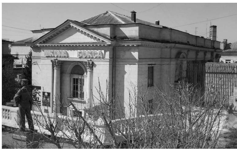
Сучасний вигляд кенаси в Севастополі