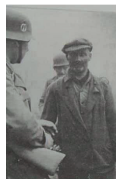
Солдаты Ваффен-СС ведут арестованного крымского партизана

жилплощадь. Поэтому семья зачастую размещалась в землянках, полуразрушенных домах, клубных зданиях и т. д. Выделение крымским татарам приусадебных участков для улучшения материально-бытового состояния проходило крайне медленно. Так, например, из 38 168 семей крымских татар, расселённых в Узбекистане, по состоянию на 15 августа 1944 года приусадебными участками и индивидуальными огородами было наделено 18 180 семей, или 47,6%. В ряде областей при разла-