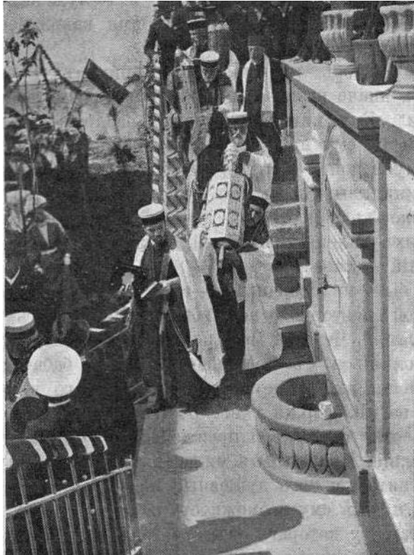
Освячення севастопольської кенаси

У середні віки Херсонес став називатися Херсоном. Про юдеїв