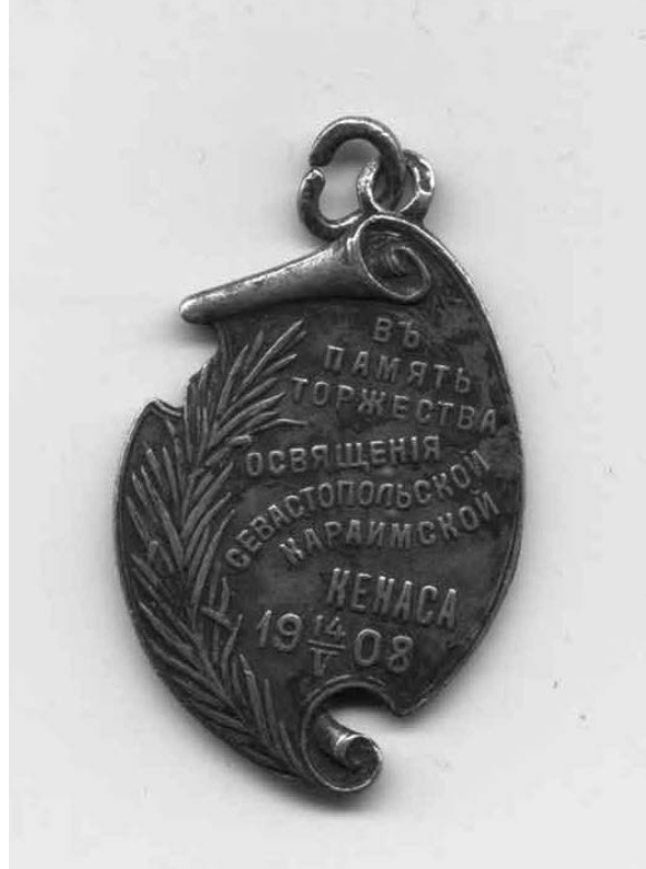
Значок на честь відкриття кенаси у Севастополі